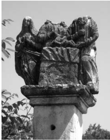
Četvrto otajstvo (postaja) radosne krunice »Koga si Djevice u Hramu prikazala«, smješteno danas ispod sela Divjaki

loškom raščlambom koja ne polazi od njihova nastanka, već ide retrogradno, od predodžaba koje su danas žive u puku. Te predodžbe dio su folklorne predaje, usko naslonjene na pučku pobožnost. Stoga valja poći od pretpostavke da imamo pred sobom krhotine nekoć uređena svetoga prostora kojega sada valja, koliko se to još može, rekonstruirati. Zato nam je prvi cilj provjeriti tu pretpostavku.