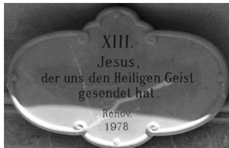
Mariazell, Rosekranzweg, XIII. otajstvo, ploča s brojem postaje

Populus non est scandalosus, quia D. Comit multam curam eiusdem habet, & magnam Disciplinam, qui etiam multa bona facit, nempe 15 mysteria B V. in columnis lapidaris ab arce' Klenovnik incipiente usque a Capella S. Wolfgangi fieri curavit, & apud S. Wolfgangum Sepulchr Xti Dni ppriis expensis ibidem coemitarium maiorii expenstis suis expensis D. Comit extruxit. 14