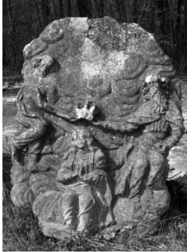
Peto otajstvo slavne krunice »Koji je tebe Djevice na nebu okrunio«, kraj izvornoga položaja pred ulazom u cinkтуру kapele sv. Vuka/Wolfganga

nje temelja nekog starijeg sakralnog objekta, ali su isto tako mogući i ostaci iz antičkog perioda, pa čak i iz pretpovijesti. 9