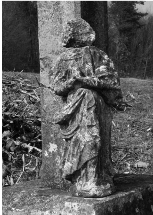
Četvrto otajstvo slavne krunice »Koji je tebe Djevice na nebo uzeo«, na izvornome mjestu; kip spušten k podnožju pila

Predaja o smrti ipak je dominantna. A na koji način »smrt« kao misao vodi- lja pri oblikovanju klenovničke cjeline može utjecati i na interpretaciju izdvo- jenih elemenata, razabire se u kaziva- njima o sadržaju jednoga od bolje sa- čuvanih pilova na kojem se raspoznaju dvije osobe: klečeći muškarac i ženski lik s kaležom nad njime. U pučkoj in- terpretaciji u muškarcu se prepoznaje ugledni pokojnik, a u ženskome liku sveta Barbara – svetica poznata kao za- govornica za sretnu smrt , kojoj je kalež jedan od atributa. Zbog tih tako »prepo- znatljivih« elemenata u klenovničkom je kraju ta skupina poznata kao Bar- bara prvopričesnica . Naziv je utoliko neuobičajen što se sv. Barbara ne može povezati s prvom pričesti, nego, even- tualno, s posljednjom, u okviru obreda bolesničkoga pomazanja, koje se ranije nazivalo posljednjom pomasti .