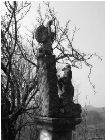
Prvo otajstvo žalosne krunice »Koji se za nas krvlju znojio« (pučki: »Barbara prvopričesnica«), na izvornome mjestu

loškom raščlambom koja ne polazi od njihova nastanka, već ide retrogradno, od predodžaba koje su danas žive u puku. Te predodžbe dio su folklorne predaje, usko naslonjene na pučku pobožnost. Stoga valja poći od pretpostavke da imamo pred sobom krhotine nekoć uređena svetoga prostora kojega sada valja, koliko se to još može, rekonstruirati. Zato nam je prvi cilj provjeriti tu pretpostavku.