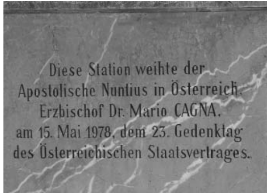
Mariazell, Rosekranzweg, XIII. otajstvo, ploča s natpisom o donatoru

Saznajemo da pučanstvo nije sablazno, i to zahvaljujući velikoj skrbi gospođe grofice. Ona je, naime, dala, između ostaloga, postaviti o svojem trošku »15 otajstava Blažene Djevice« na kamenim stupovima, počevši od dvorca Klenovnik do kapele sv. Wolfganga, a postavila je i Božji grob kod kapele sv. Wolfganga. Jasnno je vidljivo da je riječ o aktualnoj comitissi , grofici Mariji Magdaleni, a ne o nekoj ranijoj, ili možda o grofu. Vizitacijska izvješća inače, i prije i poslije 1672., o vukovojskim pilovima šute sve do godine 1786., kada se tražilo njihovo uklanjanje.