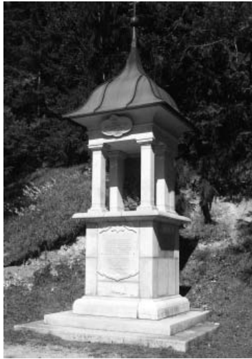
Mariazell, Rosekranzweg, XIII. otajstvo, poklonac uz hodočasničku šetnicu

Ovaj podatak, naime, da su kipovi postavljeni godine 1672., lijepo se poklapa s rezultatom stilske analize ostataka skulptura na pilovima. Nevolja je samo u tome što je ban Ivan III. Drašković postao banom i vrhovnim zapovjednikom Karlovačke krajine godine 1640., a nakon što je 1646. bio izabran za ugarskog palatina, pretežno je boravio u Ugarskoj. Ondje je i umro i bio pokopan uz svojega oca Ivana II. u požunskoj crkvi sv. Martina, i to godine 1648., 24 godine prije vremena što ga navodi Spomenica. Ako je godina izrade i postavljanja pilova točna (a stilska analiza, koliko je već zbog teških oštećenja provediva, doista potvrđuje to vrijeme), onda ban Ivan III. Drašković nije mogao naručiti klenovničke kipove. U obzir dolazi njegov nasljednik Ivan IV. Drašković, grof i podmaršal (ali nije bio banom), vlasnik Klenovnika, a koji je živio od oko 1630. do 1692., dakle, u vrijeme izrade pilova. No malo je vjerojatnosti da bi on potaknuo njihovu izradu jer je rijetko boravio u Klenovniku, a niti je povod za njihov nastanak mo-