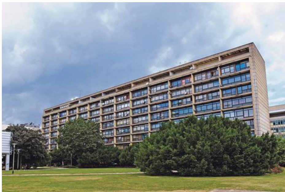
Slika 3 – Drago Galić: Višestambena zgrada u Zagrebu, Ulica grada Vukovara 43, 43a; 1959.

Na ovoj drugoj zgradi opet su studiozno postavljeni betonski brise-soleil 3 južne fasade, proračunati prema upadu zraka sunca (kao uostalom i parapeti velikih staklenih stijena dnevnoga boravka i južne spavaće sobe), perforirani poput kakve uske betonske pergole. Međutim, dok je Le Corbusierov Unite afirmacija egzemplarne plastike betona, projektiran istovremeno iznutra i izvana, u kojemu dodani prefabrikati (betonski brise-soleili , stubišta...) ne ruše konzistentnost cjeline, Galićeva struktura s neovisnim južnim pročeljem djeluje poput iznutra projektiranoga stroja koji je zatvoren s četiri tanke, vitke plohe, i to je već na prvi pogled uočljiva razlika i od prve zgrade i od Marseillea [2].