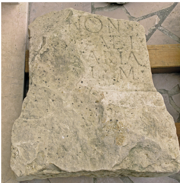
Slika 2. Fotografija žrtvenika Junone iz Magna (snimio: I. Glavaš, 2011).

Prema imenovanju dedikanta Publija Elija Apera jasno je da je civitet dobio od Hadrijana ili je potomak nekoga tko je dobio civitet od cara Hadrijana. Treći natpis koji bilježi carski gentilicij Aelius nalazi se na još neobjavljenoj ari izrađenoj od domaćega kamena – muljike (sl. 2). Ara je pronađena 1981. godine prilikom arheološkoga rekonosciranja Petrova polja na prostoru Baljačke ili Perijine glavice preko Čikole u neposrednoj blizini Baline Glavice. Oštećena je, nedostaje joj uzglavnica i lijevi dio natpisnoga polja. Bila je posvećena božici Junoni, a dedikant je žena s gentilnim imenom Aelia . Žrtvenik se danas nalazi u Gradskome muzeju Drniš u Zbirci kamenih spomenika (inv. br. 341). 1