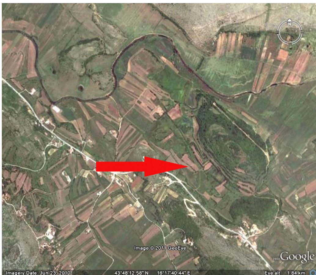
Slika 1. Satelitska snimka Magna.

Figure 1. Satellite image of Magnum.