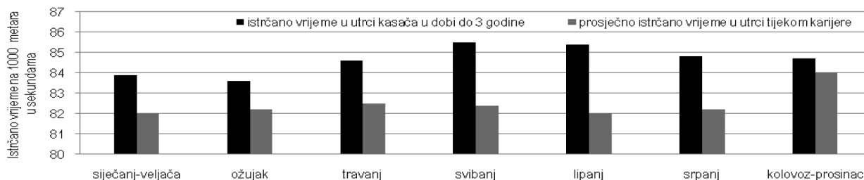
Grafikon 1. Utjecaj mjeseca oždrebljenja kasača na rekordno vrijeme u utrci (Sastamoinen i Ojala, 1991.)

tati utvrđeni su u konja oždrebljenih u rano ljeto. Nije potvrđeno da je superiornost prouzročena većim brojem utrka ili startova, jer konji oždrebljeni ranije u godini nisu imali veći broj startova od vršnjaka oždrebljenih kasnije u godini.