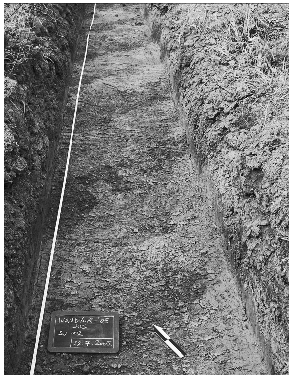
Sl. 2. Dio uzdužnog rova na dijelu lokaliteta između stacionaža 63+800 do 64+250 km

Lokalitet na ovoj parceli može se podijeliti na tri vremenske i površinske cjeline. Uza zapadni kanal parcele do udaljenosti od 100-tinjak metara nalazimo isključivo kasnosrednjovjekovne jame. Dalje prema istočnome dijelu pojavljuju se isključivo antički nalazi odnosno sloj (na osnovom dijelu autoceste i istočnom kraku nadvožnjaka). Starčevo se nalazi na dijelu zapadnoga kraka nadvožnjaka i to na njegovu najuzvišenijem dijelu. Moguće je da se starčevački ostaci pojave i na drugim mjestima parcele, jer se ovdje nailazi na nalaze tipične za starčevačku kulturu.