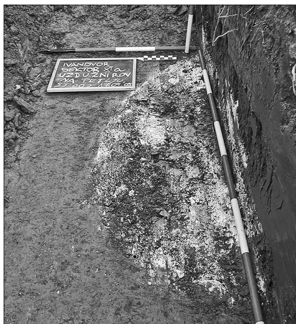
Sl. 3. SJ 227, vapnara (antička?), pruža se ispod južnog profila

Fig. 2. Part of trench on a part of a site between stretches 63+800 – 64+250 km