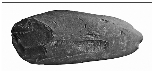
Sl. 3. Kameno oruđe PN 1, pronađeno kod prapovijesnog objekta SJ 024