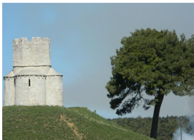
Slika 3.1. Crkva Sv. Nikole u polju Prahulje

Nakon Nina krenuli smo prema Zadru. Prije Zadra zaustavili smo se kod polja Prahulje gdje smo u daljini ugledali ranoromaničku crkvicu Sv. Nikole (slika 3.1.), izgrađenu na ilirskom grobnom tumulusu. Ono što nas se posebno dojmilo je slikoviti pejzaž polja u koji se crkva odlično uklopila. Također su nas iznenadili nagibi pokosa tumulusa za koje osobno ne bih pretpostavila da su pod idealnim inženjerskim nagibom 1:2 da se nismo penjali na sam tumulus. Inače, ovo zdanje je s početka XII. stoljeća, a nadograđivano je obrambeno krunište s 8 zubaca, kao izvidnica u svrhu obrane od Turaka.