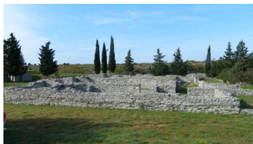
Slika 7.1. Dvojne bazilike u Prižbi

Novi dan počeli smo odlaskom prema Prižbi na poluotoku Srma. Tamo nas je dočekala ranokršćanska dvojna bazilika. Arheološka istraživanja na tom lokalitetu, pod vodstvom Zlatka Gunjače, provedena su od 1969. do 1974. godine, da bi nakon toga uslijedila konzervacija. Otkrivene su dvije jednobrodne bazilike izgrađene u različitim vremenima. Zbog toga ih nazivamo basilicae geminatae ili „crkve blizanke“ – dvojne crkve (slika 7.1.). Ove dvojne bazilike su ujedno i najkompletnije istražene na području Dalmacije. Iako mišljenja o vremenu njihove gradnje nisu potpuno usuglašena, prevladava ono koje obje crkve smješta u 6. stoljeće. Sjeverna crkva je starija, a južna joj je nešto kasnije pridružena. U sklopu južne crkve nalaze se i grobovi, otkriveni istočno od apsida obje bazilike.