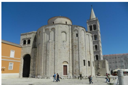
Slika 3.3. Crkva Sv. Donata u Zadru

Na samom rimskom forumu nalazi se i poznati simbol Zadra, crkva Sv. Donata (slika 3.3.). Okrugla predromanička crkva se prvobitno nazivala crkva Sv. Trojstva, no od XV. stoljeća nosi ime sveti Donat, po biskupu koji ju je dao sagraditi početkom IX. stoljeća. U temeljima crkve nalaze se mnogi spoliji, odnosno dijelovi prethodnih antičkih građevina s foruma, a poslužili su kao građevni materijal kod gradnje crkve. Prvobitno je područje ispred crkve bilo ispunjeno zemljom, što dokazuju vrata čiji je prag dosta podignut od tla.