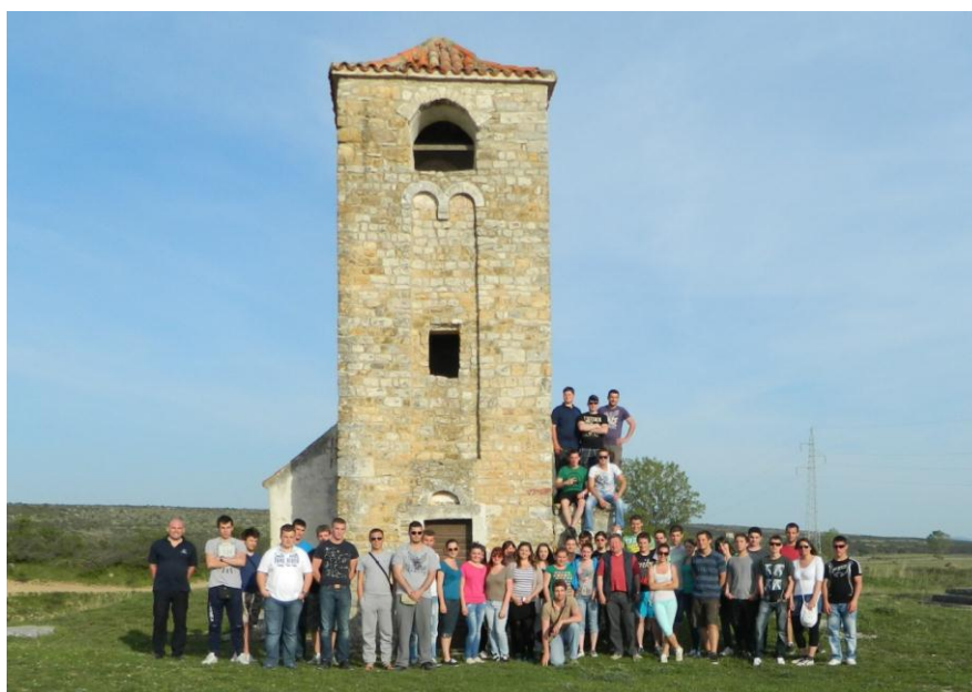
Slika 10.1. Naša družina pred crkvom Sv. Petra

Posjetili smo i romaničku crkvicu Sv. Petra (slika 10.1.) iz IX. stoljeća koja je usamljeni ukras polju pod naseljem Morpolača. Rijetki zapravo znaju za tu crkvicu, jer nikakvi putokazi ne upućuju na nju. Riječ je o jednostavnoj, jednobrodnoj građevini s nekom vrsti izdužene, poluvaljkasto nadsvođene zaobljene apside. Zvonik je kvadratne osnove i jednom stranom priljubljen uz crkvu. Preostale tri strane raščlanjene su visećim slijepim lukovima, a sam vrh s jednostrukim otvorom nastao je kasnije. Prizemlje zvonika ima zidani svod. Crkva je zaštićeni spomenik kulture i obnovljena je 1988. godine. U zvoniku nasuprot ulaznim vratima s desne strane nalazila se kamenica za blagoslovljenu vodu, postavljena na nadgrobni spomenik koji je upotrijebljen za podnožje kamenici. Na spomeniku se primjećivalo samo nekoliko starohrvatskih slova pisanih bosančicom. Uz crkvu je bilo groblje, odnosno danas su to brojni steći. Ovom, kako smo je mi nazvali, smišnom crkvicom, što u ovoj regiji znači simpatičnom, zgodnom, završila je naša pustolovina u Dalmaciji.