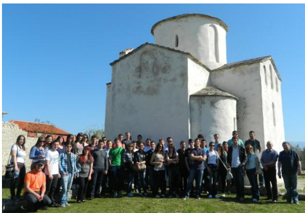
Slika 2.2. Prva zajednička fotografija kod crkve Sv. Križa u Ninu