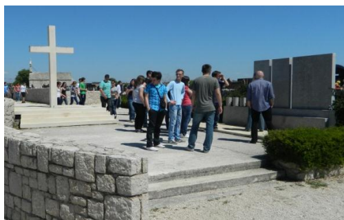
Slika 4.1. Spomenik žrtvama Domovinskog rata

su danak srpske agresije platili životima, preplavio neopisiv osjećaj poštovanja prema ovom mjestu. Na samom groblju nalazi se crkvića Sv. Luke. Oko nje nalazilo se srednjovjekovno selo Kamenjane, koje je u XIII. i XIV. stoljeću posjedovala obitelj Šubić, a kasnije su tamo zemlju kupovali i Zadrani. Crkva Sv. Luke (slika 4.2.) sagrađena je u XIII. stoljeću. Njen šiljasti svod sagrađen je u XIV. stoljeću. Potkraj XVII. stoljeća crkva je pretrpjela oštećenja, nakon kojih je obnovljena, a slično se dogodilo i tijekom Domovinskog rata. Danas je ona potpuno obnovljena. Unutrašnjost crkve je jednobrodna i završava jednom širokom poluoblom apsidom. Presvođena je šiljastim gotičkim svodom, ojačanim dvjema poprečnim pojasnicama. Na sredini apside je mali prozor, a na pročelju, iznad portala, se nalazi jedan uski gotički prozor iznad kojeg je i mali okrugli otvor.