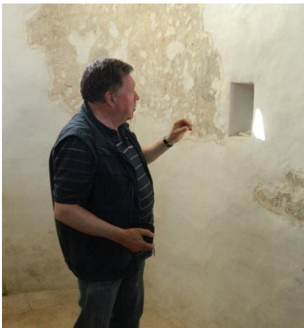
Slika 2.1. Smještaj sunčeve zrake u određeno doba dana u odnosu na otvor daje crkvi ulogu „naprave za očitavanje vremena“

na Jadranu. Danas se na tom mjestu nalaze tek neznatni ostaci koje smo imali priliku vidjeti, te si uz pomoć nedavno rekonstruiranog stupa predočiti samo veličinu hrama. Sve dosad viđeno odalo je Nin kao skromno i pusto mjesto, što je pomalo razočaralo naša očekivanja, no cjelokupni dojam je popravila skladna predromanička crkva Sv. Križa iz IX. stoljeća (slika 2.2.), koja pripada starohrvatskom graditeljstvu. Do prije nekoliko desetaka godina smatralo se da su ju gradili nevješti majstori, a tako se učinilo i nama pa su se na malu crkvicu obrušili komentari kako bi je i svatko od nas mogao izgraditi. Zapravo, tu tezu opovrgao je prof. Mladen Pejaković koji je kroz mnoga istraživanja utvrdio u crkvi niz geometrijskih nepravilnosti koje nisu bile rezultat neukosti već postizanja sklada između građevine, godišnjeg i dnevnog gibanja Sunca te položaja građevine u danom prostoru (slika 2.1.).