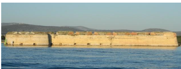
Slika 6.1. Tvrđava Sv. Nikole na otoku Ljuljevcu

Napokon smo stigli u Tribunj gdje nas je dočekaio smještaj, ali tu nije bio kraj našeg prvog dana kao što smo očekivali. Nakon što smo se osvježili slijedila je vožnja brodićem prema tvrđavi Sv. Nikole na otočiću Ljuljevcu (slika 6.1.). Ta vožnja nam je omogućila pogled na Tribunj, Srime pa i na Šibenik. Velebnu renesansnu tvrđavu Sv. Nikole izgradio je 1540. godine veroneški graditelj Giangirolamo Sanmicheli (1513.-1558.), nećak poznatog graditelja Michelea Sanmichelija (1484.-1559.). Impozantna tvrđava izgrađena tik uz kopno, a na ulazu u kanal Sv. Ante pred Šibenikom trebala je služiti kao obrana. Doznali smo da ona u tu svrhu nikad nije poslužila, možda upravo radi svog zastrašujućeg izdanja. Nakon razgledavanja unutrašnjosti tvrđave u kojoj su se od morske soli formirali stalagmiti, vratili smo se u Tribunj. Za kraj našeg prvog dana odlučili smo se provesti, dok su se neki povukli u sobe kako bi napuniti tijelo energijom za podvige u sljedećem danu.