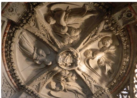
Slika 8.2. Krstionica katedrale Sv. Jakova