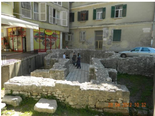
Slika 3.2. Crkva Stomorice

Na samom rimskom forumu nalazi se i poznati simbol Zadra, crkva Sv. Donata (slika 3.3.). Okrugla predromanička crkva se prvobitno nazivala crkva Sv. Trojstva, no od XV. stoljeća nosi ime sveti Donat, po biskupu koji ju je dao sagraditi početkom IX. stoljeća. U temeljima crkve nalaze se mnogi spoliji, odnosno dijelovi prethodnih antičkih građevina s foruma, a poslužili su kao građevni materijal kod gradnje crkve. Prvobitno je područje ispred crkve bilo ispunjeno zemljom, što dokazuju vrata čiji je prag dosta podignut od tla.