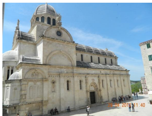
Slika 8.1. Katedrala Sv. Jakova u Šibeniku

Nakon Prižbe upustili smo se u razgledavanje Šibenika. Šibenik je najmlađi grad na našoj jadranskoj obali, a spominje se od XI. stoljeća. U tom gradu osobno su me se dojmile duge uske ulice okružene visokim zgradama, što doista odaje ugođaj dalmatinskog grada. Najznačajnija građevina u Šibeniku je katedrala sv. Jakova (slika 8.1.) građena tijekom XV. i XVI. stoljeća.