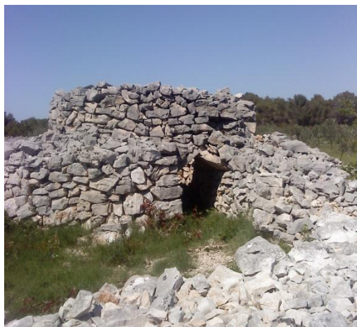
Slika 5.1. Bunja izvana

Već pomalo umorni priželjkivali smo odmor. Ušli smo u područje bunja koje nas je nekako razbudilo i posebno oduševilo. Zaustavili smo se kod nekoliko bunja u blizini Vodica koje smo doživjeli kao hrpu kamenja dok smo im prilazili. Kada se svatko od nas s dozom nesigurnosti uvukao u bunju, iznenadila nas je prostranost tih zdanja iznutra. Bunje su tip tolosoidnih građevina, a bez obzira na njihove male dimenzije sadrže sve elemente kao i velebna Atrejeva grobnica (tzv. riznica) u Grčkoj, tolosoidna građevina s pristupnim putom dromosom, ulaznim hodnikom stomionom te grobnom dvoranom u formi košnice (grč. tholos).