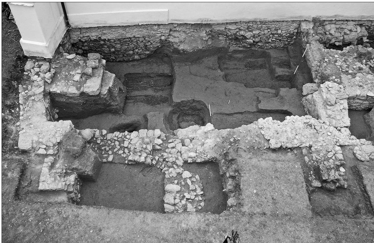
Sl. 2. Pogled na tlocrt novootkrivene gotičke arhitekture