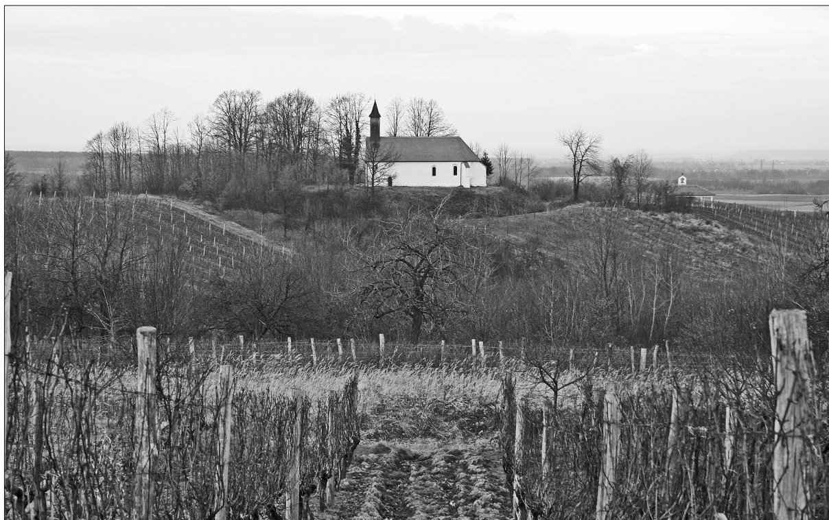
Sl. 1. Položaj crkve Svetog Lovre na gradištu, pogled od juga (foto: T. Tkalčec, prosinac 2005.)

Key words: Crkvari, Church of St Lovro, cemetery, archaeological excavations, Gothic phase, sacristy, chapel