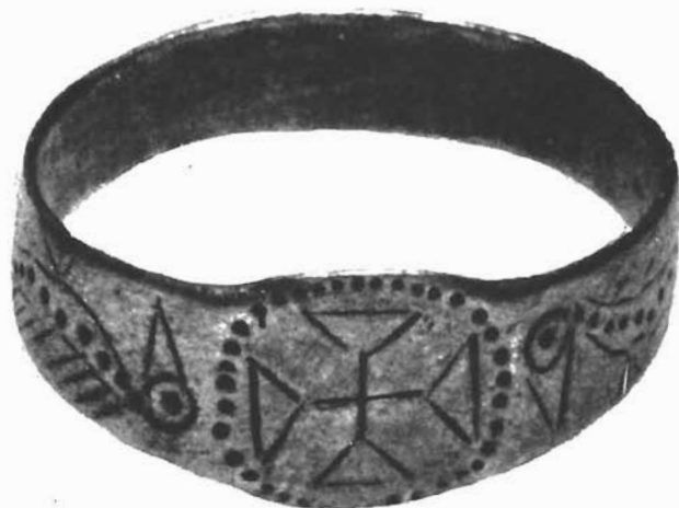
Sl. 2. Škrip. Srebrni prsten iz groba br. 2. – Škrip. Silberring aus Grab Nr. 2