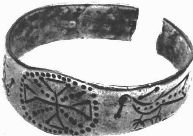
Sl. 1. Vrlika. Srebrni prsten. – Vrlika. Silberring

proizvode od plemenitog metala 5–6 st. a i uporaba tzv. grčkog križa zastupljena je relativno na većem broju kasnoantičkog nakita od oblika tzv. latinskog križa. 37 Križ kao simbol Krista javlja se u prvo vrijeme okružen s dvanaest apostola, kasnije se broj apostola smanjuje na dvije ljudske figure koje odaju počast križu. Postupno se ljudske figure zamjenjuju sa simboličkim životinjskim likovima kao što su ovce, golubice, paunovi, dupini itd. 38 S jedne i druge strane škripskog križa nalazi se po jedna ptica – golubica gotovo jednako izrađene (jedino nisu završene noge i mala je greška na repu), okrenute su prema križu. Razlog da je jedna prikazana u stojećem položaju a druga u ležećem vjerojatno je u tome što je to prikaz na prstenu, tako kada se promatra prsten s gornje ili donje strane uvijek jedna golubica stoji.