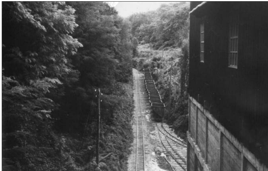
Rudarska željeznica odvozila je ugljen od rudnika Velika Črešnjevica do separacije u Pitomači

Sektor operative Koprivničkih ugljenokopa - Bregi poslao je 31. ožujka 1952. Sekretarijatu Glavne direkcije ugljena za NRH u Zagrebu pregled (shemu) osoblja poduzeća. Pod točkom 3. («Željeznički saobraćaj Bregi») navode se: poslovođa 1, radnici pretovara: muški 25, žene 6, strojovođe 5 i ložači 3. Sveukupno je u željezničkom prometu Koprivničkih ugljenokopa - Bregi bio 1 službenik i 39 radnika. 43