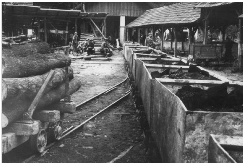
Željeznička infrastruktura rudnika u Glogovcu Koprivničkih ugljenokopa u Bregima

Transport od Javorovca do željezničke stanice Novigrad bio je dug 8 km, a obavljao se cestovnim kamionima.