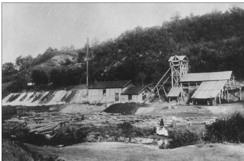
Pogled na rudokop Žlebci južno od Koprivnice (kod Reke)

Prilikom primopredaje Rudnika Glogovac od 30. rujna 1945., konstatirano je da se otprema ugljena u jami vršila jamskim kolicima s vozačima, a iz pripremnog radilišta iz dubine izvlačilo se pomoću ručnog vitla. Ručna otprema išla je sve do separacije. Od razredišta do utovarne stanice u Bregima otpremalo se u samoistovaračima po industrijskoj pruzi lokomotivom Rudnika Bregi. 21