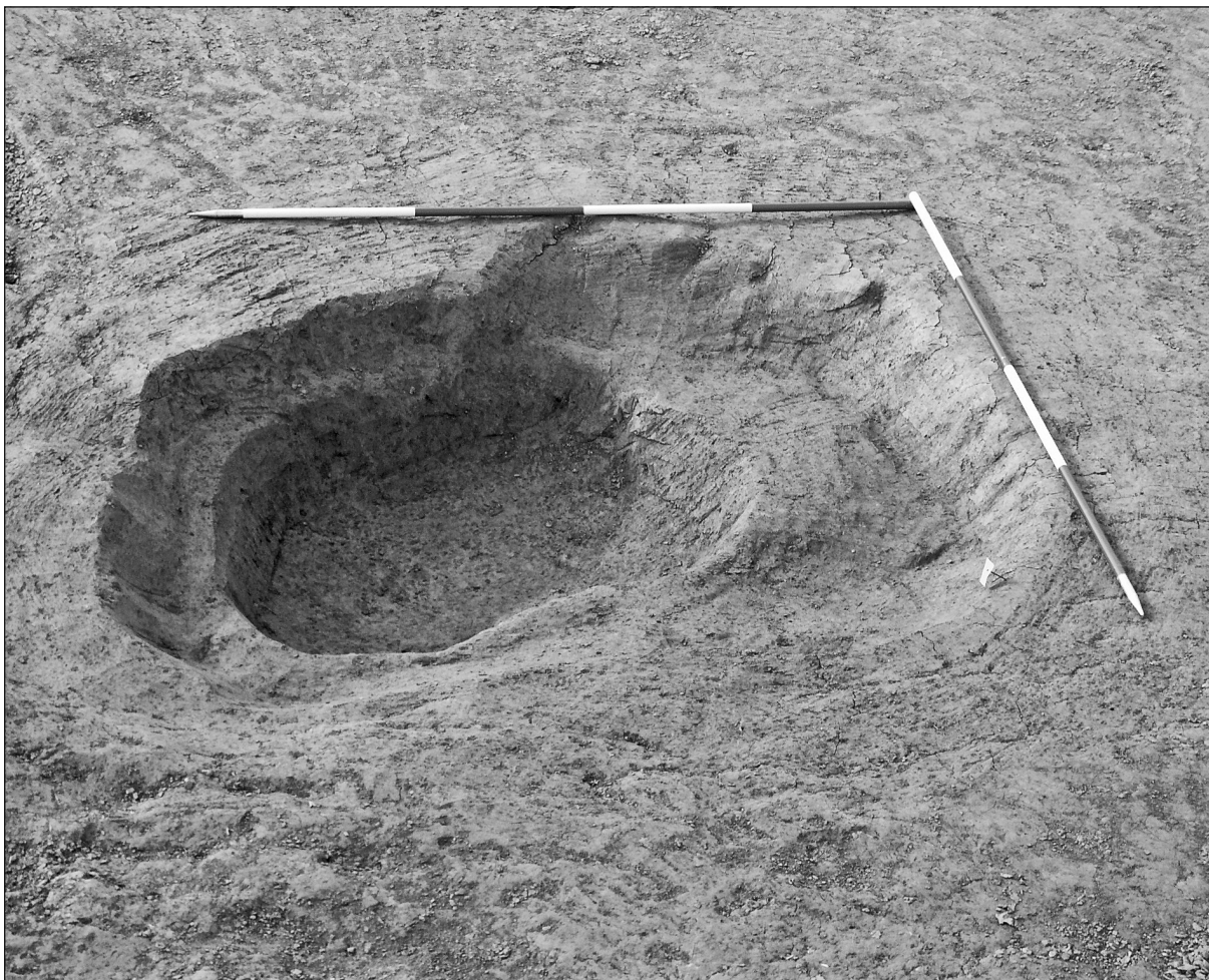
Sl. 2. Ukop SJ 015 u □E9