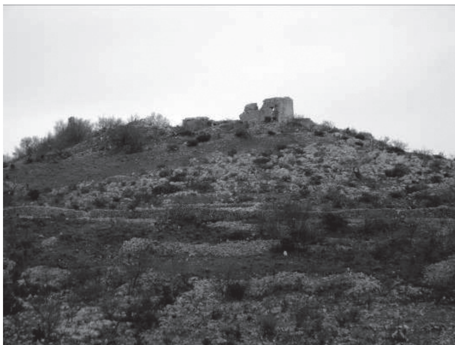
Slika 1. Ostaci utvrde Dračevac u Jasenicama. Pogled s gradine Razvršje zapadno od Dračevca.