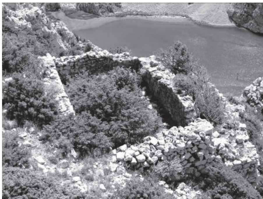
Slika 3. Ostaci prostorija na gradini Šibenik u kanjonu rijeke Zrmanje u Jasenicama.