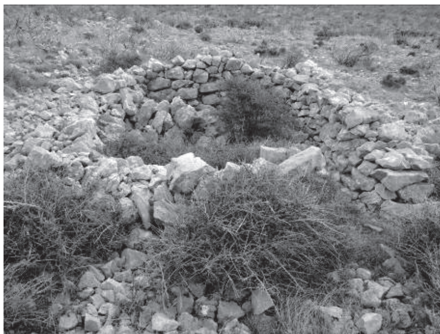
Slika 4. Ostaci starih nastambi u napuštenome zaselku na lokalitetu Ivandića Glavica.