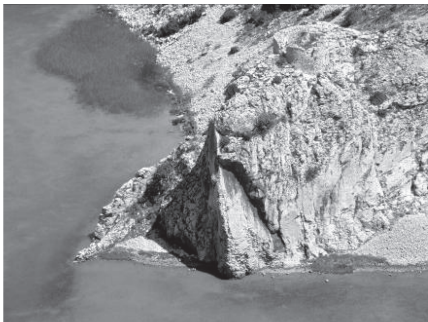
Slika 2. Ostaci utvrde Pržunac na lijevoj obali rijeke Zrmanje u Kruševu.