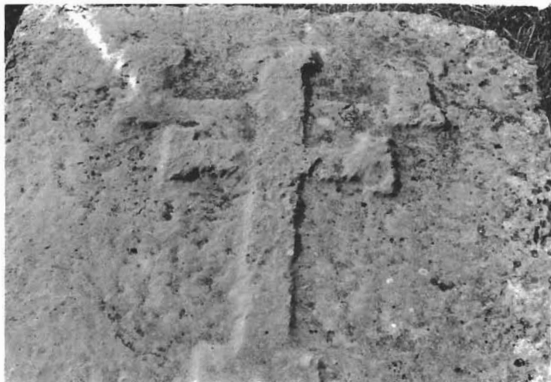
Sl. 3. Stilizirani križ na postolju s dva horizontalna kraka. — Stylised cross on base with two horizontal hands