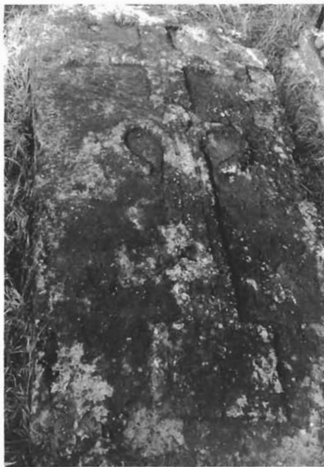
Sl. 4. Križ s ljiljanom. Stećak na grobu fra Luje Maruna. — Cross with lilies. Standing tomb-stone on grave of fra Lujo Marun