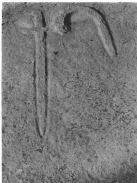
Sl. 1. Mač i štap. — Sword and stick

Lj. Radić, Ukrasni i simbolični motivi na stećcima . . . , str. 233—240. SHP, 18/1988.