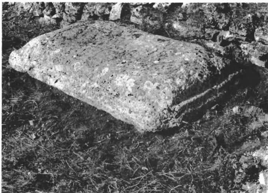
Sl. 2. Stećak ukrašen profilacijom. — Standing tomb-stone with profile decoration