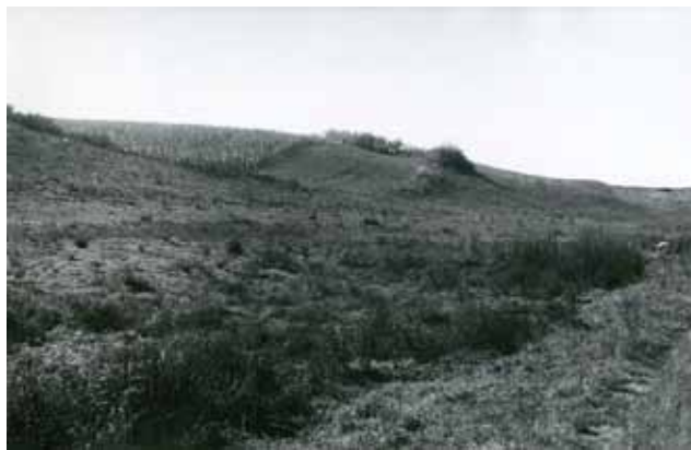
Sl. 3 Tompojevci, lokalitet Malat, kompleks rimskog naselja