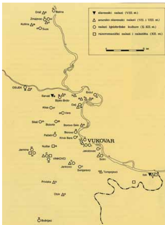
Sl. 1 Karta rasprostranjenosti ranosrednjovjekovnih pojedinačnih nalaza i nalazišta u istočnom dijelu Slavonije i Baranje od VII. do XII. st. (prema dr. sc. Ž. Tomičiću)

Selo Tompojevci smješteno je 18 km jugoistočno od Vukovara u pozadini dunavskog limesa, u području koje kao rijetko koje u sjeveroistočnoj Hrvatskoj pokazuje kontinuitet naseljavanja. Razlozi tome nalaze se u optimalnim prirodnim datostima - prostranim nizinskim agrarnim površinama i razgranatim riječnim tokovima. Ovo je područje višestoljetni koridor stalnih migracija raznih etničkih skupina, osvajačkih pohoda.