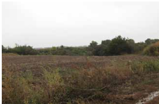
Sl. 4 Tompojevci, lokalitet Pivnice, pogled SI – JZ, pretpovijesno (starčevačka kultura), antičko i srednjovjekovno naselje