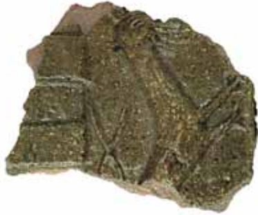
Sl. 11 i 12 Ulomci pečnjaka s ugarskim grbom kralja Žigmunda (1387.-1437.), Ružica-grad