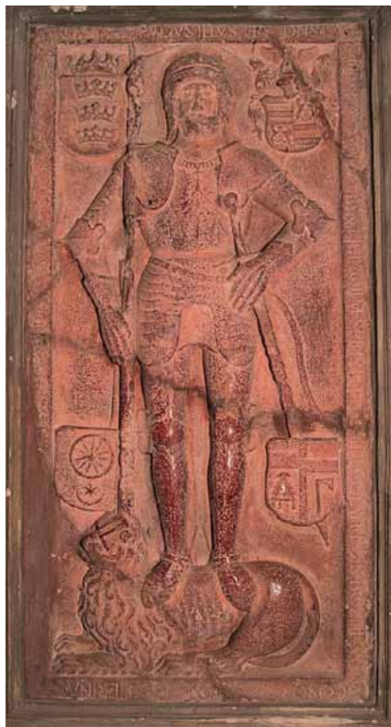
Sl. 1 i 2 Nadgrobnice ploče Nikole i Lovre Iločkog u crkvi sv. Ivana Kapistrana u Iloku