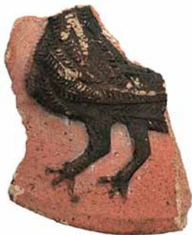
Sl. 18 Ulomak pećnjaka s prikazom ptice tamnog perja, Ružica-grad, druga pol. 15. st.

Sličan je i ulomak od necakljene terakote s prikazom crne ptice, koji vjerojatno prikazuje obiteljski simbol kralja Matije Korvina, gavrana 7 (RADIĆ, BOJČIĆ 2004.: 282, kat. br. 595).