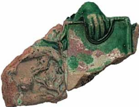
Sl. 22 Ulomak pećnjaka s prikazom grba Koroške, kojeg pridržava anđeo, (Gorički grofovi), Ružica-grad, druga pol. 15. st.