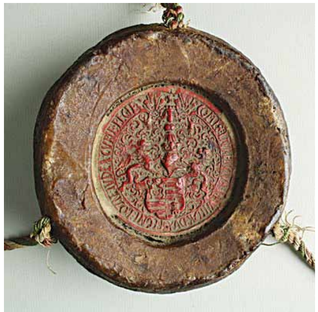
Sl. 35 a i b Pečati s povelja izdanih 1519. g. od strane Lovre Iločkog kao državnog suca (arhivske oznake u fusnoti 25)