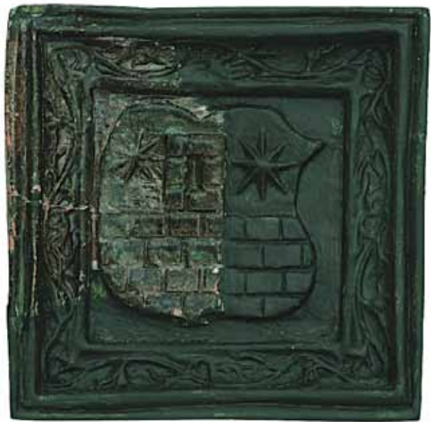
Sl. 9 Rekonstruirani pečnjak s grbom pečuškog biskupa Sigismunda Ernusza, Ružica-grad, zadnja četv. 15. st. i poč. 16. st.

br. 597). Na štitu renesansne forme prikazana je utvrđena kula sa čije se lijeve i desne strane nalazi po jedna zvijezda.