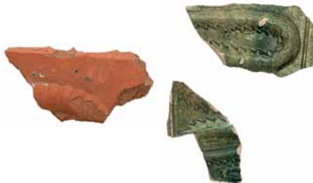
Sl. 19 i 20 Ulomci grba Gorjanskih, Ružica-grad, druga pol. 15. st.