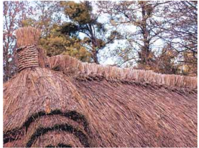
Sl. 26 Detalj slamnatog krova sa završnim čvorom u Etnografskom parku u Szombathelyu

Ovakav način izrade krovova od slame, koji na sljemeni imaju čvorove, karakterističan je za seosku arhitekturu od srednjeg vijeka pa sve do 20. st.