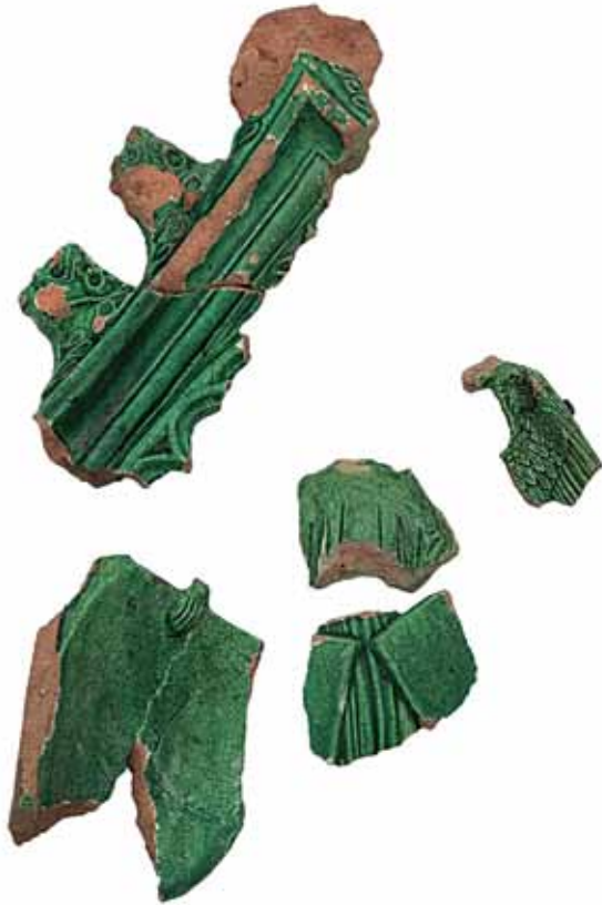
Sl. 7 Ulomci zabatnog pečnjaka s motivom anđela koji drži grbove, Ružica-grad, druga pol. 15. st.

Drugu skupinu grbova predstavljaju državni, odnosno kraljevski grbovi kao što su ugarski, austrijski, češki ili portugalski (RADIĆ, BOJČIĆ 2004.: 237, kat. br. 493, 494; 238, kat. br. 495, 496; 239, kat. br. 497; 240, kat. br. 499; 280, kat. br. 590, 591; 295, kat. br. 621).