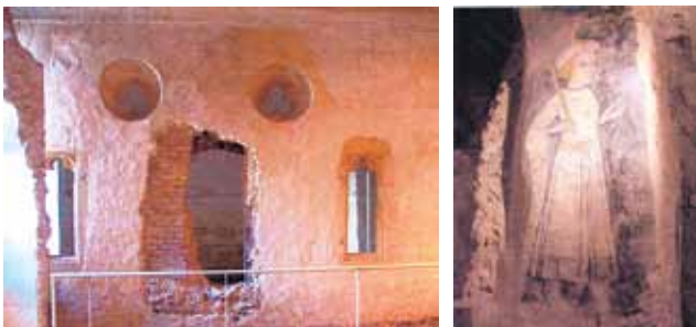
Sl. 42 a i b Nedavno pronađeni i restaurirani gotički prozori i oslici kapele u utvrđenom dvorcu Iločkih u Várpaloti

Preci Nikole i Lovre Iločkog pokapali su se u pavlinskom samostanu koji je osnovao Nikola Kont u obližnjem selu Csatki.