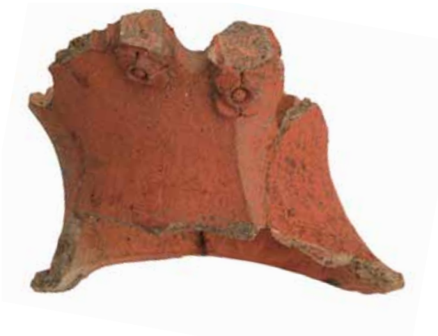
Sl. 24 Ulomak donjeg dijela kacige koja je tvorila grb na pečnjaku, Ružica-grad, druga pol. 15. st. i prva četv. 16. st.

Rekonstrukcijom ovog grba utvrđeno je da je na njemu motiv sjenice na četiri stupa, čiji je krov od četiri reda slame na vrhu zavezan u čvor. Motiv je izrađen vrlo precizno u plitkom reljefu (RADIĆ, BOJČIĆ 2004.: 279, kat. br. 589).