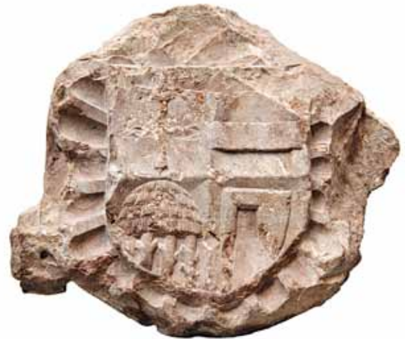
Sl. 29 Ulomak s grbom Iločkih iz fundusa Muzeja grada Iloka, zadnja četv. 15. st. i prva četv. 16. st.

Stoga niti kameni ulomak s vrlo fino klesanim grbom na sličnom crvenom kamenu (bez inventarnog broja), koji se nalazi u fundusu iločkog muzeja (sl. 29), nije dio Nikoline nadgrobne ploče.