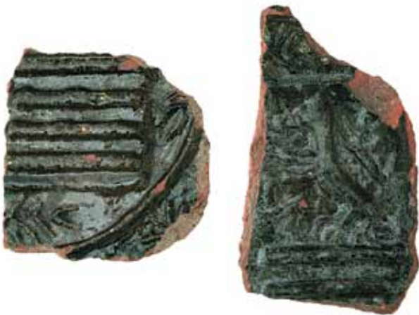
Sl. 13 i 14 Ulomci pečnjaka s ugarskim grbom kralja Žigmunda (1387.-1437.), Ružica-grad