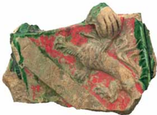
Sl. 17 Ulomak grba Kyburga, Ružica-grad, druga pol. 15. st.

Isto vrijedi i za ulomak grba Kyburga 5 , posjeda u blizini Habsburga (danas u Švicarskoj), što ga je Rudolf Habsburški (1218.-1291.) ženidbenim vezama naslijedio. Tada započinje zapravo i uspon Habsburgovaca kao dinastije i očigledno je da je ovaj grb važan za obitelj. Vjerojatno se na Ružici-gradu našao uz grb Portugala, a kako su oba ulomka obojana „a secco“ crvenom bojom i slični su u izradi, sigurno je da su bili na istoj peći. 6