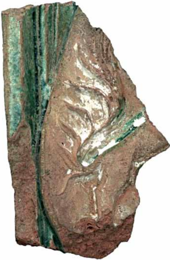
Sl. 21 Ulomak pećnjaka s prikazom grba Goričkih grofova, Ružica-grad, druga pol. 15. st.