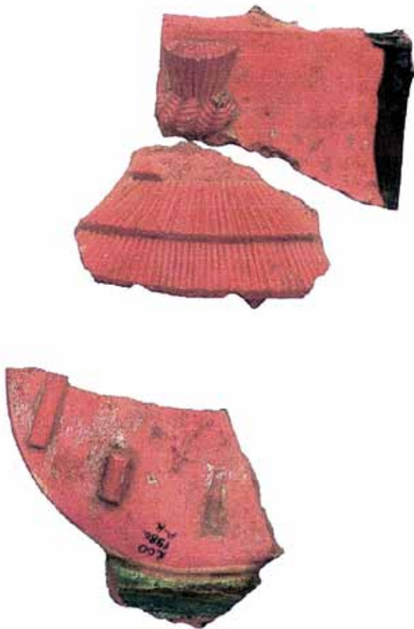
Sl. 25 Ulomci pečnjaka s grbom na kojem se nalazi motiv slamnate sjenice, Ružica-grad, druga pol. 15. st. i prva četv. 16. st.

Rekonstrukcijom ovog grba utvrđeno je da je na njemu motiv sjenice na četiri stupa, čiji je krov od četiri reda slame na vrhu zavezan u čvor. Motiv je izrađen vrlo precizno u plitkom reljefu (RADIĆ, BOJČIĆ 2004.: 279, kat. br. 589).