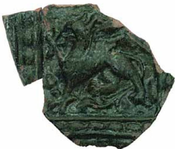
Sl. 3 Pećnjak s motivom grifona naknadno uobličen u formu štita, Ružica-grad, druga pol. 15. st.

U ovu skupinu grbova pripadaju pećnjaci s motivima grifona, sv. Jurja ili krilatog anđela, kao i pećnjaci na kojima anđeli pridržavaju tzv. slijepe grbove (RADIĆ, BOJČIĆ 2004.: 248, kat. br. 524; 281, kat. br. 593; 281, kat. br. 594; 260, kat. br. 544; 261, kat. br. 545).