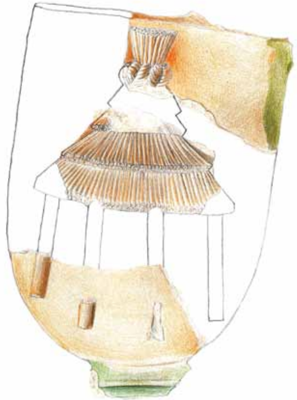
Sl. 33 Crtež - rekonstrukcija pećnjaka pronađenog na Ružici-gradu s motivom sjenice; crtež izradila Sandra Vehabović

slamnatim krovom i uvezanim čvorom na vrhu, koja stoji na četiri stupa, a nalazi se prikazana i na grbu, odnosno pećnjaku, koji je činio krunište kaljeve peći na Ružici-gradu (sl. 25).