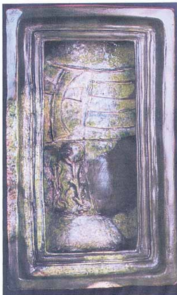
Sl. 34 Pećnjak iz Iloka u obliku niše s prikazom obiteljskog grba Iločkih

Grbovi Iločkih i njihove varijacije u stručnoj literaturi 22 reproducirani su, odnosno iscrtavani na temelju sačuvanih pečata s povelja i prikaza na kamenim spomenicima. 23 Prema tome, očigledno je da nisu sačuvani prikazi ovih grbova u boji (grbovnici, povelje, zidni oslici i sl.).