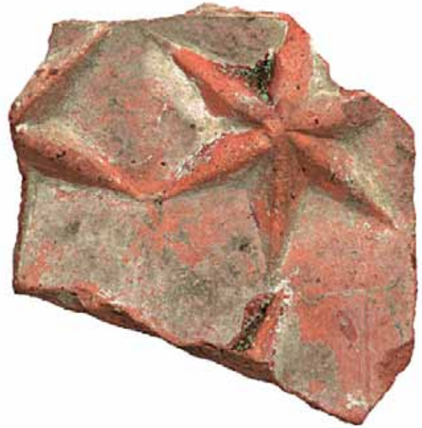
Sl. 23 Ulomak pećnjaka s prikazom grba grofova Celjskih, Ružica-grad, prva pol. 15. st.

Za ulomke dvaju grbova s Ružice-града porijeklo je za sada nejasno (RADIĆ, BOJČIĆ 2004.: 279, kat. br. 589; 282, kat. br. 598).