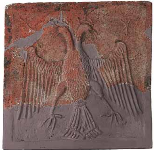
Sl. 44 Rekonstruirani necakljeni pečnjak s prikazom okrunjenog dvoglavog orla, Ružica-grad, prva pol. 15. st.

Kao konačan zaključak treba reći da još predstoje arheološka istraživanja Ružice-grad, koji nije u cijelosti istražen, kao i drugih utvrda i gradova u vlasništvu Iločkih. Isto vrijedi i za arhivske izvore, što bi u konačnici moglo do kraja rasvijetliti porijeklo grba sa sjenicom kao dijela heraldičkog nasljeđa obitelji knezova Iločkih 15. i 16. st.