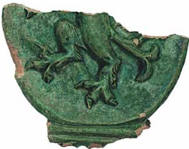
Sl. 8 Ulomak pečnjaka s prikazom češkog grba, Ružica-grad, druga pol. 15. st.

Drugu skupinu grbova predstavljaju državni, odnosno kraljevski grbovi kao što su ugarski, austrijski, češki ili portugalski (RADIĆ, BOJČIĆ 2004.: 237, kat. br. 493, 494; 238, kat. br. 495, 496; 239, kat. br. 497; 240, kat. br. 499; 280, kat. br. 590, 591; 295, kat. br. 621).