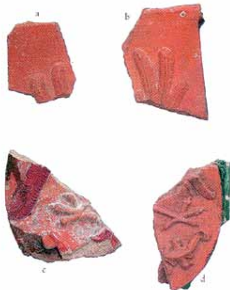
Sl. 27 Ulomci pečnjaka s grbom na kojem je prikazan orao raširenih krila (grb Tirola?), Ružica-grad, druga pol. 15. st.

Slični su kvalitetom izrade (vrlo precizni reljefi) i veličinom ostaci grbova Gorjanskih (RADIĆ, BOJČIĆ 2004.: 279, kat. br. 586; nestali ulomci bojani „a secco“; vidi sl. 19) i grba s prikazom orla, koji je sačuvan u nekoliko fragmenata i također je nakošen u odnosu na vertikalnu os (RADIĆ, BOJČIĆ 2004.: 280, kat. br. 590). Kako nije sačuvan korpus, odnosno glava ptice, nije baš najjasnije o kakvom se grbu radi, ali kako su na ulomku 590c perje i rep obojeni crveno, a podloga bijelo, moguće je da se radi o grbu Tirola, pa bi to ponovno bila veza s Goričkim i Tirolskim grofom Leonhardom, suprugom Lovrine sestre Hyeronime.