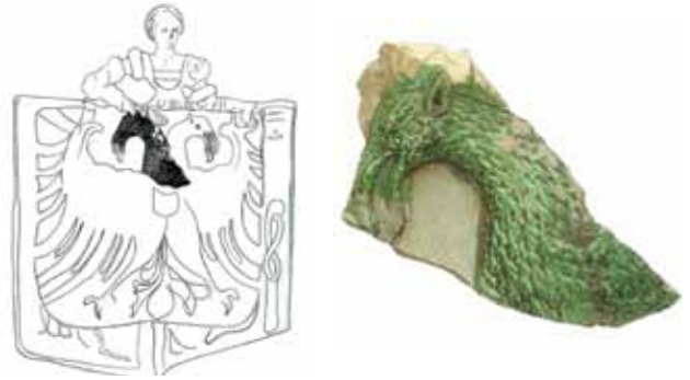
Sl. 15 Ulomak pečnjaka i crtež s motivom austrijskog grba (iz sakristije katedrale Stephansdoma u Beču), Ružica-grad, oko 1500. g.; snimio Marin Topić

Mali grb Portugala samo je na prvi pogled „uljez“ - na crvenom grbu je manji srebrni grb u kojem se nalazi pet plavih grbova poredanih u obliku križa, svaki s pet srebrnih točaka, odnosno kugli, a oko manjeg srebrnog grba poredane zlatne kule razdvojene su stiliziranim ljiljanom u četvorine. 4 No, znajući za sukob Nikole Iločkog s kraljem Matijom Korvinom (1458.-1490.) i Nikolinu sklonost i veze s austrijskim carem Friedrichom III. Habsburškim, rimsko-njemačkim carem 1452.-1493., čija je žena bila portugalska princeza Eleonora († 1467. g.), ovaj grb zapravo je dobra potvrda da se ne radi o slučajnom izboru motiva na pečnjacima, odnosno reprezentativnim pečima u posebnim dvorskim sobama kao što su svečane dvorane, blagovaonice, kapele, dvorišta i sl. (RADIĆ, BOJČIĆ 2004.: 262, kat. br. 547 a).