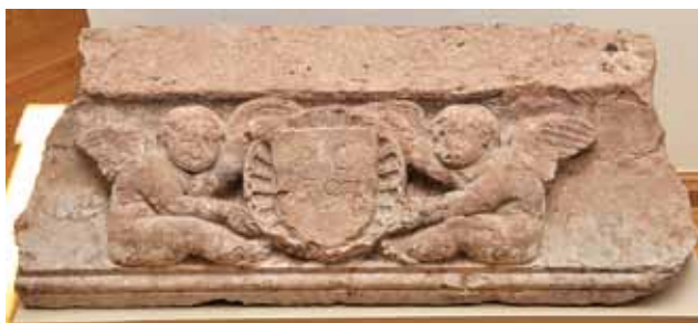
Sl. 30 Kameni ulomak s dva putta i preklesanim grbom na školjci s naknadno upisanom godinom (AC 1797.), Muzej grada Iloka

U Muzeju grada Iloka nalazi se još jedan ulomak s jednim puttom , ali je po liniji loma evidentno da ulomak s grbom Iločkih nije s njim činio cjelinu. 19 Ostaci željeznih klanfi na oba ulomka govore da se radilo u frizu (vijencu s grbom), odnosno grbovima Iločkih knezova 20 od kojih je jedan bio i ulomak s raščetvorenim grbom i sjenicom u trećem polju. U obzir dolaze i grbovi obitelji s kojima su Iločki bili u rodbinskim vezama, kao i državni, odnosno kraljevski grbovi.