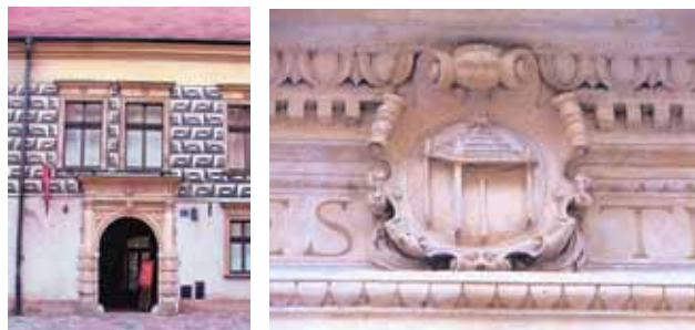
Sl. 43 a i b Portal palače u Krakowu s prikazom sjenice u ul. Kanonicza br. 21

Na njegovom je grbu također sjenica sa zlatnim krovom i srebrnim stupovima na crvenom. Iznad je okrunjena turnirska kaciga s crvenim i zlatnim plaštem. Iz krune izlazi paunovo perje na kojem je opet motiv sjenice.