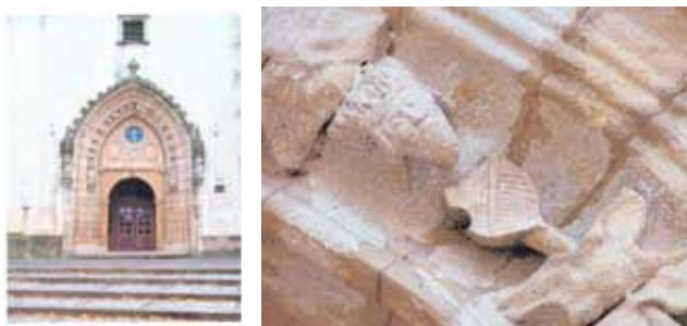
Sl. 41 a i b Portal crkve sv. Michala u Hlohovcu i detalj s prikazom grba i okrunjene glave

Kako god bilo, ovaj grb ne pripada obitelji Iločkih, niti predstavlja bilo koji kraljevski grb vladarskih kuća Ugarsko-Hrvatskog Kraljevstva pa je moguće da se radi o nekoj vrsti improvizacije prilikom kasnije obnove.