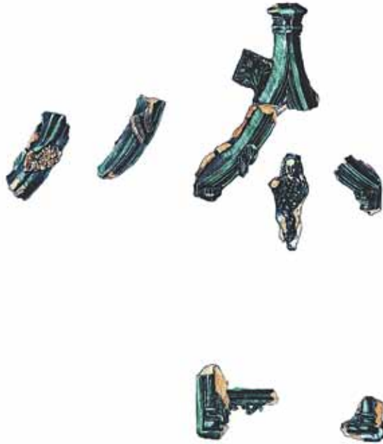
Sl. 39 Crtež ulomaka velikog, zeleno cakljenog zabatnog pećnjaka s ostacima terakotnih krila i djevicom u pretpostavljenoj poziciji kao dio grba Iločkih knezova, Ružica-grad, zadnja četv. 15. st.; crtež izradila Sandra Vehabović

U heraldici većine srednjoeuropskih zemalja (Mađarska, Austrija, Njemačka, Hrvatska, Češka, Slovačka) motiv slamnate sjenice na stupovima iznimno je rijedak. Ovaj motiv uglavnom se veže za staro poljsko plemstvo (obitelj), koje je nosilo pridjev „od Leszczyc“ (od Leščića) i spominje se već u 14. st.