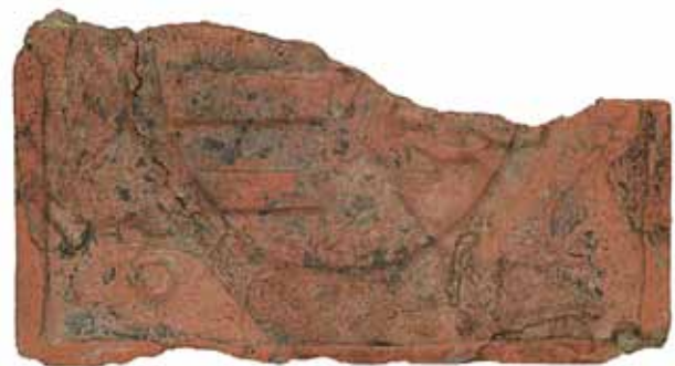
Sl. 10 Ulomak necakljenog pečnjaka s ugarskim grbom kralja Žigmunda (1387.-1437.), Ružica-grad