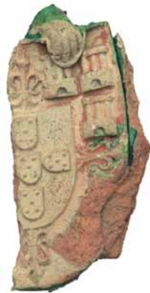
Sl. 16 Ulomak pečnjaka s prikazom portugalskog kraljevskog grba kojeg drži anđeo, Ružica-grad, druga pol. 15. st.; snimio Marin Topić

Mali grb Portugala samo je na prvi pogled „uljez“ - na crvenom grbu je manji srebrni grb u kojem se nalazi pet plavih grbova poredanih u obliku križa, svaki s pet srebrnih točaka, odnosno kugli, a oko manjeg srebrnog grba poredane zlatne kule razdvojene su stiliziranim ljiljanom u četvorine. 4 No, znajući za sukob Nikole Iločkog s kraljem Matijom Korvinom (1458.-1490.) i Nikolinu sklonost i veze s austrijskim carem Friedrichom III. Habsburškim, rimsko-njemačkim carem 1452.-1493., čija je žena bila portugalska princeza Eleonora († 1467. g.), ovaj grb zapravo je dobra potvrda da se ne radi o slučajnom izboru motiva na pečnjacima, odnosno reprezentativnim pečima u posebnim dvorskim sobama kao što su svečane dvorane, blagovaonice, kapele, dvorišta i sl. (RADIĆ, BOJČIĆ 2004.: 262, kat. br. 547 a).