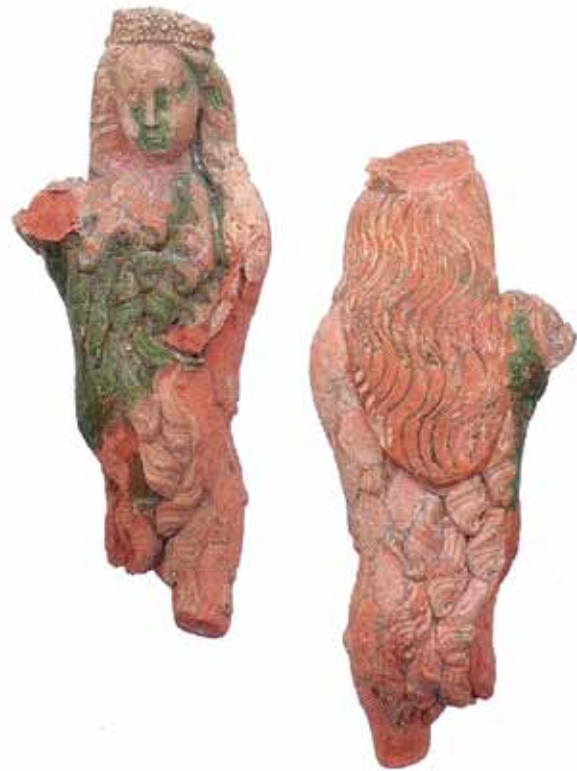
Sl. 38 Terakotna figurica „djevice“ s Ružice-grada, vjerojatno dio grba Iločkih s kaljeve peći

Ikonografski podsjeća na sv. Agnezu, odnosno Mariju Magdalenu (RADIĆ, BOJČIĆ 2004.: 273, kat. br. 570).