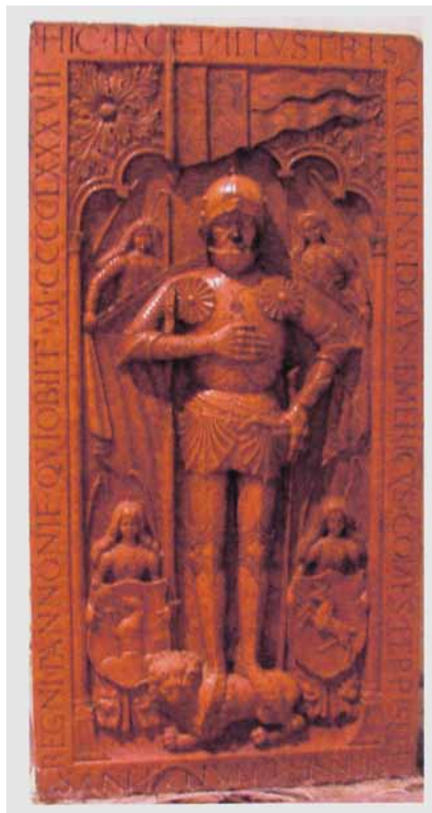
Sl. 31 Nadgrobna ploča Emerika Zapolje iz 1487. g. u katedrali sv. Martina u Spišskom Kapitolu

Nadgrobna ploča Lovre Iločkog sačuvana je gotovo u cijelosti (nedostaje dio natpisa u lijevom uglu) i na njoj su u cijelosti sačuvana četiri grba.