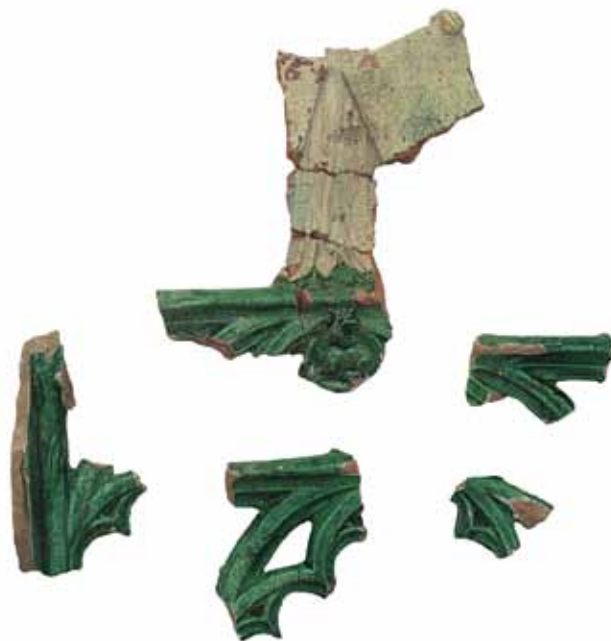
Sl. 6 Ulomci zabatnog pećnjaka s motivom anđela koji drži grbove, Ružica-grad, druga pol. 15. st.