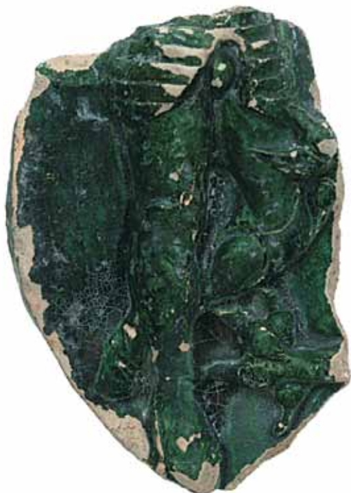
Sl. 4 Donji dio grba s prikazom sv. Jurja, Ružica-grad, druga pol. 15. st.