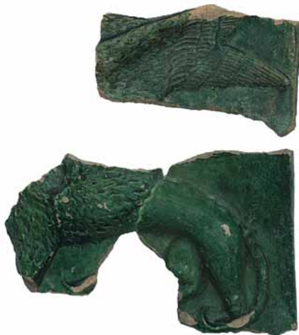
Sl. 5 Ulomci pećnjaka s prikazom grifona ili krilatog lava, Ružica-grad, druga pol. 15. st.; snimio Marin Topić