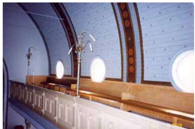
Sl. 6 Interijer sinagoge, pogled na ženske galerije