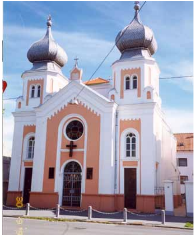
Sl. 4 Zapadno pročelje sinagoge