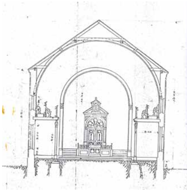
Sl. 3 Projekt sinagoge, glavno ulično pročelje [W. C. Hofbauer, 1902.]

Nakon prodaje objekta pentekostnoj crkvi 1978. g. unutrašnjost je, uz očuvanje izvornih odlika građevine, konzervatorski korektno adaptirana 1980. g. Danas se nalazi u sklopu zgrada Evandeoskoga teološkog fakulteta. Obilježena je spomen-pločom.