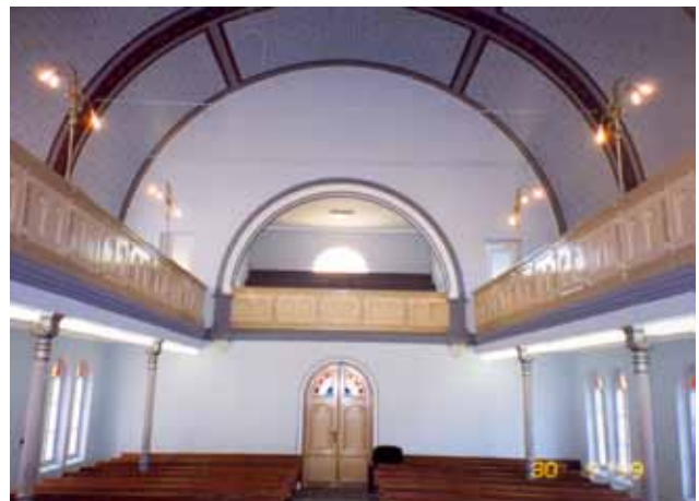
Sl. 5 Interijer sinagoge, pogled prema koru