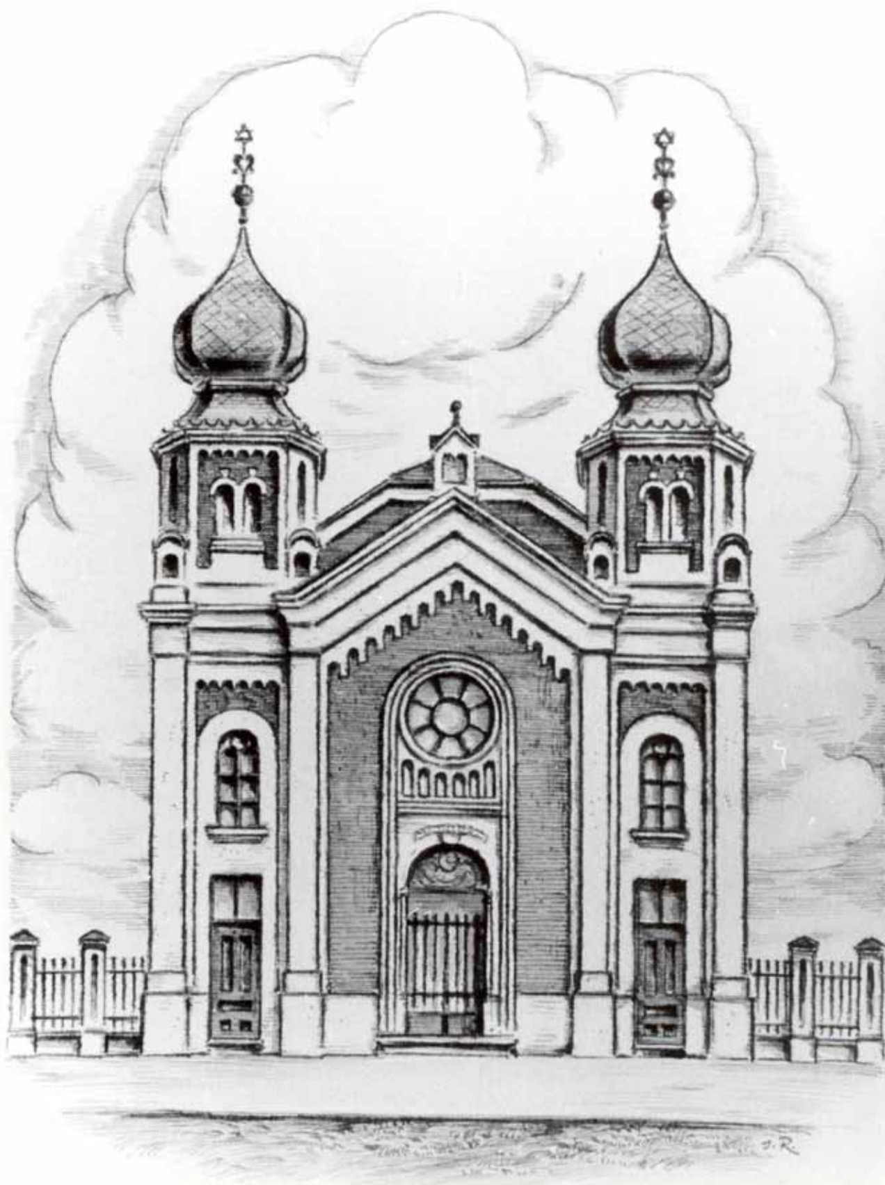
Sl. 7 Crtež glavnog pročelja sinagoge [I. Roch, 1936.]