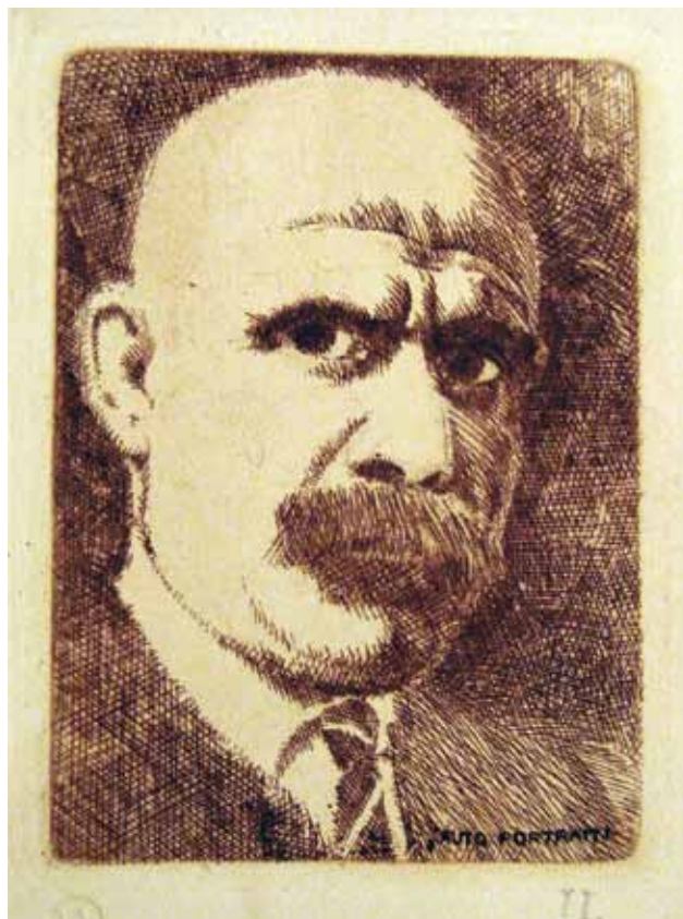
Sl. 1 Josip Leović, Autoportret, zbirka Josipa Kovačića, Zagreb

U Galeriji likovnih umjetnosti u Osijeku 2008. g. postavljena je izložba pod nazivom Osječki kipari – Leović, Živić, Nemon, Švagel-Lešić: djela iz fundusa Galerije likovnih umjetnosti u Osijeku . Izložbom su se nastojala promovirati djela osječkih kipara moderne kao posebna cjelina u korpusu osječke likovne povijesti, koja je do sada bila izvan središta naše pozornosti. Izložena djela prvi put su se našla zajedno na jednom mjestu, u jednom izložbenom i sadržajnom kontekstu, predstavljajući presjek osječkoga kiparstva prve polovice 20. st. Izložba je bila zamišljena kao korak prema budućoj monografskoj obradi svakog pojedinih autora, ali i jednoj mogućoj sintezi kiparstva u Osijeku, koja će izrasti na temelju predstojećeg znanstvenog istraživanja. Biografski podaci o Leoviću izneseni u katalogu izložbe uglavnom su preuzeti iz ranije publiciranih tekstova Danice Pinterović, Branke Balen i Ota Švajcera (ZEC 2008.).