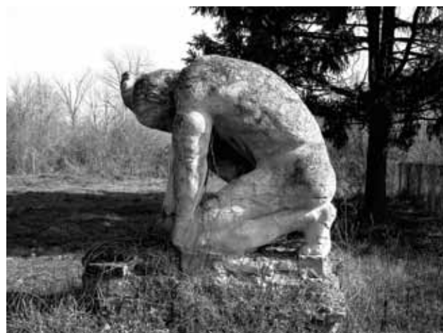
Sl. 5 Muški akt, 1925.-1927., pustara Ankin dvor