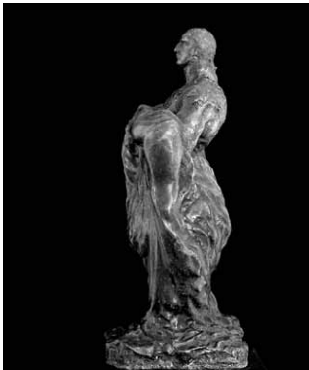
Sl. 7 Ursus i Ligija ( Quo vadis ), oko 1927.-1932., Galerija likovnih umjetnosti, Osijek