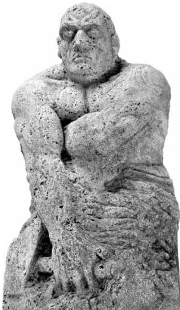
Sl. 6 Radnik, 1927., Galerija likovnih umjetnosti, Osijek

Katalog Leovićevih djela podijeljen je na sačuvane, odnosno postojeće skulpture te na skulpture koje nisu sačuvane ili nisu još pronađene, a navode se u izložbenim katalozima, časopisima, novinama ili u Švajcerovim bilješkama. Za neke skulpture još nisu prikupljeni podaci o njihovim dimenzijama, dok je datacija određenih skulptura za sada postavljena okvirno te je podložna promjeni.