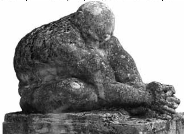
Sl. 4 Muški akt, 1925.-1927., pustara Ankin dvor