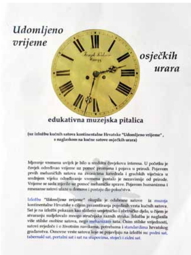
Sl. 2 Edukativna muzejska pitalica „Udomljeno vrijeme osječkih urara“

Za izložbu „Udomljeno vrijeme“ Muzej Slavonije tiskao je i edukativnu muzejsku pitalicu „Udomljeno vrijeme osječkih urara“ koja sadrži tri dijela: prvi dio sadrži osnovne informacije o izložbi, u drugom dijelu reproducirane su fotografije satova osječkih urara s kratkim tekstom o njima i pitanjima kojima se od učenika traži prepoznati izloženi sat, uočiti njegov broj na izložbi, odrediti tip sata i odrediti pripadajućeg autora/urara za svaki od osam izdvojenih satova, a treći dio je pojmovnik - podsjetnik učenicima na uglavnom nove pojmove s kojima su se susreli na izložbi.