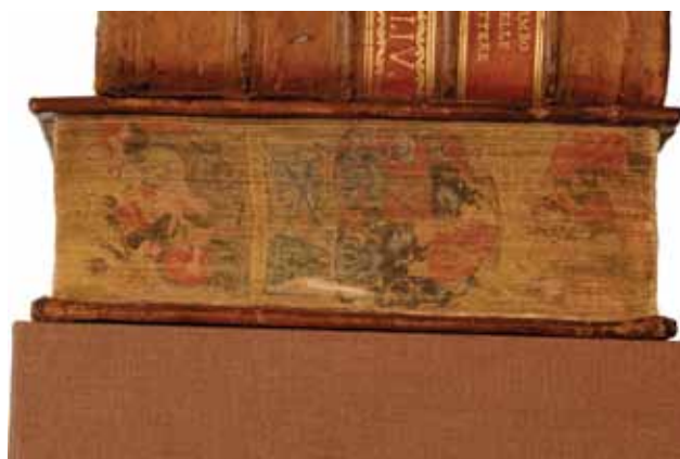
Sl. 3 Oslikani tzv. obrez knjige