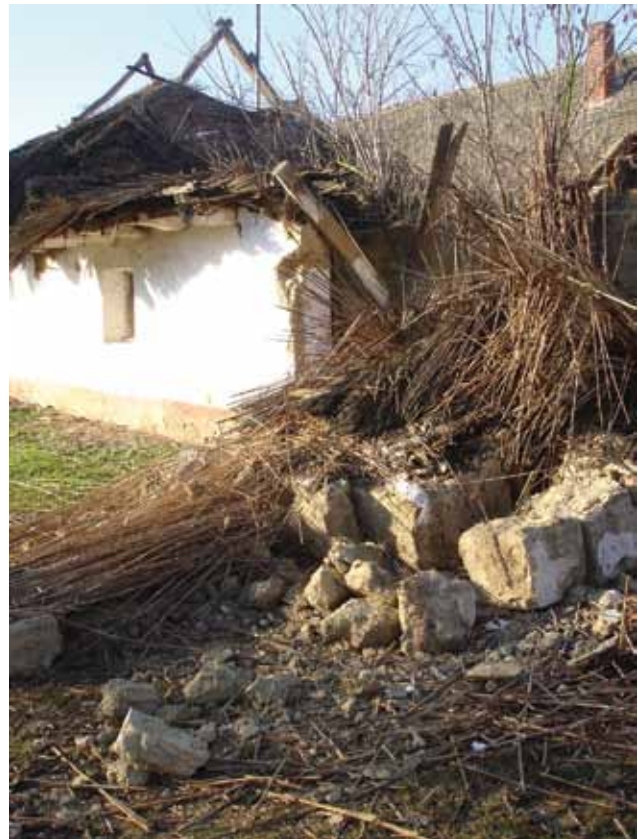
Sl. 1. Dokumentiranje rušenja dotrajale staje s kolnicom od naboja u Šokačkoj kući u Topolju, 2007. g.

Terensko istraživanje uključuje i praćenje raznih manifestacija i događanja poput sajma obrta i umijeća u Aljmašu, I. regionalnog susreta zavičajne knjige i etno glazbe u Osijeku, prezentacije češljanja i oblikovanja ženskog ogavlja Kukujevaca za članove u prostorijama udruge „Šokačka grana“, tečaja zlatoveza u organizaciji „Rubine“, udruge za očuvanje i promicanje narodne baštine u Osijeku