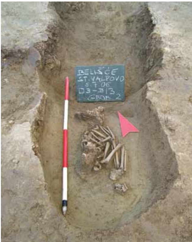
Sl. 4 Beliše 2006.