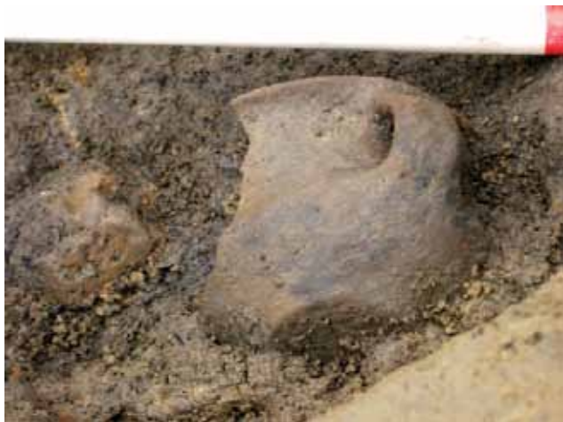
Sl. 13 Josipovac Punitovački, AN 20, 5A, Sj 021-022, PN 81, 2008.

Obavljeno je i nekoliko manjih arheoloških nadzora u Osijeku: Srijemska i Tijardovićeve ulica u Donjem gradu i Ulica S. Petefija u Retfali, te u Lugu u Baranji, bez značajnijih nalaza.