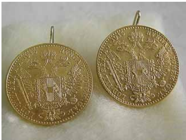
Sl. 11. Otkup - zlatne naušnice dukatići, Levanjska Varoš, 2008. g.

- Levanjska Varoš – zlatne naušnice dukatići