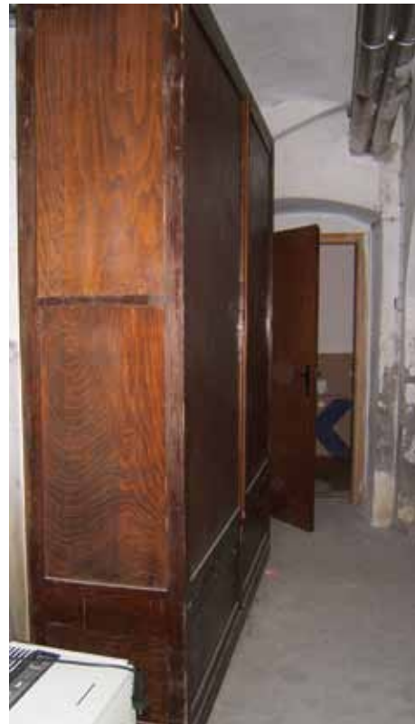
Sl. 21. Neadekvatni ormari za tekstil, 2006. g.

Za potrebe projekta sustavnog istraživanja Osječko-baranjske županije i za druga istraživanja nabavljena je 2008. g. nova oprema: prijenosno računalo, videokamera s mogućnošću fotografiranja i kvalitetan snimač zvuka za bolju zabilježbu govora i pjesme.