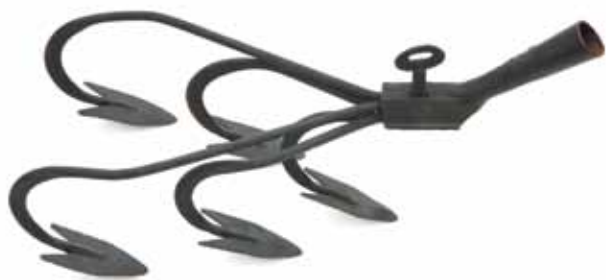
Sl. 2 Poljodjelska alatka Wolf s pet motičica