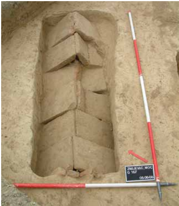
Sl. 3 Zmajevac, grob 167