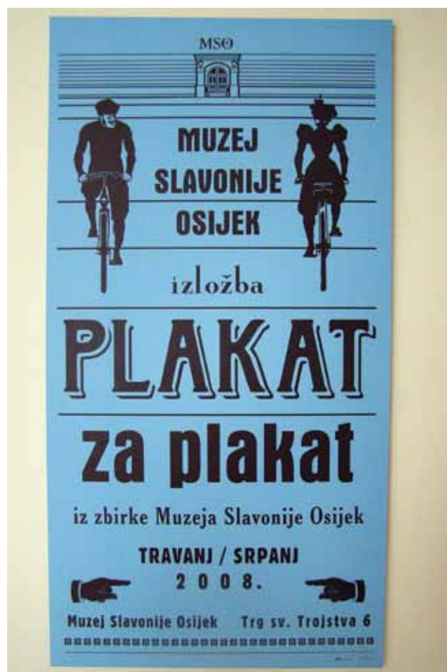
Sl. 4 Plakat uzložbe

Svojevrsni je ovo povijesni mozaik grada, sličice prošlosti koje progovaraju o životu grada iz različitih uglova. Izložbu prati i zanimljiv katalog neobičnih dimenzija.