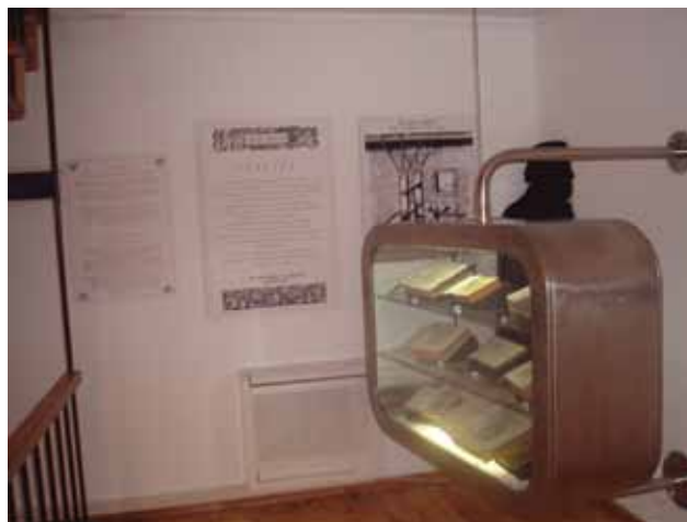
Sl. 6 i 7 Gostovanje izložbe Tiskopisi 16. st. u Domu M. Držića u Dubrovniku

Program Noći muzeja obogaćen je i zanimljivom izložbom A što oni rade . Riječ je o karikaturama muzejskih stručnih djelatnika i vječnom pitanju – što se to uopće u muzeju radi. Karikaturama i sloganima muzealaca željelo se ukazati na nedovoljnu upućenost u muzejsku, uopće kulturnu djelatnost u našem gradu, ali i šire. Izložbu prati i prigodni katalog.