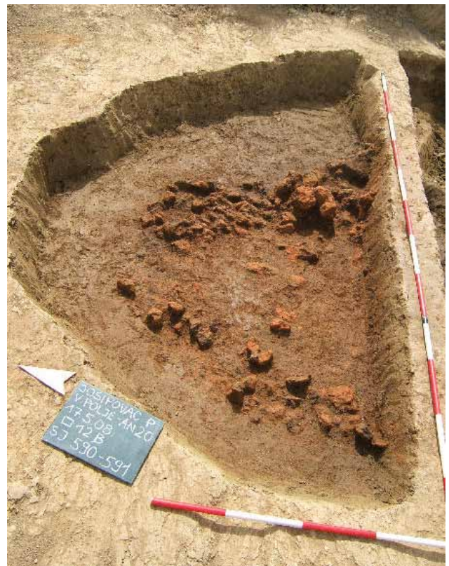
Sl. 11 Josipovac Punitovački, AN 20, 12B, Sj 590-91, 2008.

U 2008. g. najopsežnije i najdugotrajnije zaštitno arheološko iskopavanje obavljeno je na lokalitetu Josipovac Punitovački-Veliko polje II , nedaleko Đakova, na trasi autoceste Budimpešta-Ploče, tzv. Koridoru 5 C. Radovi su trajali od 26. ožujka do 21. lipnja, a tijekom iskopavanja istražen je velik dio kasnobrončanodobnog naselja kulture polja sa žarama, s nizom jamskih objekata i velikom količinom keramičkog i ostalog arheološkog materijala. Među nalazima se osobito ističe nekoliko brončanih ukrasnih igala, zatim mala brončana narukvica s otvorenim krajevima u obliku petlje, brončana dugmad i ukrašena olovna aplikacija.