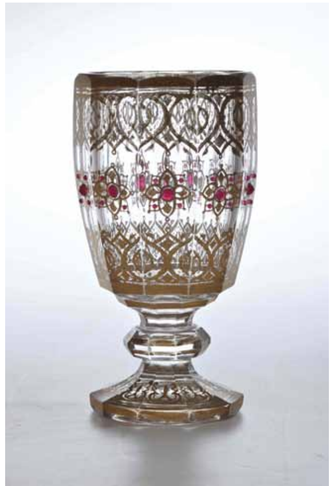
Sl. 5 Čaša na nožici, Češka (?), druga pol. 19. st.; bezbojno prozirno staklo, pozlata, aplikacija staklenih zrnaca (otkup, 2006.)

Za Zbirku metala otkupljena je perforirana posrebrana posuda s poklopcem i umetkom od modro obojenog stakla,