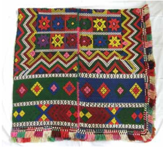
Sl. 10. Otkup - ponjavac, svečani vuneni prekrivač za krevet, tkala Kata Vračević r. Sljepčević, oko 1897.g. u Gašincima, 2008. g.

- Levanjska Varoš – zlatne naušnice dukatići