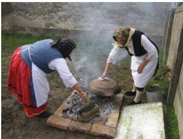
Sl. 3. Fotoradionica u organizaciji Udruge Šokačko srce u Zelčinu - priprema i pečenje pogače pod vršnikom, 2008. g.