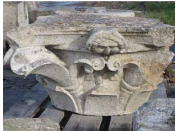
Sl. 8 Vojarna - Građevinski fakultet, foto: S. Filipović