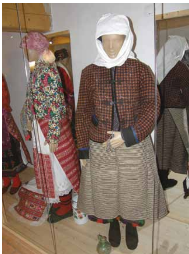
Sl. 17. Postav izložbe Od sjemena do ruha : nošnje ovisno o prigodi i dobi – snaša koja nosi milošće povodom rođenja djeteta i stara žena u dubokoj žalosti, Topolje, 2007. g.