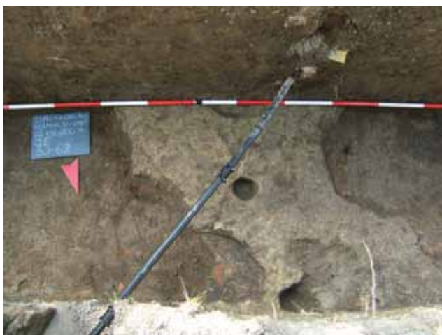
Sl. 8 Osijek-Hermanov vinograd, 2007.