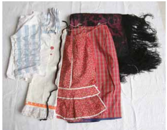
Sl. 7. Otkup kompletne nošnje iz Bizovca: dječja nošnja za opetovnicu ( oplećak ponemački, krilca ubirana, suknja crvena šarena, kecelja šarena, marama svilena, kadifa, cvetić uz uvo ), 2007. g.; snimila V. Barjaktarić