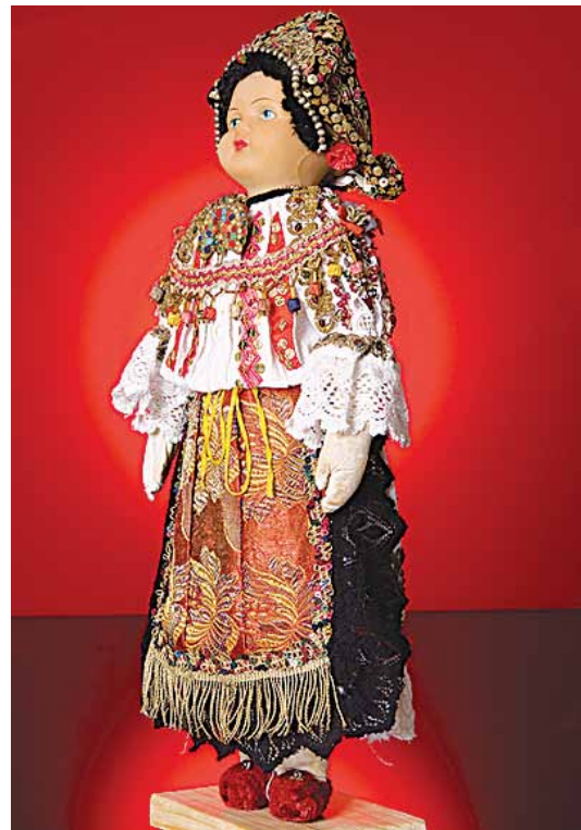
Sl. 18. Restauracija 2006. g.: lutka u nošnji mlade žene iz Gajića, MSO-156870