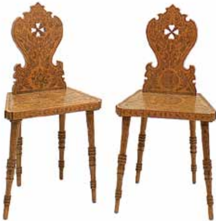
Sl. 19. Restauracija 2008. g.: namještaj za djevojačku sobu ukrašen tikvičarskom tehnikom i ornamentikom; snimio M. Topić