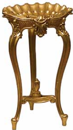
Sl. 10 Stolić za posjetnice u obliku školjke, 19. st. (U-549), Restauratorski atelier Nava d.o.o. Zagreb, 2008. (restaurator Radovan Karković)

iz 19. st. (U-549), restauriran, također, u Restauratorskom atelieru Nava d.o.o. , pa su oba predmeta postavljena na izložbi S druge strane ogledala u dijelu restauriranih predmeta MSO-a.