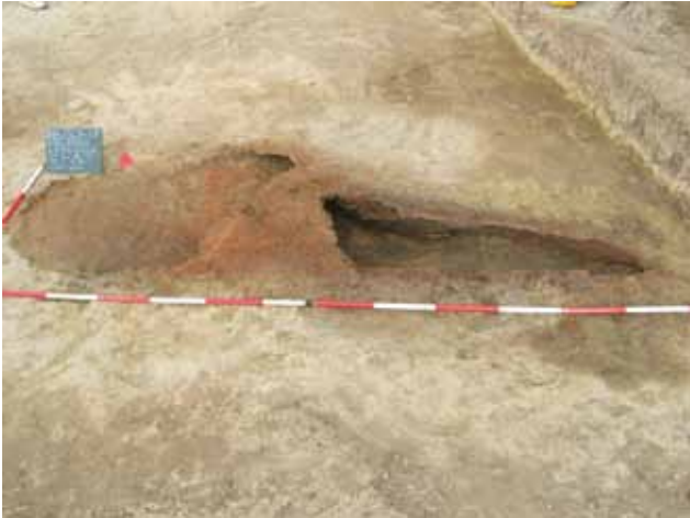
Sl. 3 Beliše 2006.

Tijekom iskopavanja otkriveno je i nekoliko grobova. Dva su bila potpuno očuvana – dječji i grob odrasle osobe, dok je ostalih šest bilo razoreno pa je od kostura preostalo samo nekoliko kostiju koje su označavale položaj nekadašnjeg groba. Ni u jednom grobu nisu pronađeni prilozi, a analiza C 14 pokazala je kako se radi o ranoneolitičkim ukopima.