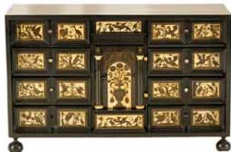
Sl. 9 Kabinetski ormarčić od crnog ulaštenog drveta, imitacije ebanovine, intarzije bjelokosti (Italija, 17. st., U-74); Restauratorski atelier Nava d.o.o. Zagreb, 2007. (restaurator Radovan Karković).

Koncem 2007. g. s restauracije je dopremljen kabinet-ski ormarčić od crnog ulaštenog drveta, imitacije ebanovine, sprijeda bogato raščlanjen, ukrašen intarziranim bjelokosnim pločicama s motivima različitih stvarnih i fantastičnih ptica te raslinjem (Italija, 17. st., U-74). Restauraciju je obavio Radovan Karković iz Restauratorskog atelier Nava d.o.o. iz Zagreba.