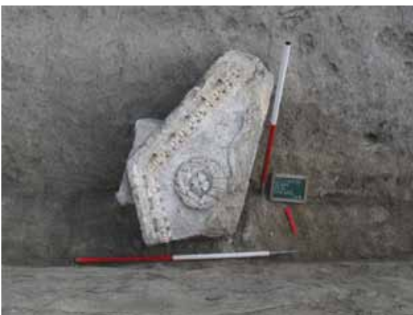
Sl. 9 Vojarna - Građevinski fakultet