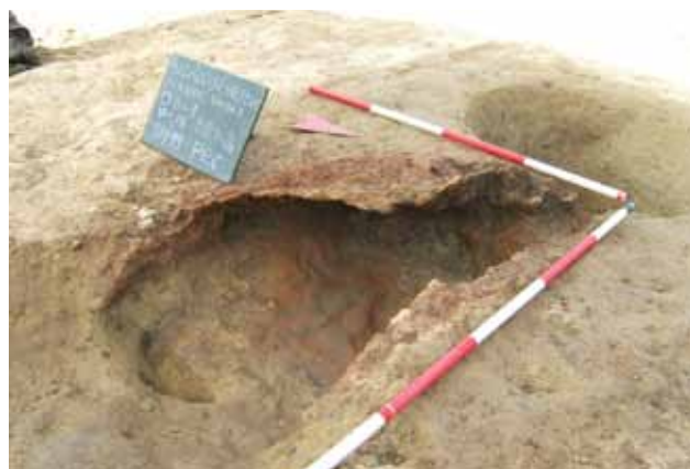
Sl. 2 Belišće 2006.

Među nalazima se ističu dvije kupolaste peći s cjevastim produžetkom, pronađene unutar starčevačkog naselja. Jedna od njih, bolje očuvana, prenesena je u Muzej Slavonije.