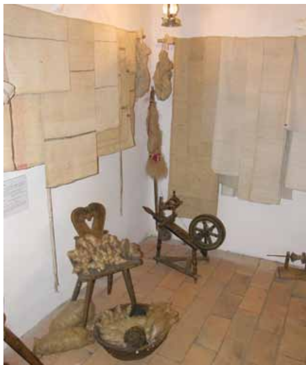
Sl. 16. Postav izložbe Od sjemena do ruha : dio procesa prerade kudjelje i proizvodi od pređe slabije kvalitete – vreće, asure, ponjave..., Topolje, 2007. g.