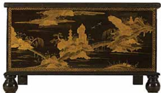
Sl. 8 Japanska drvena škrinja izvedena tehnikom laka (prva polovica 19. st., MSO-157079), Restauratorski atelier Nava d.o.o. Zagreb, 2006. (restaurator Radovan Karković).

Tijekom 2006. g. restaurirana je japanska drvena škrinja izvedena tehnikom laka (prva polovica 19. st., MSO-157079), oslikana „otocima“ fantastičnog pejzaža povezanih mostićima, s tipičnim japanskim građevinama izvedenim zlatnom bojom i zlatnim prahom. Restauraciju je izveo Restauratorski atelier Nava d.o.o. iz Zagreba, tj. restaurator Radovan Karković.