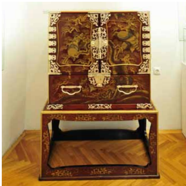
Sl. 11 Kabinetski ormar, Japan, druga pol. 19. st.; drvo, lak, zlatni i srebrni prah, posrebreni lim (U-183) - Restauratorski atelier Nava d.o.o. Zagreb, 2008. (restaurator Radovan Karković)

Koncem 2008. g. s restauracije je dopremljen kabinetski ormar, japanski, iz druge polovice 19. st.; drvo, lak, zlatni i srebrni prah, posrebreni lim (U-183). Restauraciju je i u ovom slučaju obavio restaurator Radovan Karković.