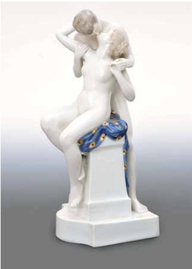
Sl. 3 Figura, Richard Aigner, „Rosenthal“, München, Njemačka, oko 1920. (otkup, 2006.); porculan, oslikano, cakljeno

Zbirka keramike obogaćena je raznovrsnim uporabnim predmetima od fajanse i porculana (26-dijelni servis za ručanje, servis za kavu, bombonjera s poklopcem, dvije kantice za kavu s filtrom, pladanj za tortu s lopaticom, modla za kuglof , dva pladnja s ručkama, obodom od mjedi i kuglastim nožicama, dva cache-pota , posuda-pročišćivač za vodu s filtrom, boca za liker Zara i dr.) te ukrasnim predmetima (bista bradatog muškarca, figure „Žena na noju“, „Poljubac“, „Klizačica“, pepeljara s figurom psa, šest porculanskih figurica, ukrasna zdjela i dr.). Većina ovih predmeta proizvod je poznatih europskih tvornica iz prve polovice 20. st. ( Zsolnay, Herend, Rosenthal, Thun i dr.).