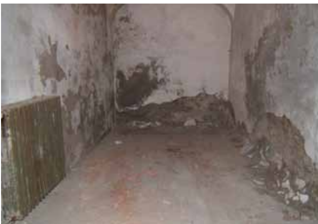
Sl. 20. Stanje depoa tekstila Etnografskog odjela prije građevinskih radova, 2006. g.

Krajem 2006. g. izmještena je građa iz čuvaonice tekstila zbog saniranja vlage i građevinskog uređenja.