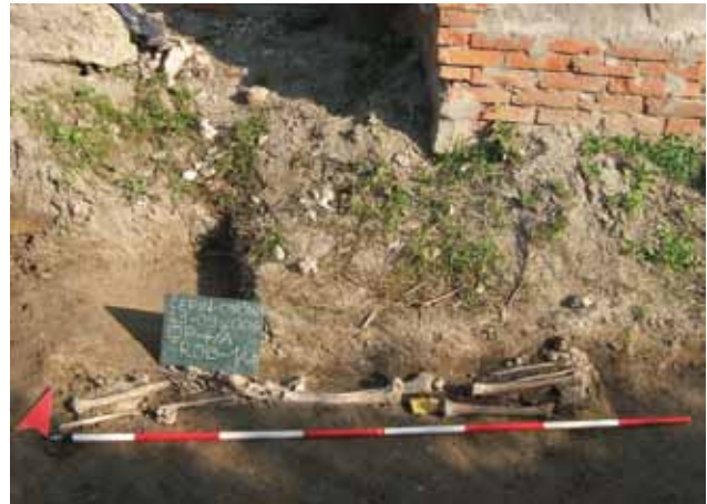
Sl. 5 Čepin-Ovčara/Tursko groblje, 2006

Od 14. rujna do 12. listopada obavljena je deseta sezona sustavnog istraživanja na prapovijesnom i srednjovjekovnom nalazištu Čepin-Ovčara/Tursko groblje . Završeno je istraživanje neolitičkog horizonta u sjevernoj uzdužnoj prostoriji P3 i ona je zatrpana, a nastavljeno je samo u njoj paralelnoj, dvadesetak metara dugačkoj južnoj prostoriji P4, na južnom dijelu nalazišta. Otkopano je 13 srednjovjekovnih grobova u zapadnom dijelu prostorije, gdje je njihova koncentracija bila izraženija. Grobovi su ukopavani u neolitički kulturni sloj, teško ga pri tome oštećivši. U istočnom dijelu prostorije nije bilo grobova i nailazilo se na cjelovitije i ne u znatnijoj mjeri oštećene neolitičke podnice.