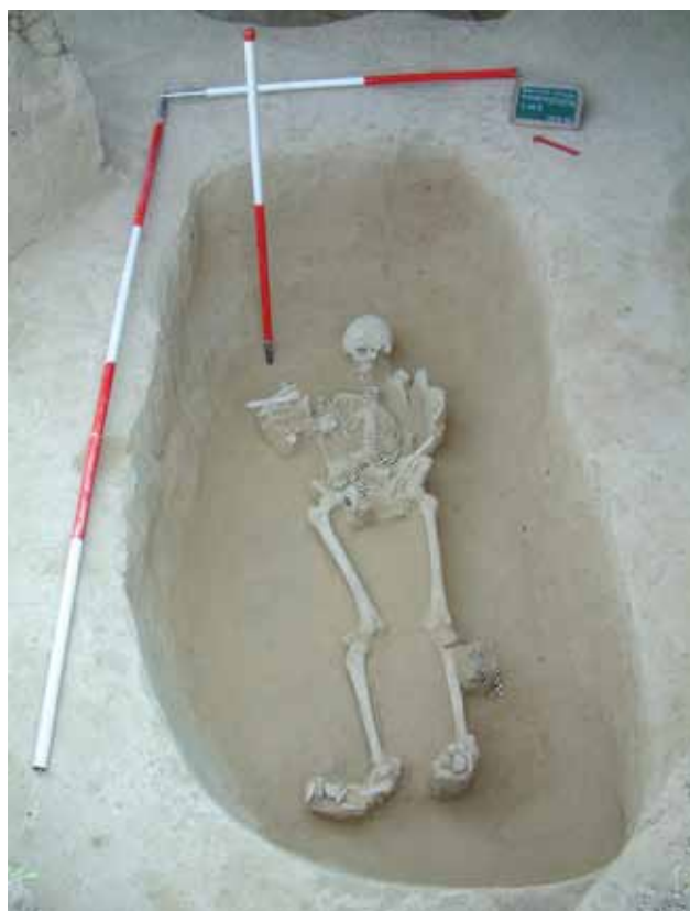
Sl. 1 Zmajevac, grob 163, foto: S. Filipović

Arheološki nalazi kao i dokumentacija pohranjeni su u Pododjelu antičke arheologije Muzeja Slavonije.