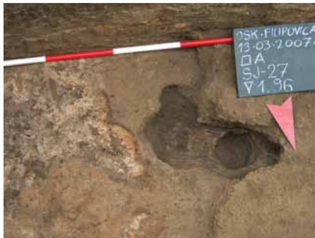
Sl. 9 Osijek-Hermanov vinograd, 2007.

Tijekom lipnja obavljeno je i zaštitno iskopavanje što je prethodilo izgradnji privatne stambene kuće, u trajanju od tri tjedna u Parku kraljice Katarine Kosača 7, u Osijeku. Pri tome je otkriven dio rimskodobnog stambenog objekta zidanoga opekom i kamenom, s dijelovima kamenih arhitektonskih elemenata, velikom količinom keramičkih ulomaka, ulomaka fresaka i dijelom vrlo oštećenog crno-bijelog mozaika.