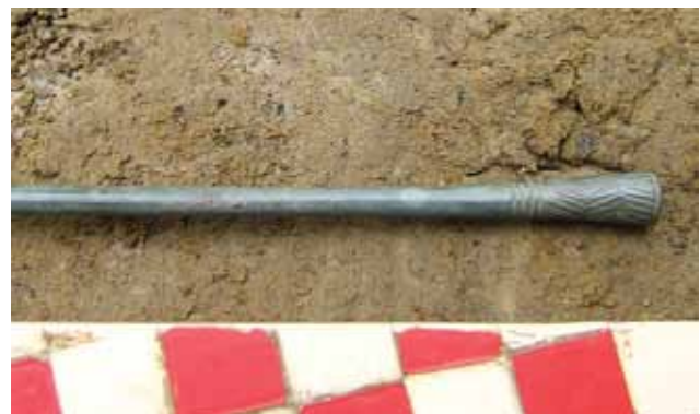
Josipovac Punitovački, AN 20, 23A, Sj 638-39, PN 224, 2008.