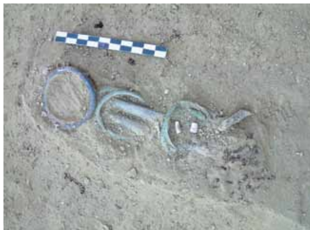
Sl. 2 Zmajevac, grob 162, foto: S. Filipović