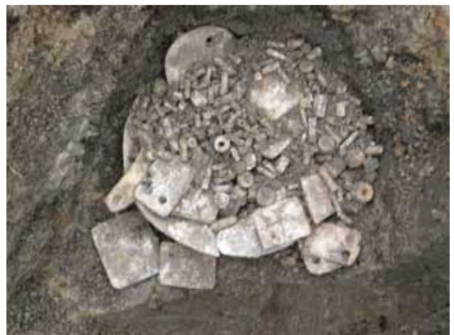
Sl. 6 Čepin-Ovčara/Tursko groblje, 2006

U blizini jedne od njih otkriven je vrlo rijedak i vrijedan nalaz. Riječ je o ostavi, tj. skupnom nalazu od 460 primjeraka nakita od školjke spondylus (kopitnjak) i roščića (vrsta sredozemnog cjevaša). Nalaz se sastojao od velikog okruglog privjeska načinjenoga od cijele ljušture školjke, u kojemu se, kao u zdjelici, nalazilo 15 okruglih i četvrtastih – pravokutnih i rombičnih – pločastih privjesaka, jedan lučni privjesak, te više od 400 sitnih cjevastih perlica od roščića i cilindričnih perlica od spondylusa .