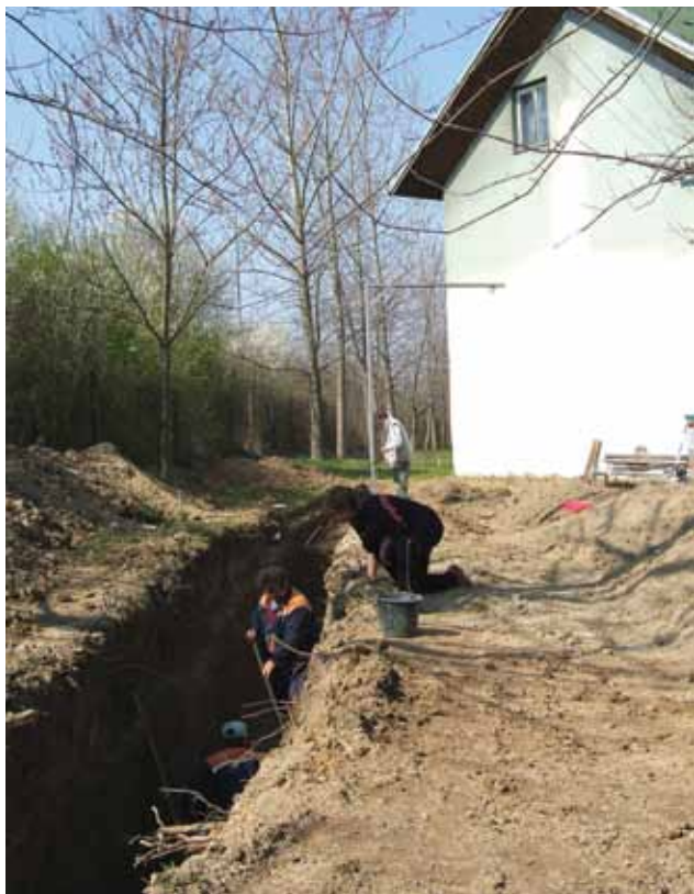
Sl. 7 Osijek-Hermanov vinograd, 2007.