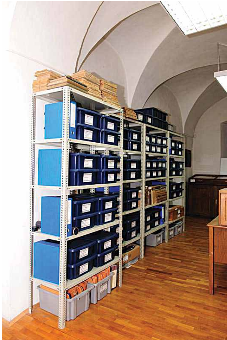
Sl. 3 Oprema i pohrana Zbirke medalja i plaketa 20. st. te Zbirke papirnatoj novca