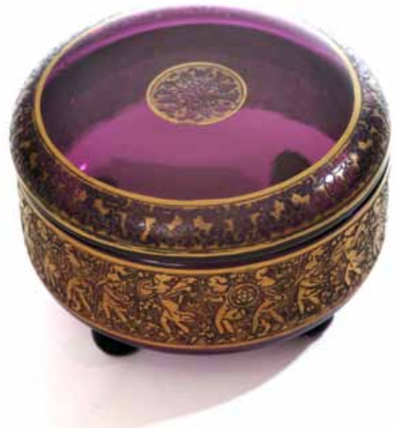
Sl. 4 Staklena posuda s poklopcem, „Ludwig Moser“ Karlsbad, 1910-20. (otkup 2007.)

Za Zbirku stakla otkupljen je znatan broj vrijednih predmeta: posuda s poklopcem izvedena iz amalgamiranog stakla ( Zwischengold ), ukrasna čaša od bezbojnog stakla s pozlatom i aplikacijama od obojenih staklenih zrnaca iz 19. st., staklena posuda s poklopcem tvrtke Ludwig Moser, Karlsbad , servis za kompot od prešanog višebojnog stakla, servis za žestu, garnitura čaša s podlošcima, garnitura desertnih čaša, tri toaletne stolne posude, bočice za parfem (ukrasne bočice, flakoni , i bočice tvrtki Guerlain, Molinard i Lalique , Pariz), staklena ambalaža ( Elida, Penkala, Stock i dr.), tri ukrasne vrtno kugle.