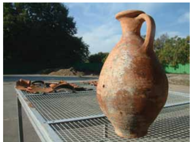
Sl. 10 Vojarna - Građevinski fakultet