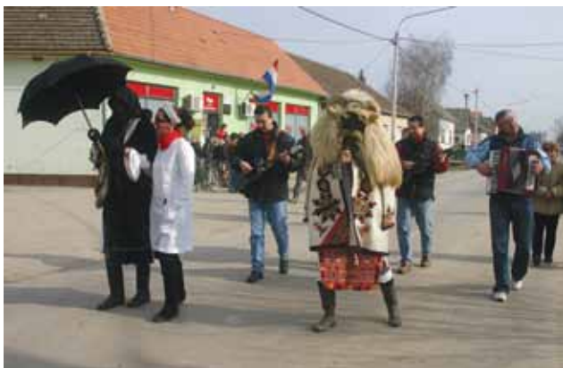
Sl. 4. Ophod buša u Topolju, 2008. g.