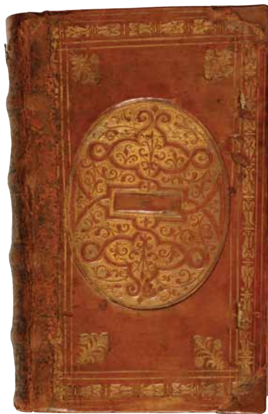
Sl. 2 Ukrašeni kožni uvez