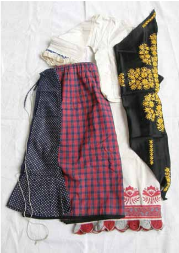
Sl. 8. Otkup kompletnih nošnji iz Bizovca: ženska nošnja s našičkom suknjom kad se izđasilo (nakon korote) i kad se moglo šareneje obuć (oplećak, krilca starovinska, suknja našička, kecelja plava, šamija od žute svile), 2007. g.

Godine 2008. otkupljeno je 169 predmeta: