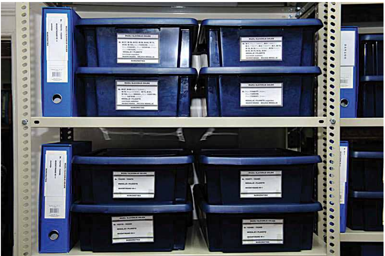
Sl. 2 Detalj opreme Zbirke medalja i plaketa 20. st.