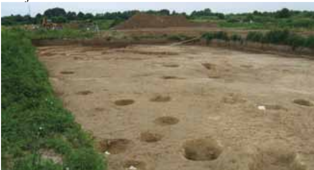
Sl. 1 Belišće 2006.

Istraživanje je prethodilo uređivanju i saniranju odlagališta neopasnog industrijskog i komunalnog otpada, tj. smetlišta koje je mjestimice i u više od 10 m debelim naslagama prekrilo najveći dio lokaliteta. Istraženo je oko 1.600 m 2 površine, u pet iskopa u kontinuitetu od juga prema sjeveru.