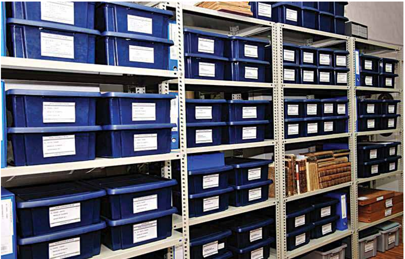
Sl. 1 Oprema i pohrana Zbirke medalja i plaketa 20. st. te Zbirke papirnatog novca