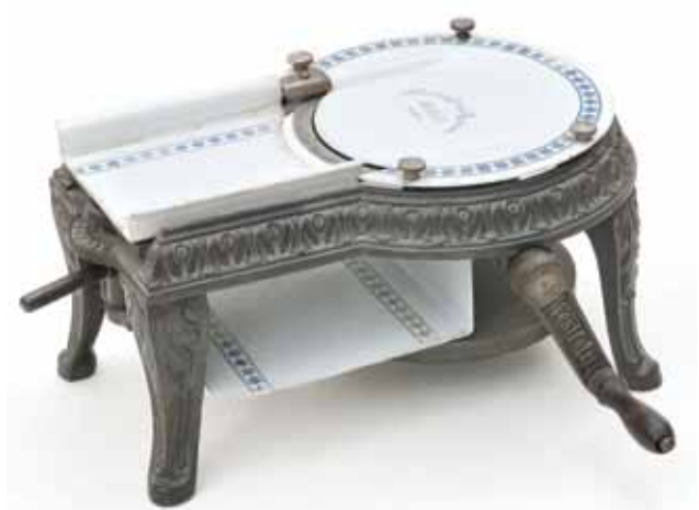
Sl. 3 Mesoreznica Westfalia, Alexanderwerk, Njemačka, oko 1890.