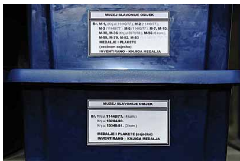
Sl. 4 Detalj opreme Zbirke medalja i plaketa 20. st.