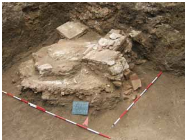
Sl. 10 Osijek, Park kraljice K. Kosača 7, 2007.

Tijekom lipnja obavljeno je i zaštitno iskopavanje što je prethodilo izgradnji privatne stambene kuće, u trajanju od tri tjedna u Parku kraljice Katarine Kosača 7, u Osijeku. Pri tome je otkriven dio rimskodobnog stambenog objekta zidanoga opekom i kamenom, s dijelovima kamenih arhitektonskih elemenata, velikom količinom keramičkih ulomaka, ulomaka fresaka i dijelom vrlo oštećenog crno-bijelog mozaika.