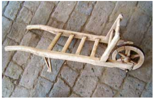
Sl. 9. Otkup - ručno izrađena drvena igračka, tajiške , Šumarina, 2008. g.

- Vuka – vuneni prekrivač, ponjavac , od domaćeg tkanja