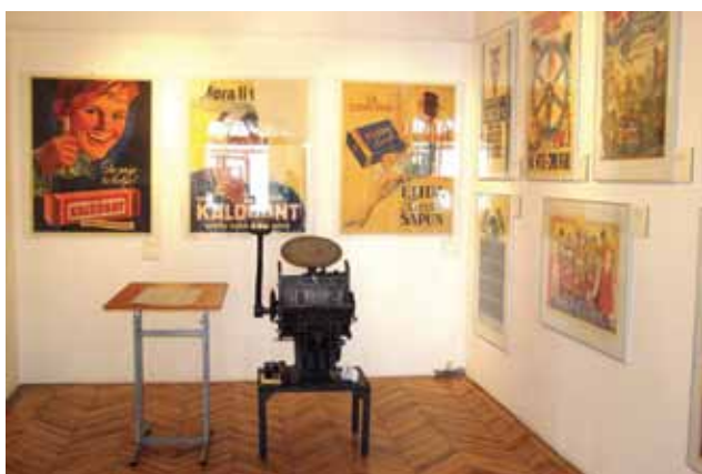
Sl. 5 i 6 Izložba Plaka za plakat u Muzeju Slavonije

Izložba Knjige 16. i 17. stoljeća iz knjižnice Franjevačkog samostana Našice otvorena je 9. svibnja.