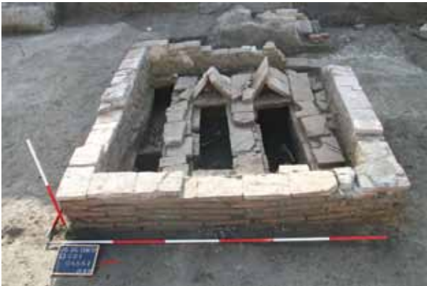
Sl. 5 Obrtnička škola, grobnica, foto: S. Filipović