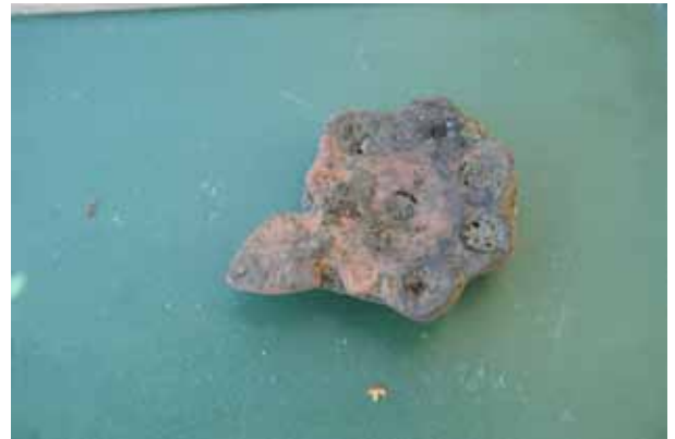
Sl. 6 Obrtnička škola, foto: S. Filipović