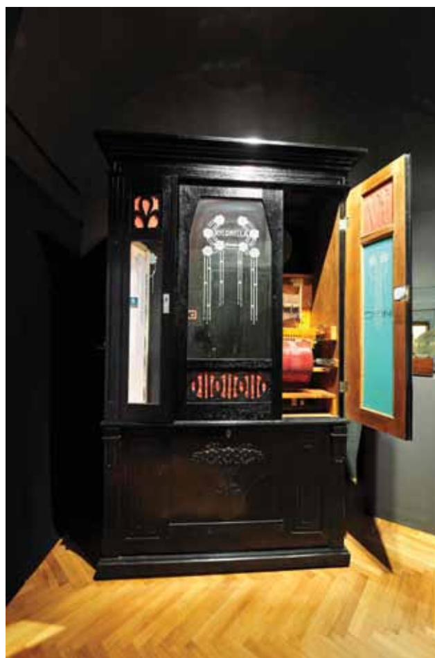
Sl. 1 Glazbeni automat Xyonella, poč. 20. st.

Druga značajna donacija jest glazbeni automat Xyonella s početka 20. stoljeća darovatelja Brunoslava Lenarda iz Osijeka . Glazbeni automat - orkestrion dopremljen je u ožujku 2007. g. u Muzej rastavljen na dijelove, te je poslan u Zagreb na restauraciju glazbenog i mehaničkog ustroja (restaurator i graditelj glazbala Antun Maloseja), te vratnica (NAVA - restaurator Radovan Karković). Već sljedeće godine restaurirani glazbeni automat (sl. 1) završio je u Muzeju Slavonije na izložbi „S druge strane ogledala“.