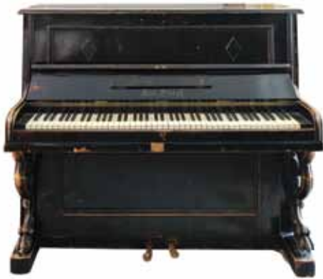
Sl. 7 Pianino „Petrof“, Češka; Centar za predškolski odgoj – Dječji vrtić, Osijek (dar, 2006.)