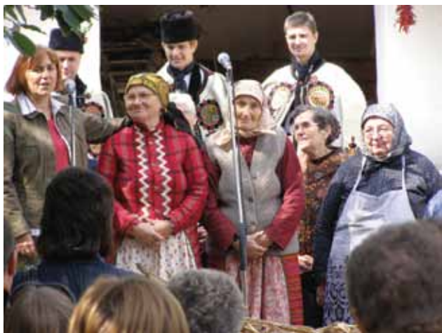
Sl. 15. S otvorenja izložbe Od sjemena do ruha u Šokačkoj kući u Topolju, 2007. g.