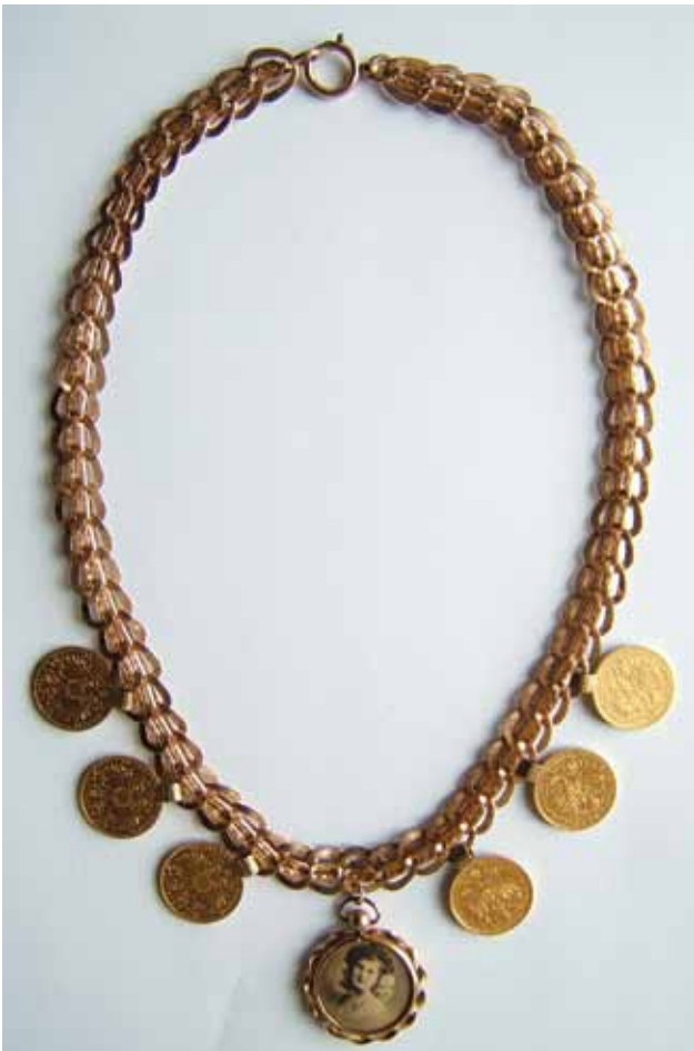
Sl. 6. Otkup nakita - dukati, šest zlatnika Franje Josipa na mjedenoj ogrlici, Duboševica, 2007. g.