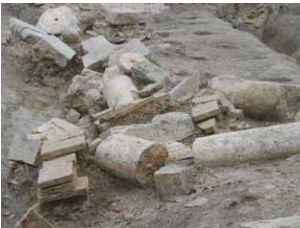
Sl. 7 Vojarna - Građevinski fakultet, foto: S. Filipović