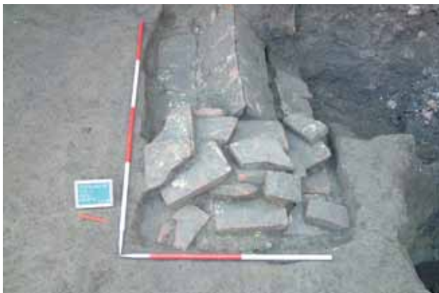
Sl. 4 Osijek - Krstova 18, grob 1, foto: S. Filipović