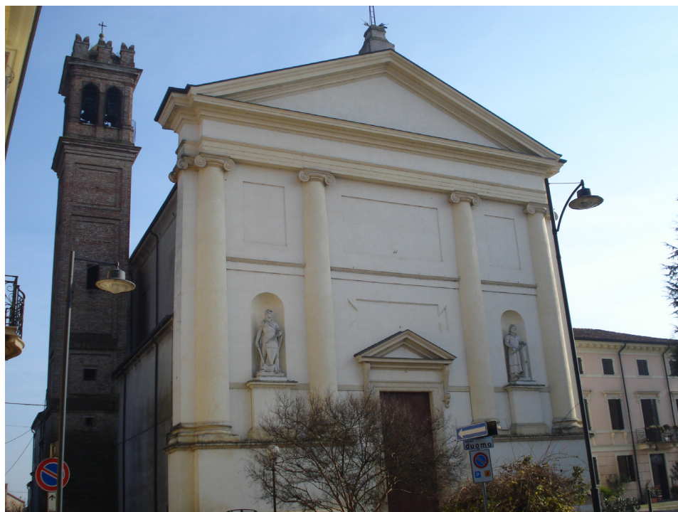
Sl. 2: Župna crkva San Giorgio Martire, Sanguinetto

pregledane su i knjige krštenih i vjenčanih s ciljem da se utvrdi je li se Stratico oženio i/ili imao djece u navedenom razdoblju, i je li ikada bio kum na kakvom vjenčanju ili krštenju.