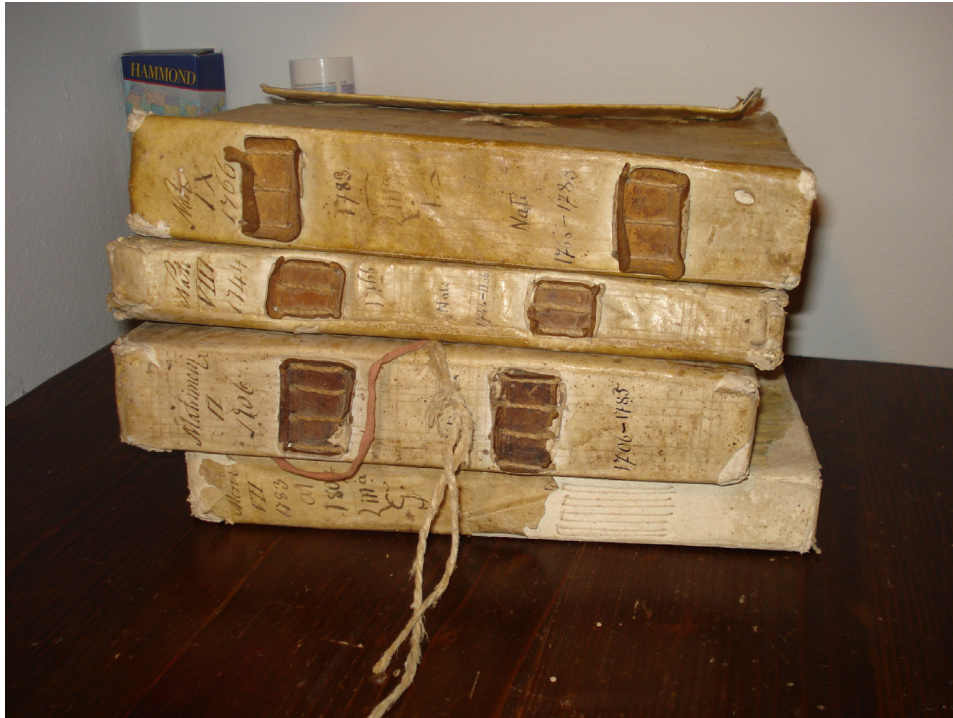
Sl. 3: Korištene župne knjige krštenih, vjenčanih i umrlih iz Arhiva župne crkve San Giorgio Martire u Sanguinetu