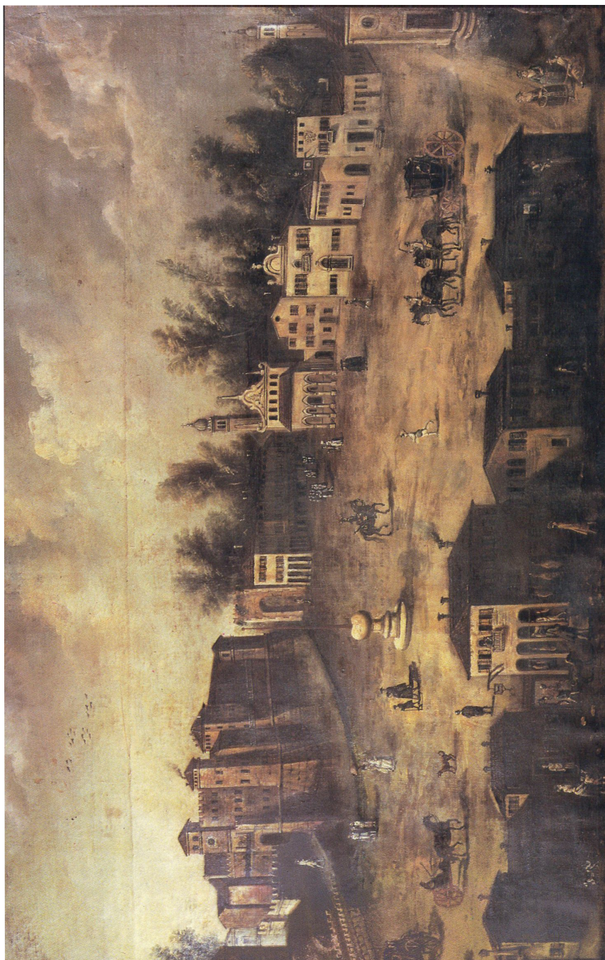
Sl. 1: Sanguinetto s kraja 18. stoljeća (ilustracija preuzeta s naslovnice knjige B. CHIAPPA — A. SANDRINI: Chiese e luoghi di culto nel territorio di Sanguinetto , Comune di Sanguinetto, Sanguinetto 1990.)