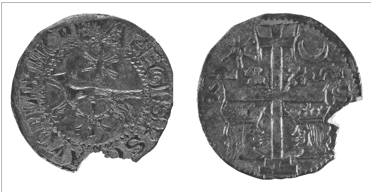
Sl. 3. Srebrni banski denar (slavonski banovac), iskovan u Zagrebu za vladavine kralja Karla I. Roberta i bana Stjepana IV. Babonića (1310-1316)