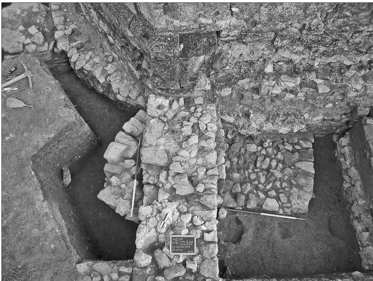
Sl. 4. Istočni dio sjeverne sakristije