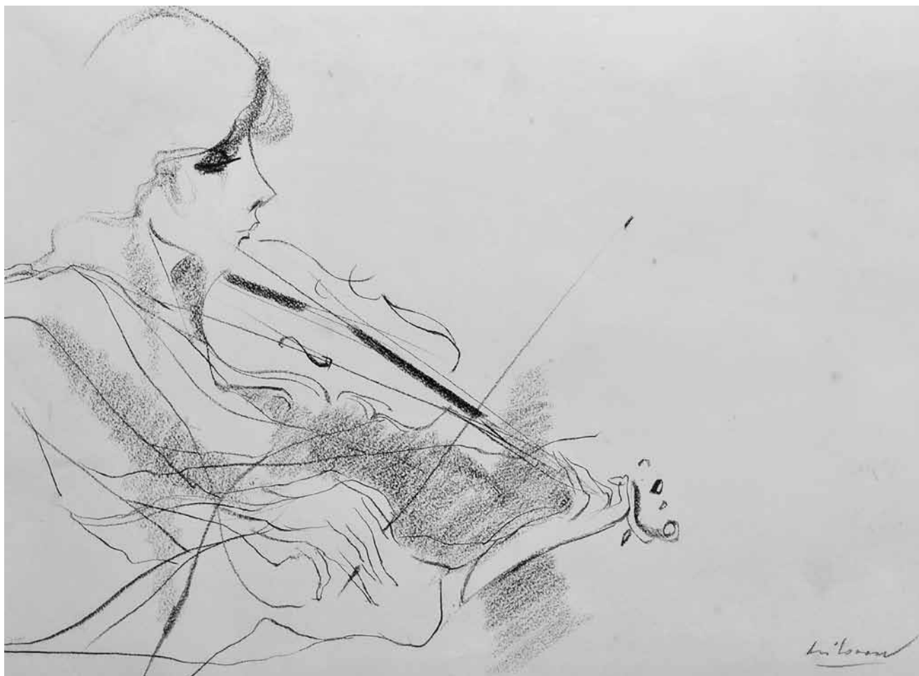
Violinistica , ugljen na papiru, 1964., privatno vlasništvo Violinist , charcoal on paper, 1964, private property

ljuju snovi s pticama, zemljoradnik s glavom od kupusa koji drži vlastitu glavu u ruci, pa predmeti – dječja kolica. Poetika Milovana Stanića privlačila je pjesnike Danijela Dragojevića, 1 kasnije Tonka Maroevića 2 i Juru Kaštelana, koji o njemu često piše. Jure Kaštelan, odrastao u istom miljeu Omiša kao i slikar, poznaje njegove prve slikarske pokušaje, za koje kaže: »Sjećam se prvih crteža i prvih slika Milovana Stanića. Učinio ih je odjednom i slikarstvo je postalo njegova sudbina.« 3 Njihovo druženje i putovanje Cetinom, noćni izleti barkom do Zakučca označili su mladost i dugo prijateljstvo pjesnika i slikara. Kaštelan razumije njegove misli i stvaralaštvo. Pa tako, jednom zgodom, Kaštelan u sumraku vidi čovjeka bez glave, koji nosi kišobran umjesto glave, pa je to možda inspiracija za spomenutu, kasnije nastalu Stanićevu sliku Portret mog prijatelja zemljoradnika .