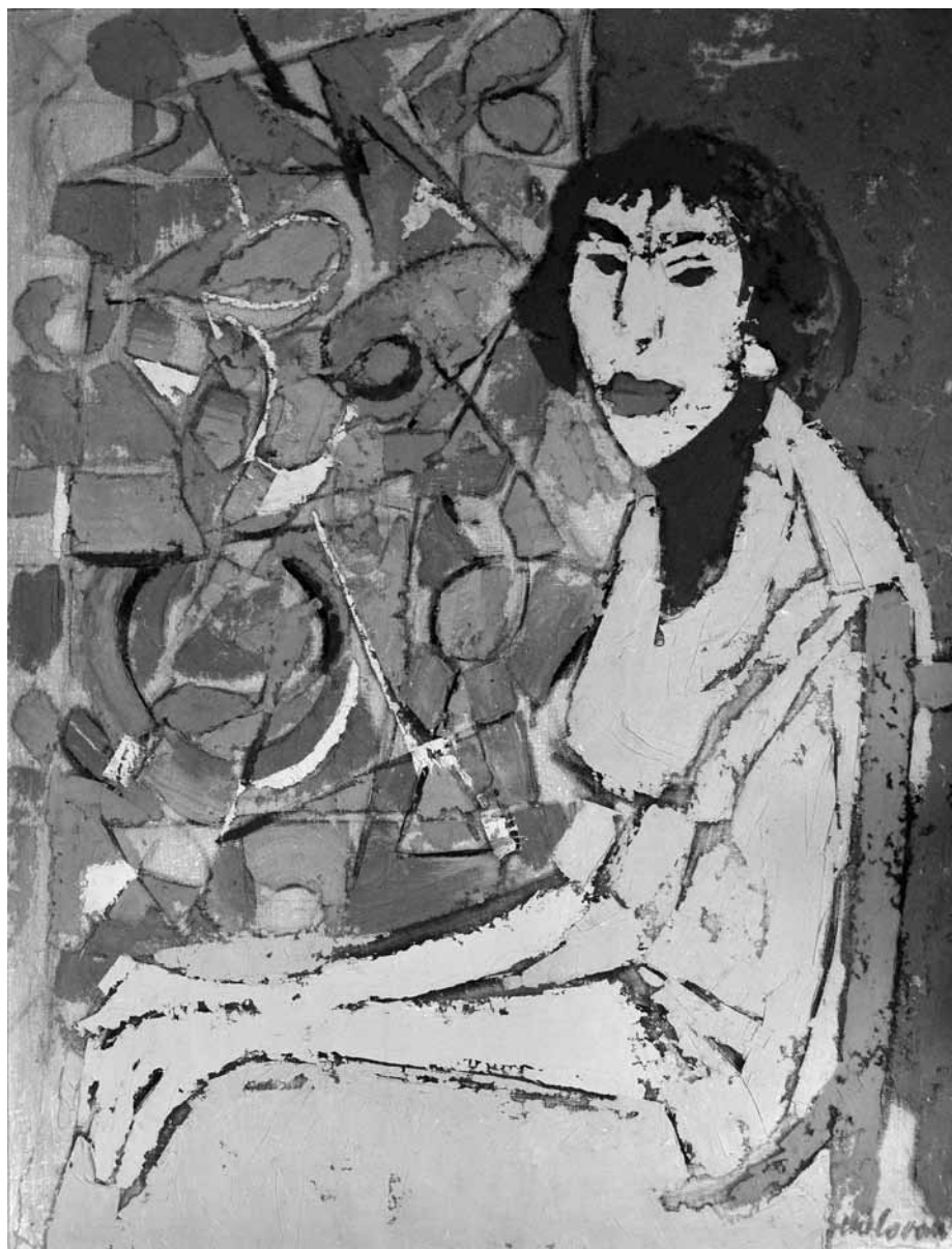
Vanja , portret, ulje na platnu, 1955., privatno vlasništvo Vanja, portrait, oil on canvas, 1955, private property

ma, koje je nanosio prstom i kistom. Vješt crtač, stvarao je brzo, pa je njegov opus golem.