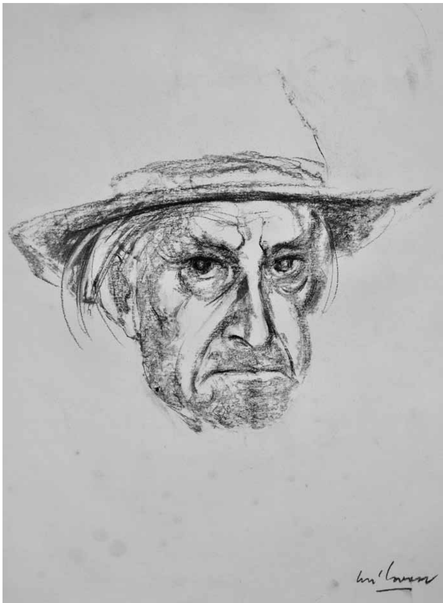
Tin Ujević – susret po sjećanju , ugljen na papiru, 1951./1953., privatno vlasništvo Tin Ujević – meeting based on the memory, charcoal on paper, 1951/1953, private property

poniralo se u diskusije o smislu i neke apsurdne ekstravagancije.