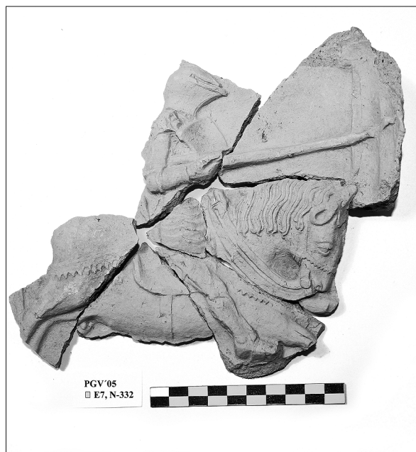
Sl. 4. Pećnjak s turnirskim motivom

U slojevima SJ 001 i SJ 003 te kontaktu slojeva SJ 001 i SJ 005 (objašnjenje sloja SJ 005 u: Tomičić et al. 2001, 259) otkriveni su brojni ulomci pećnjaka, ug-