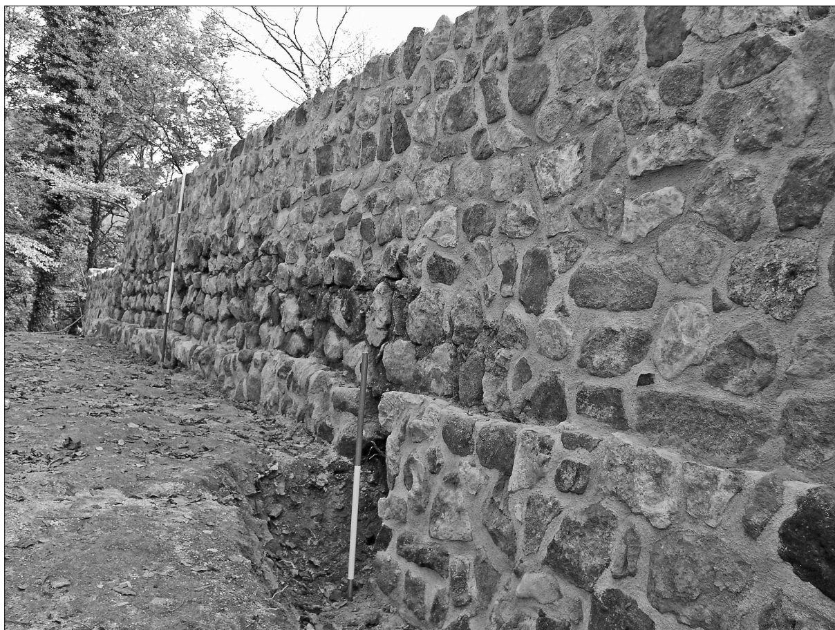
Sl. 2. Konzervirani zid, pogled od sjeverozapada