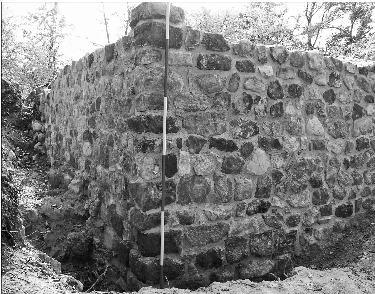
Sl. 3. Rekonstrukcija i konzervacija sjeveroistočnoga ugla