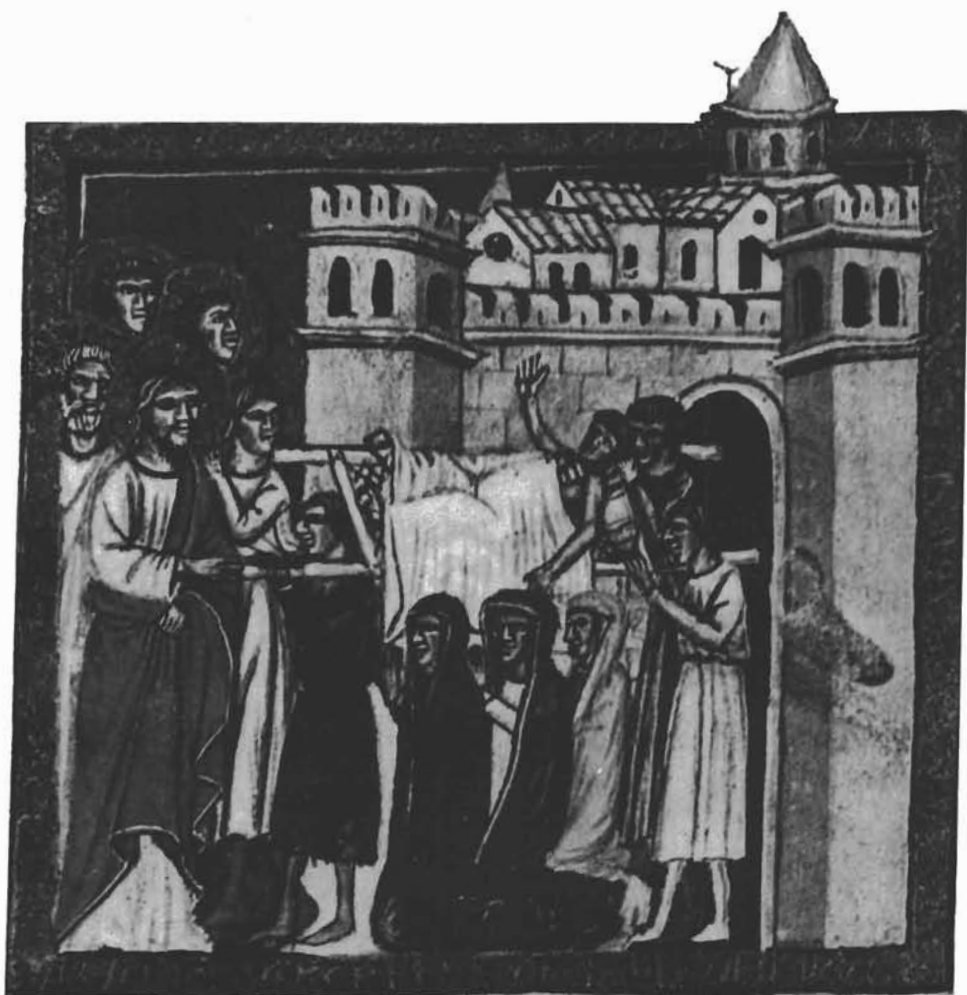
Središnji dio istočnog zida Dioklecijanove palače, prikazan na minijaturi f. 56 Hrvojeva »Misala«. — Partie centrale du mur Est du palais de Dioclétien, présentée sur la miniature f. 56 du Missel de Hrvoje