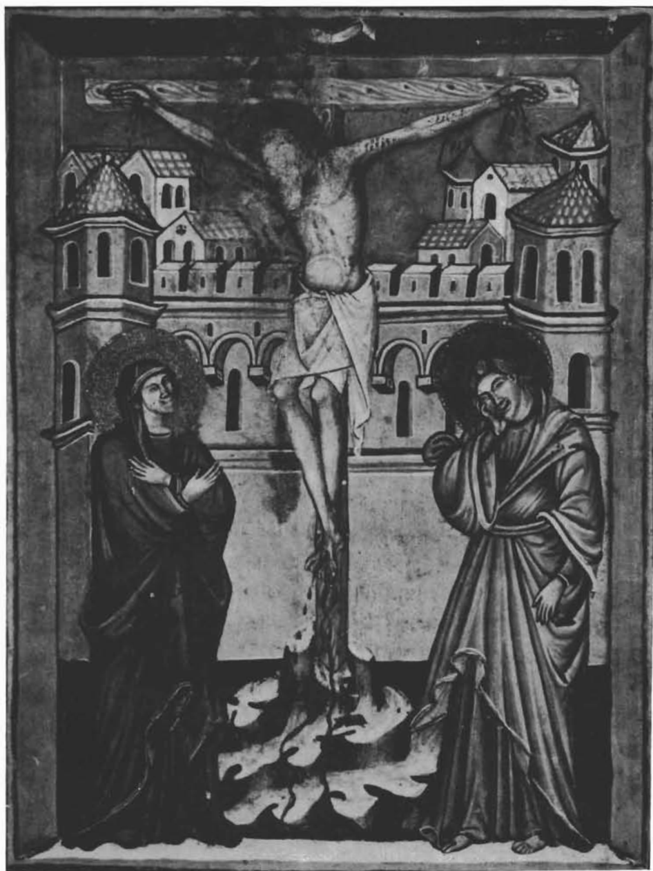
Središnji dio sjevernog zida Dioklecijanove palače, prikazan na minijaturi f. 138 Hrvojeva »Misala«. — Partie centrale du mur septentrional du palais de Dioclétien, présentée sur la miniature f. 138 du Missel de Hrvoje