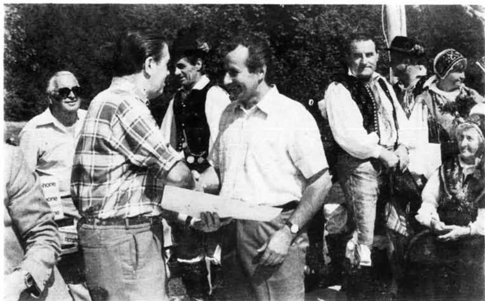
Najboljim bohinjskim stočarima dodijeljene su diplome i novčane nagrade

pastiri muzu krave dva puta dnevno, a od mlijeka pastiri proizvode na daleko poznati bohinjski sir.