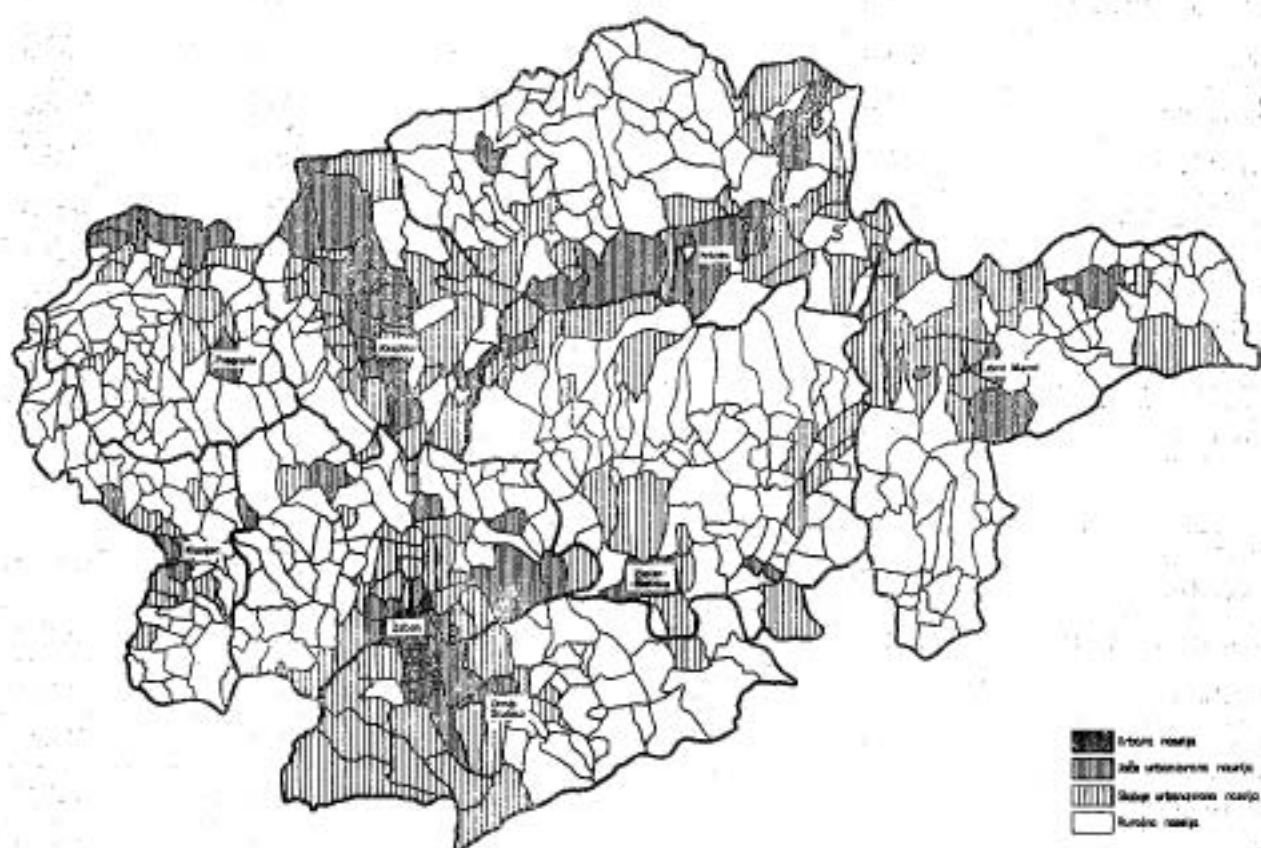
Sl. 4. Naselja Hrvatskog zagorja prema stupnju socio-ekonomske preobrazbe 1981. Fig. 4. Settlements of Hrvatsko zagorje according to the degree of socio-economic transformation 1981.

Ruralna su naselja uglavnom udaljenija od općinskih središta i bez