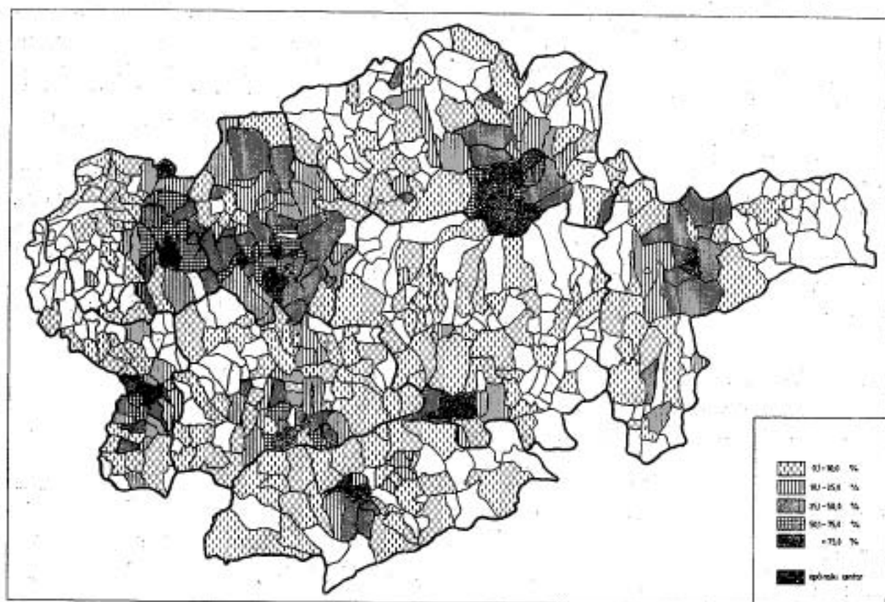
Sl. 1. Prostorni raspored i intenzitet dnevnih migracija u općinska središta Hrvatskog zagorja 1961.

Međutim, u drugoj grupi postoje bitne razlike između Krapine, s jedne, i Klanjca i Pregrade, s druge strane. Krapina još 1961. godine