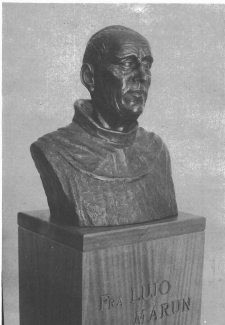
Sl. 6. Poprsje fra Luje Maruna (rad Fabijana Bakulića). — Büste von Fra Lujo Marun (Werk des Bildhauers Fabijan Bakulić)