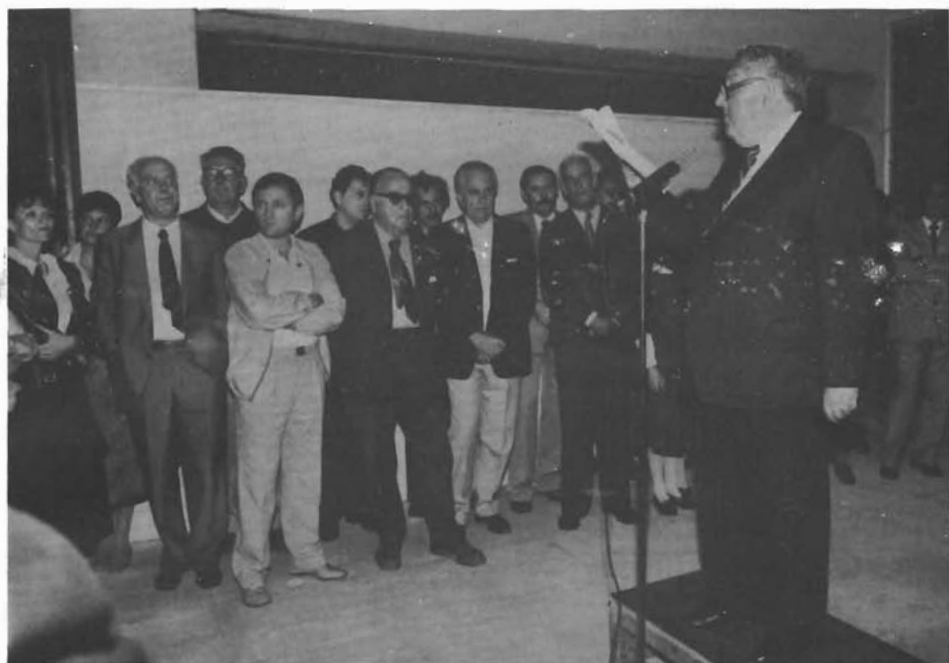
Sl. 7. Otvaranje izložbe »Bribir u srednjem vijeku«. — Eröffnung der Ausstellung »Bribir in Mittelalter«