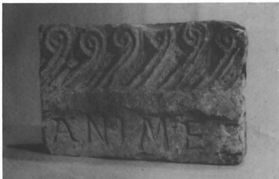
Sl. 4. — Biskupija kod Knina, slučajno otkriveni ulomak crkvene grede. — Biskupija bei Knin, zufällig entdecktes Fragments des Architravs einer Kirche