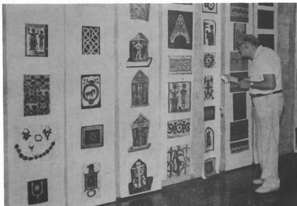
Sl. 10. Pogled na dio izložbe »Kulturna baština u očima djece«. — Blick auf einen Teil der Ausstellung »Das kulturelle Erbe in den Augen von Kindern«