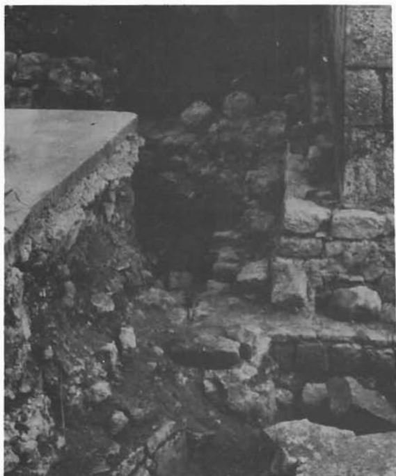
Sl. 2. Proložac — seosko groblje, dio otkrivenih temeljnih ostataka arhitekture. — Proložac, Dorffriedhof, Teil der ausgegrabenen Grundmauern eines Gebäudes