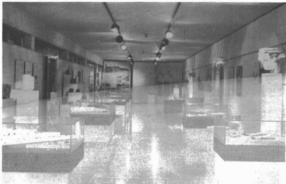
Sl. 8. Pogled na dio izložbe »Bribir u srednjem vijeku«. — Blick auf einen Teil der Ausstellung »Bribir im Mittelalter«