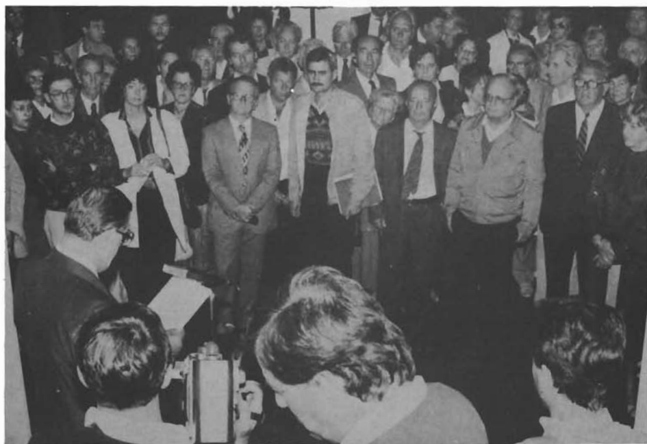
Sl. 5. Otkrivanje poprsja fra Luje Maruna. — Enthüllung der Büste von Fra Lujo Marun