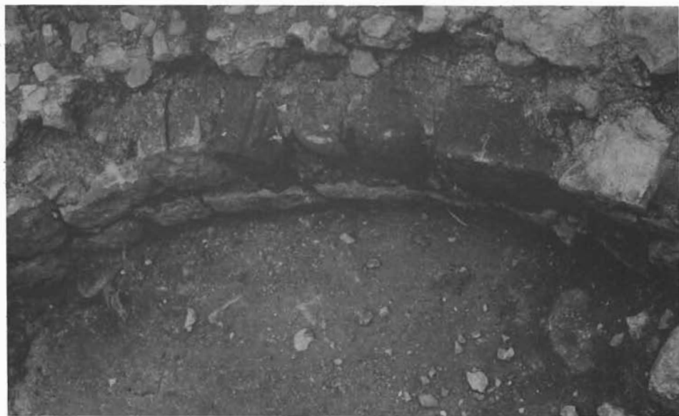
Sl. 3. Proložac — seosko groblje, otkriveni ostaci arhitekture. — Proložac — Dorffriedhof, ausgegrabene Reste eines Gebäudes