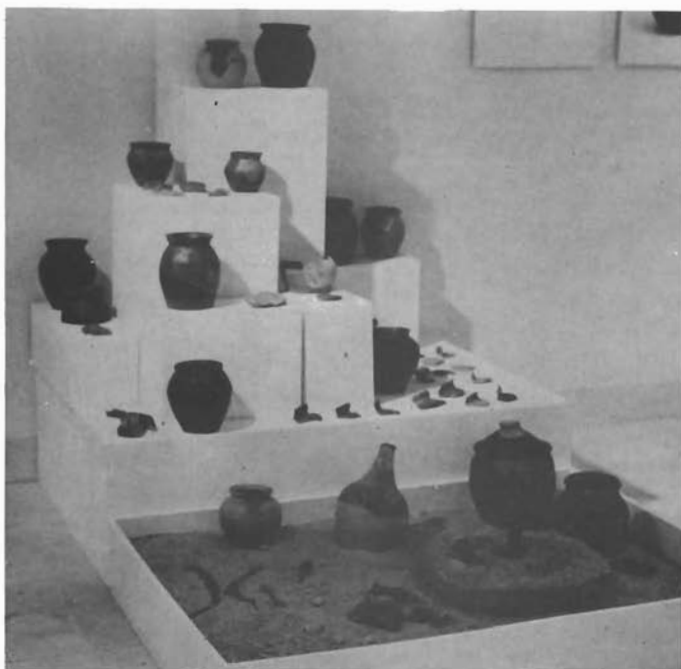
Sl. 9. Detalj izložbe »Bribir u srednjem vijeku«. — Detail der Ausstellung »Bribir im Mittelalter«