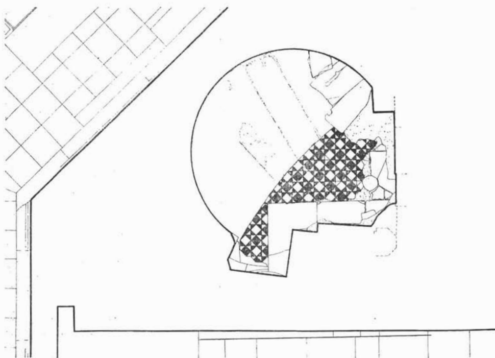
Sl. 1. Tlocrt na visini 1022 cm. — Plan at the 1022 cm level

tog poda koja se pokazala 1974: između njega i zida polukružne udubine, u čitavoj duljini, je prostor nepokriven opisanom vrstom poda. Tu je kamena podloga bez ikakva traga obloge na njoj. Ona je neznatno viša (1004.4 cm) uz rub do kamenoga poda, a neznatno se spušta (1004.1 cm) uz zid udubine. Površina takve podloge prekriva svu udubinu, tako rub kamenoga poda dotiče spoj udubine i ravnog zida mauzoleja (što nije moglo biti provjereno zbog sigurnosti Jurjevoga ciborija) i u plitkom luku ulazi u udubinu.