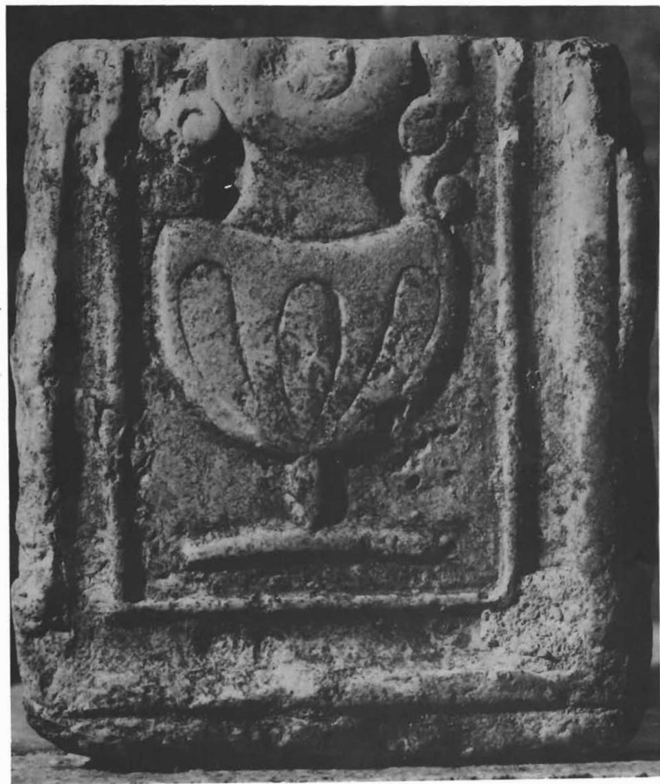
Sl. 2. Reljef vrča (kantaros). — Relief of a jug (kantharos)