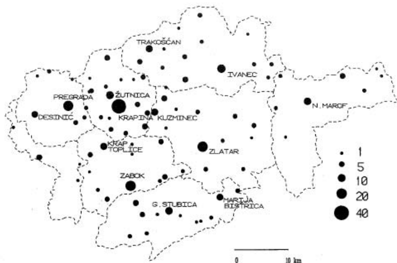
Slika 3. Centri autobusnog prometa u Hrvatskom zagorju (broj linija u polasku predstavljen je površinom kruga).