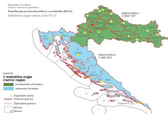
Slika 3. NUTS II podjela RH od 2013. godine