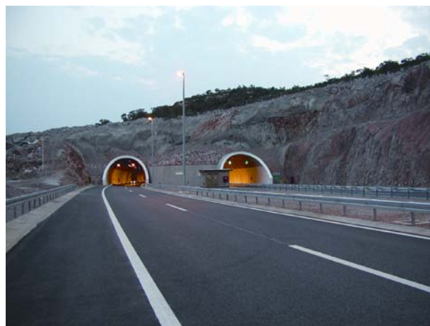
Slika 6. Pogled na sjeverne portale tunela Ledenik

Tako tunel Ledenik koji se nalazi na dionici autoceste od Sv. Roka do Maslenice, duljine lijeve cijevi 748,00 m, a desne cijevi 764,00 m, zajedno s portalnim građevinama, pripada tunelima s malim nadslojem (prosječno 40 m) i nepovoljne geološke građe. Kao specifičnost va