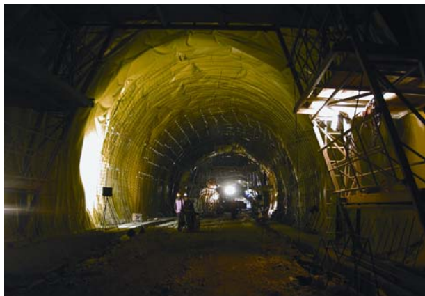
Slika 8. Radovi u unutrašnjosti tunela Dubrave

Još jedan u nizu tunela, a koji je završen i pušten u promet (5./2004.) jest tunel Dubrave na dionici autoceste od Vrpolja do Prgometa. Ovaj tunel pripada istoj kategoriji kao i tunel Ledenik, s prosječnim nadslojem od svega 25 m, te osnim razmakom tunelskih cijevi od 47 m. Duljina tunelskih cijevi je 810,50 m, odnosno 779,50 m. Bitno je reći da je i ovaj tunel zbog navedenih karakteristika bio složen jer se radilo o veoma kratkom roku gradnje. Svi građevinski radovi na tunelu završeni su za devet mjeseci.