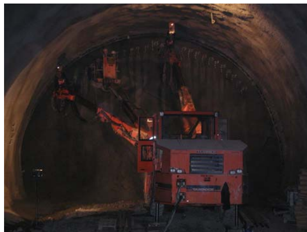
Slika 12. Bušenje i ugradnja cijevi za cijevni kišobran

Oprema i ljudi dimenzionirani su za optimalni rad u obje cijevi paralelno ali s pomakom faza u svakoj cijevi, koji omogućuje najbolje iskorištavanje svih resursa. Izuzetno zahtjevni rok gradnje tunela ostvaren je dobrom