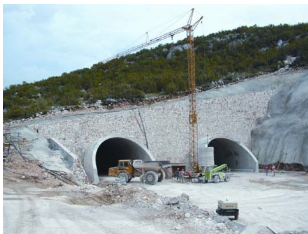
Slika 10. Pogled završni radovi na portalima

Radovi su počeli u kolovozu 2004., dakle 10 mjeseci ranije nego na cijeloj dionici iz razloga što je bilo bitno izvesti ovaj tunel radi pristupa te uopće mogućnosti rada u dijelu ove dionice.