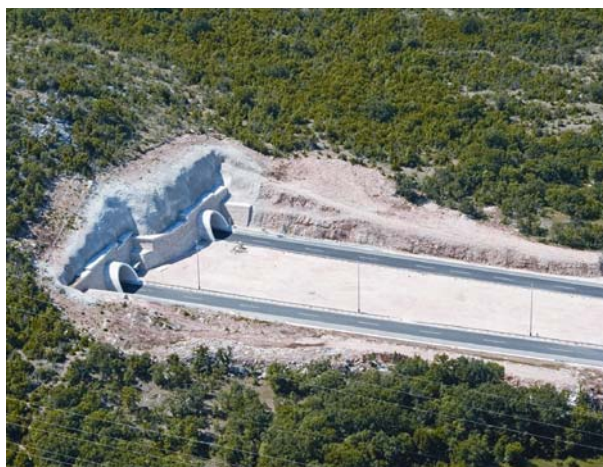
Slika 9. Pogled na dovršene portale tunela Dubrave

Za razliku od ostalih, ovaj tunel ima jedan od najljepše uređenih predusjeka (portala) pa bi kao uzor trebao služiti i ostalim tunelima na autocesti Zagreb – Split.