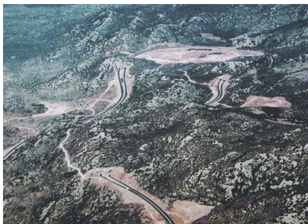
Slika 7. Panoramski pogled na područje tunela Ledenik, Čelinka i Bristovac

Ija naglasiti rad na obje strane, tj. paralelno na četiri radna "čela". Rad na iskopa i betoniranju ovog tunela funkcionirao je kao dva odvojena gradilišta sa svom potrebnom opremom i odvojenom mehanizacijom.