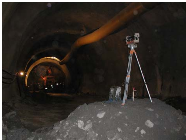
Slika 11. Lasersko određivanje smjera cijevi

Izgradnja tunela u materijalima loših geomehaničkih karakteristika problematična je i vrlo složena. Izrazita nestabilnost tih materijala nakon izvršenog iskopa zahtijeva vrlo brzu izradu primarne podgrade, uz vrlo rizičnu stabilizaciju kalote tunela. Razvojem metode cijevnog kišobrana kao dodatnog osiguranja kalotnom dijelu vrlo je efikasno riješena stabilnost kalote, a rad na iskopu znatno je sigurniji i efikasniji.