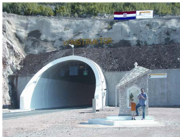
Slika 5. Pogled na portal desne tune cijevi Sv. Roka

tako je i tunel Sv. Rok rađen po NATM – tunelskoj metodi građenja.