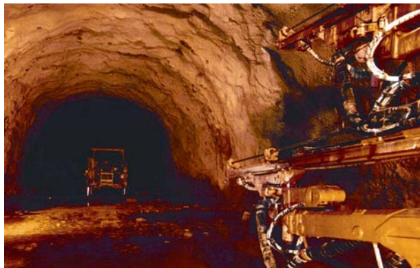
Slika 2. Iskop tunela bušenjem

bilo je potrebno pribaviti i posebne oplate za betoniranje sekundarne betonske obloge na ovim lokacijama.