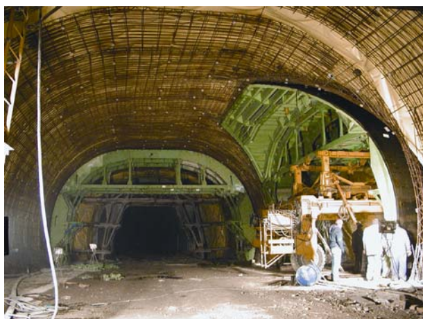
Slika 4. Detalj spajanja oplata za betoniranje dijela okretišta

Kao što je rečeno tunel Sv. Rok pripada vrlo dugim tunelima s velikim nadslojem, a po težini izvedbe iskopa pripada srednje teškim tunelima u raspucanim kraškim terenima s upotrebom lake podgrade. Kao i ostali tuneli