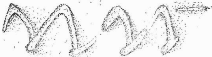
Crtež 3. Lončarski znak na keramičkoj posudi iz Bitelića. — Töpferzeichen auf einem keramischen Gefäß aus Bitelić

nje, s obzirom na to da je uz njega nađen i komadić kremenja, pretpostavka da je sekundarno služio kao kresivo. Zanimljiv je zbog činjenice da je primarno vjerojatno pripadao bojnog nožu s profiliranim vrhom i ukrašenom oštricom s obiju strana. Takvih primjeraka željeznih noževa u grobovima ranog srednjeg vijeka u Dalmaciji, uprkos činjenici