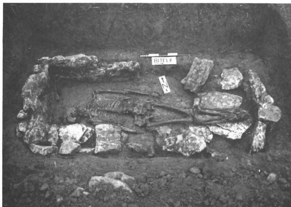
Sl. 3. Ranosrednjovjekovni grob iz Bitelića. — Frühmittelalterliches Grab aus Bitelić