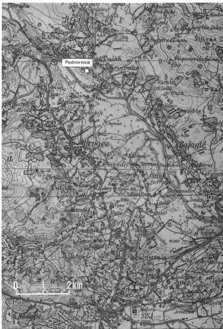
Sl. 1. Karta sinjske okolice s ucrtanim položajem nalaza. — Karte der Umgebung von Sinj mit eingezeichneter Lage der Funde