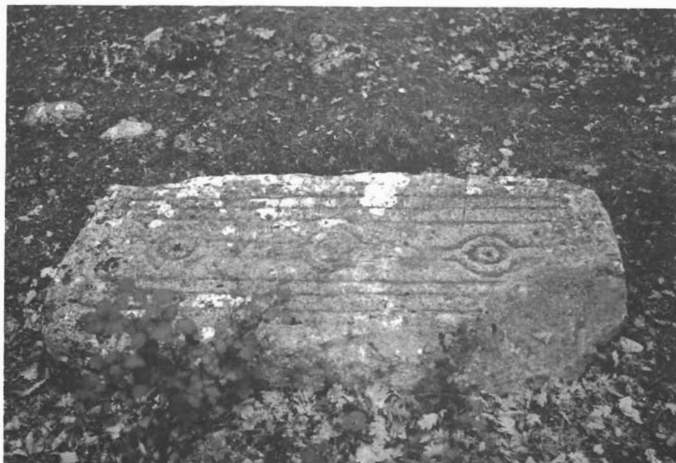
Sl. 2. Pločasti stećak na »Banovića Gorici«. — Plattenartiger Grabstein »stećak« auf »Banovića Gorica«