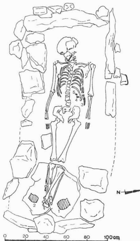
Crtež 1. Ranosrednjovjekovni grob iz Bitelića. — Frühmittelalterliches Grab aus Bitelić

Keramičke posude iz biteličkog groba međusobno se razlikuju i oblikom i veličinom. Veća keramička posuda ima jako razvraćen obod otvora s ravnomjerno i oštro odrezanim rubom (crtež 2/1, Tab. III, 1). Preko vrlo uvučenog vrata prelazi u loptasti trbuh koji se prema ravno odrezanom dnu neznatno sužuje. Na vratu posude je urezan znak lončara. Visina joj je 11,9 cm, promjer otvora 11,1 cm, trbuha na najširem dijelu 12,3 cm, a dna 9,7 cm. Manja keramička posuda ima slabo razvraćen obod otvora stanjenog i ovalno oblikovanog ruba (crtež 2/2,