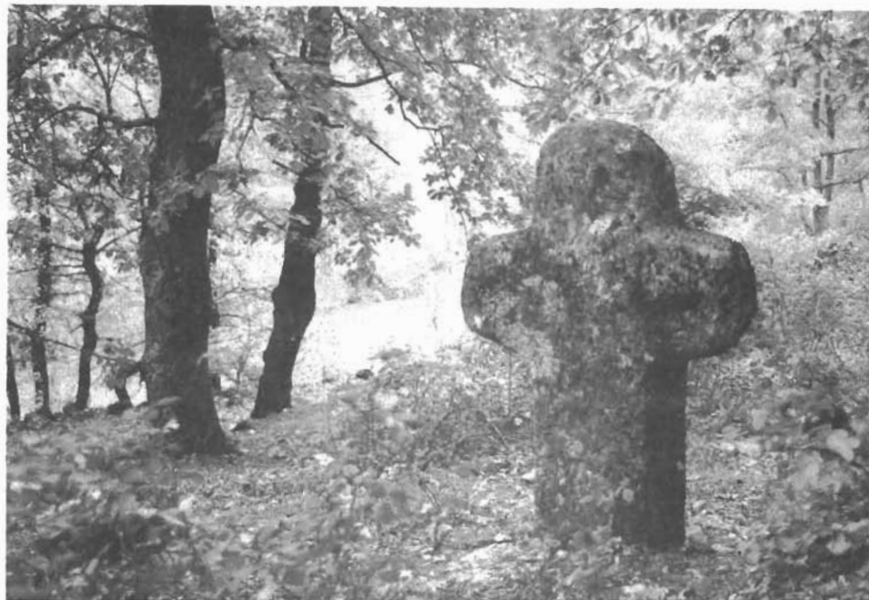
Sl. 1. Krstača na »Banovića Gorici«. — Kreuz auf »Banovića Gorica«