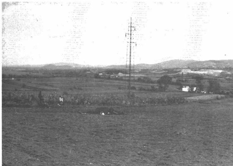
Sl. 2. Položaj nalaza ranosrednjovjekovnog groba iz Bitelića. — Lage der Funde aus dem frühmittelalterlichen Grab aus Bitelić