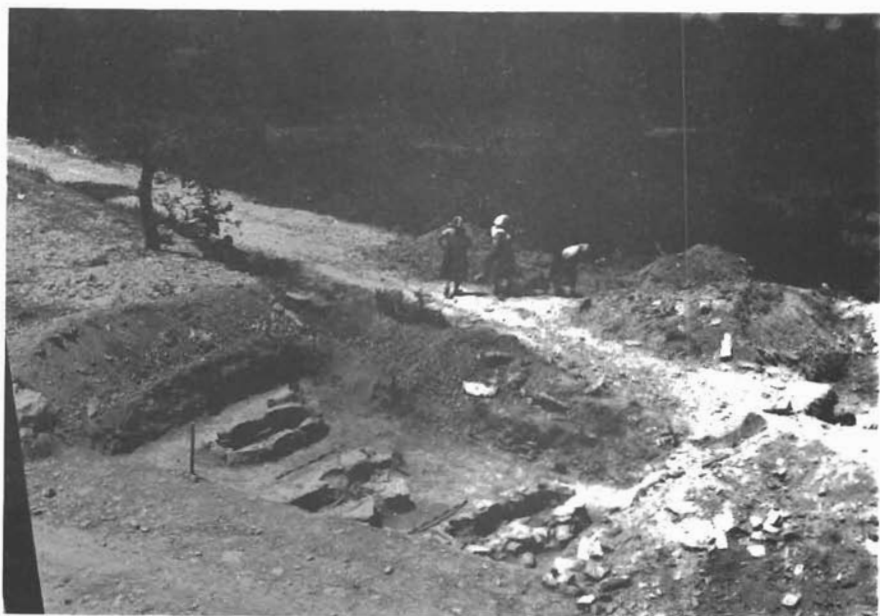
Sl. 2. Ostrovica, otkriveni grobovi na sektoru B nekropole Greblje. — Ostrovica, ausgegrabene Gräber auf Sektor B der Gräberfeldes Greblje