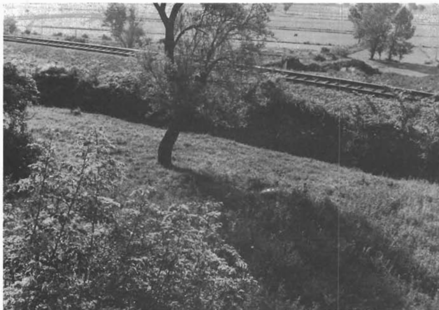
Sl. 5. Sopot, pogled na dio lokaliteta u podnožju Grubića glavice gdje je otkopana starohrvatska crkva. — Sopot, Blick auf einen Teil der Fundstelle am Fuße von Grubića Glavica, wo eine altkroatische Kirche ausgegraben wurde