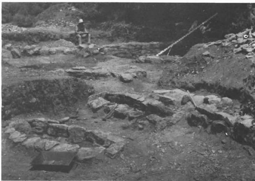
Sl. 4. Otres, otkriveni ostaci zidova i grobovi u sondi sjeverno od crkve. — Otres, ausgegrabene Reste von Mauern und Gräbern in der Sonde nördlich der Kirche