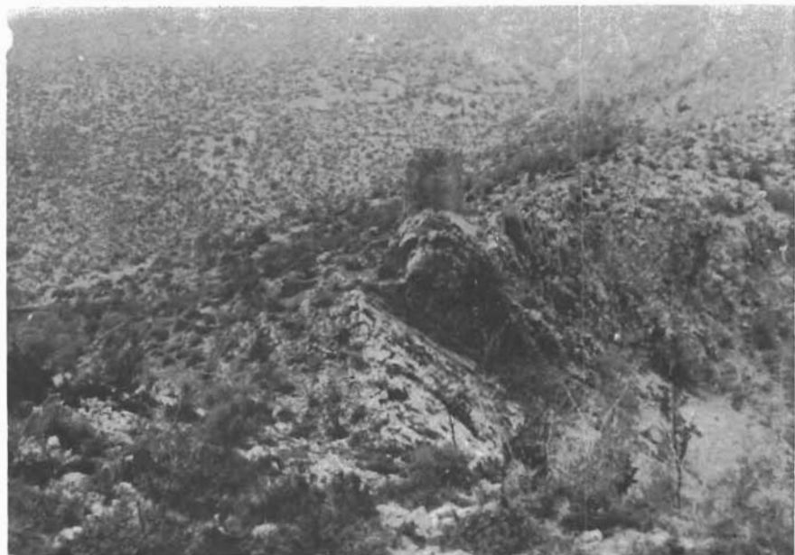
Sl. 9. Mokro Polje, pogled na srednjovjekovnu utvrdu Keglevića gradinu u kanjonu rijeke Zrmanje. — Mokro Polje, Blick auf die mittelalterliche Festung Keglevića Gradina im Cañon des Flusses Zrmanja