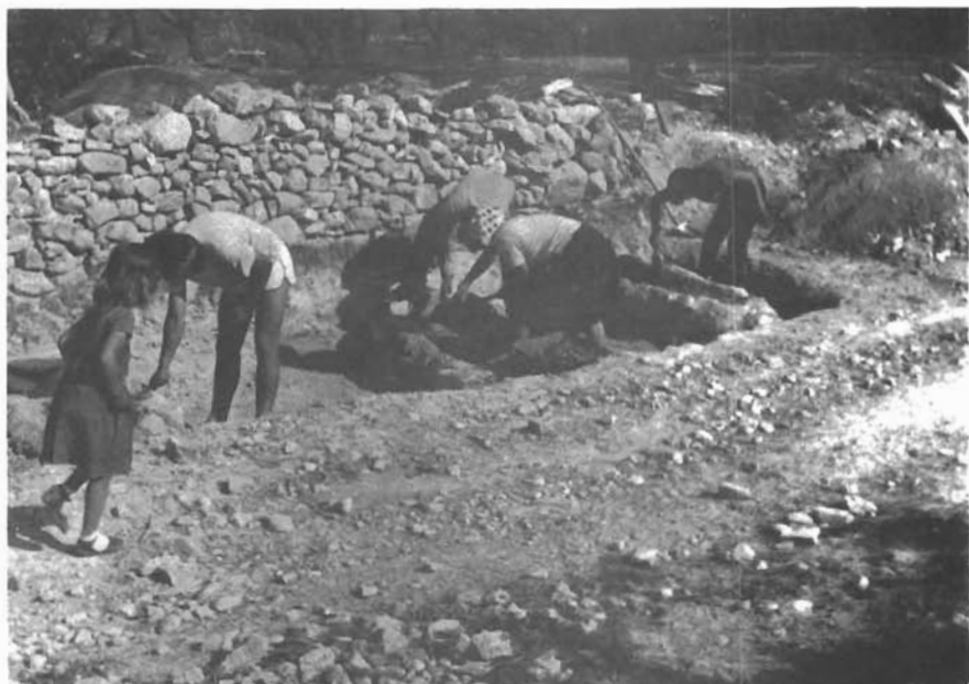
Sl. 1. Ostrovica, istraživanje grobova na sektoru A nekropole Greblje. — Ostrovica, Untersuchungen der Gräber auf Sektor A der Gräberfeldes Greblje