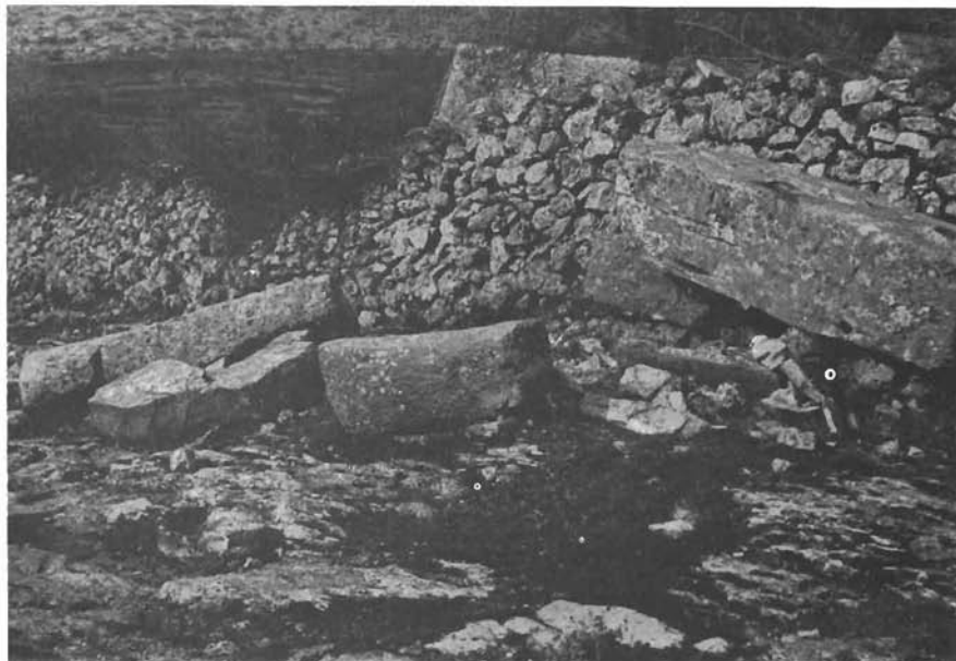
Sl. 12. Divojevići, stećci zapadno od Gromile. — Divojevići, Grabdenkmäler (stećci) westlich von Gromila