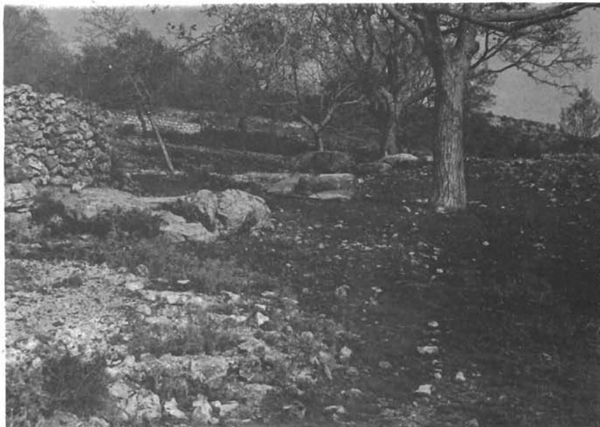
Sl. 11. Divojevići, pogled na Gromilu sa stećcima. — Divojevići, Blick auf Gromila mit Grabdenkmälern (stećci)