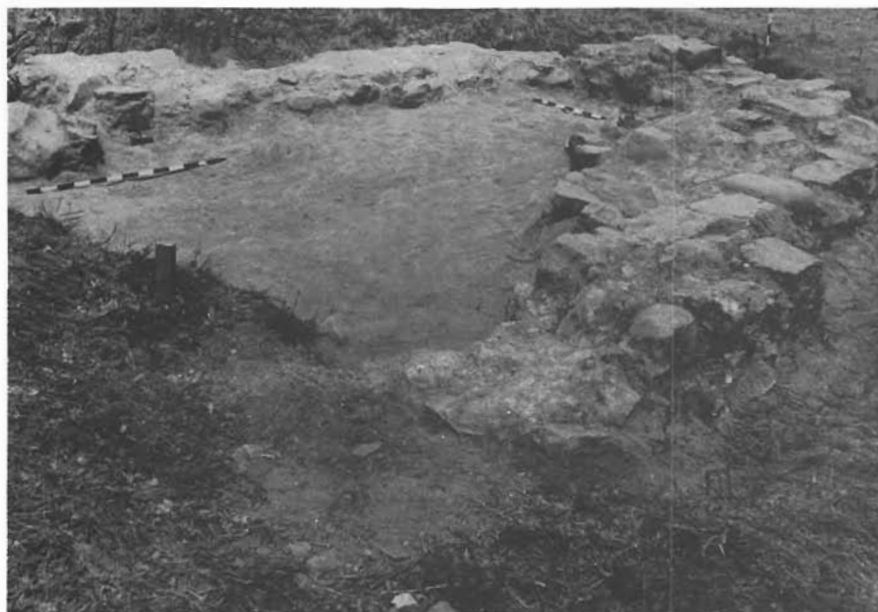
Sl. 6. Sopot, dijelom otkriveni temeljni ostaci starohrvatske crkve u podnožju Grubića Glavice. — Sopot, teilweise ausgegrabene Grundmauern einer altkroatischen Kirche am Fuße von Grubića Glavica