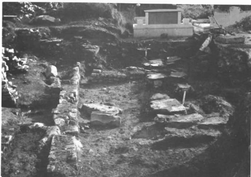
Sl. 8. Muć Gornji, otkriveni ostaci zidova i grobovi u sondi južno od crkve. — Muč Gornji, ausgegrabene Mauerreste und Gräber in der Sonde südlich der Kirche