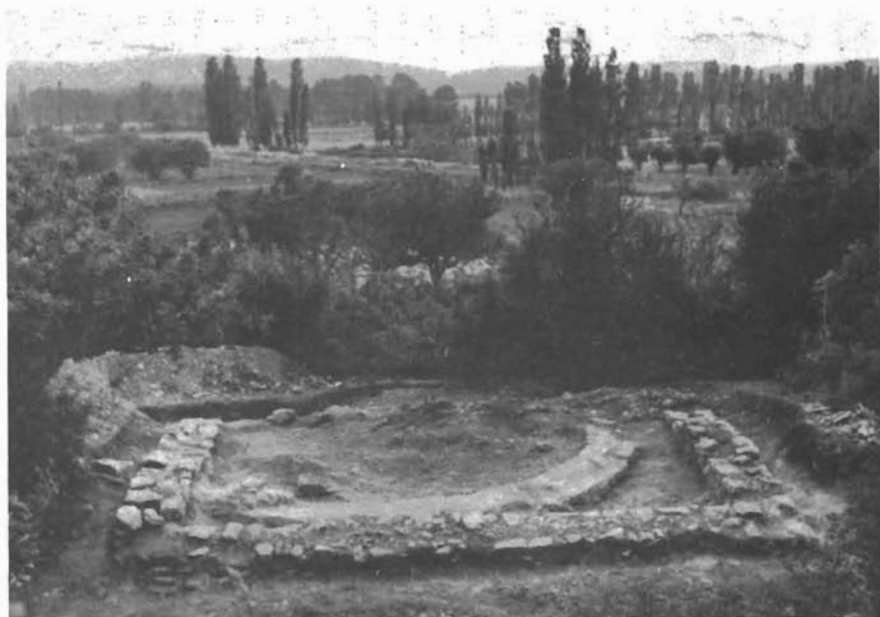
Sl. 3. Otres, otkriveni temelji srednjovjekovne kuće i dio antičke arhitekture (eksedre) u sondi zapadno od crkve. — Otres, ausgegrabene Grundmauern eines mittelalterlichen Hauses und Teil eines antiken Gebäudes (Exedra) in der Sonde