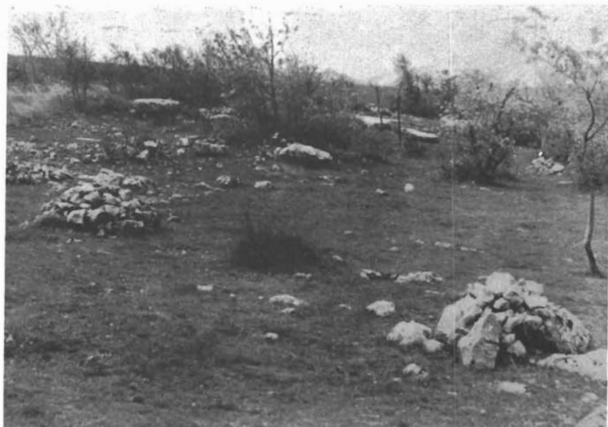
Sl. 10. Mokro Polje, pogled na nekropolu Crkvina u zaseoku Sučevići. — Mokro Polje, Blick auf des Gräberfeld Crkvina im Dorfe Sučevići