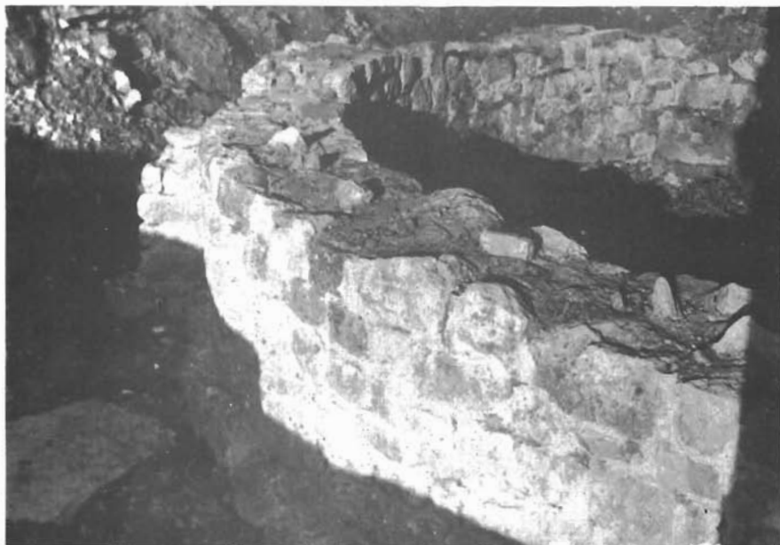
Sl. 7. Muć Gornji, dio otkrivene i konzervirane apside starohrvatskog sakralnog objekta. — Muč Gornji, Teil der ausgegrabenen und konservierten Apsis eines altkroatischen Sakralen Objektes