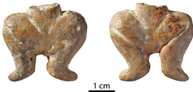
Slika 1. Neolitička figurica iz Pupićine peći