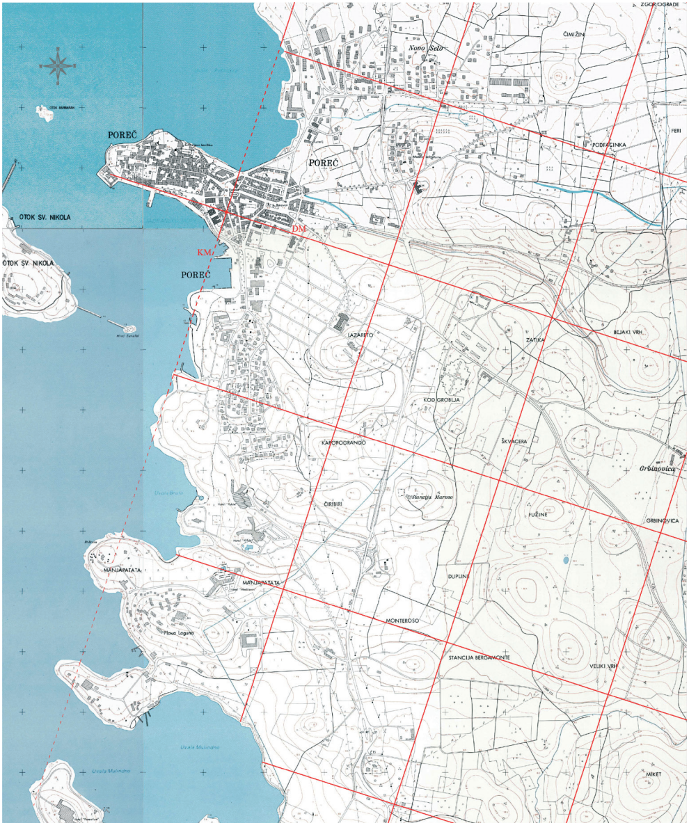
Slika 5. Rekonstrukcija centurijacije u okolici Parentija na Hrvatskoj osnovnoj karti Državne geodetske uprave RH (izradio D. Bulić).

kriterijima, osobito onim geomorfološke naravi, a s namjerom racionalnoga korištenja prostora. Fenomen orijentacije limita centurijacije prema karakteristikama terena dobro je vidljiv u Italjskoj VIII. regiji Emiliji, između Piacenze (Placentia) i Cesene (Caesena) . Ondje su limiti centuriranih zemljišta brojnih gradova usporedni s rijekama, koje se s Apenina slijevaju u Po, ili s cestom Via Aemilia (Regoli 1983: 98, 106-107).