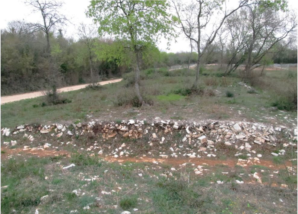
Slika 1. Limit kraj Batvači u zapadnom dijelu pulskog agera (fotografija D. Bulić, travanj 2012.)

( cardo maximus ) i istok – zapad ( decumanus maximus ), presijecala su se u ishodištu ( umbilicus ) koordinatnoga sustava, a zatim su se povlačenjem usporednih karda i dekumana oblikovale kvadratne ili pravokutne čestice ( centuriae ). Sačuvani limiti u obliku gomila kamenja i zemlje od kojih neki i danas imaju funkciju međe, ili se na mjestu njihova pružanja danas nalazi put ili cesta, predstavljaju polazišnu osnovu za rekonstrukciju centurijacijske mreže i interpretaciju njezine morfologije (sl. 1).