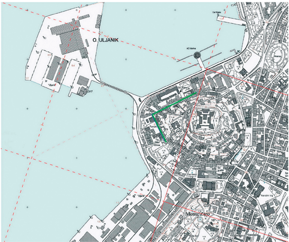
Slika 7. Međuodnos centurijacije i rimske planimetrije Pole (izradio D. Bulić). Podloga: Hrvatska osnovna karta Državne geodetske uprave RH.

tacije agera. Potvrdu ovoj tezi nalazimo u svojevrstnoj korelaciji simboličkoga umbilika i posvećenoga mjesta na gradskom forumu predviđenoga za štovanje službenoga državnog kulta, gdje se u idealnim teoretskim uvjetima trebalo nalaziti ishodište gradskoga i izvogradskoga rastera. Naime, centurija koja smještajem umbilika na otok Uljanik ima numeraciju sinistra decumanum I citra kardinem I , odnosno prva centurija s južne strane glavnoga dekumana i istočne glavnoga karda, limitima omeđuje prostor između otoka Uljanik i antičkoga grada, uključujući istočni dio otoka i zapadni dio Pole. Ako se projiciraju zamišljeni pravci okomito na limite ove centurije, odnosno na decumanus maximus udaljen \frac{3}{4} dužine centurije ili 15 akta od umbilika i okomito na cardo maximus udaljen \frac{1}{2} dužine centurije ili 10 akta od umbilika, dobiva se sjecište ovako postavljenih pravaca desetak metara ispred pročelja najstarijega, središnjega forumskog hrama (sl. 6). Nadalje, pravci pružanja današnje Kandlerove ulice, glavne komunikacije u donjem dijelu Pole, i uzdužne stranice Foruma zatvaraju pravi kut, a usporedni su s dijagonalama centurije što nedvojbeno potvrđuju prilagođavanje rimske planimetrije Pole rasteru centurijacije (sl. 7).