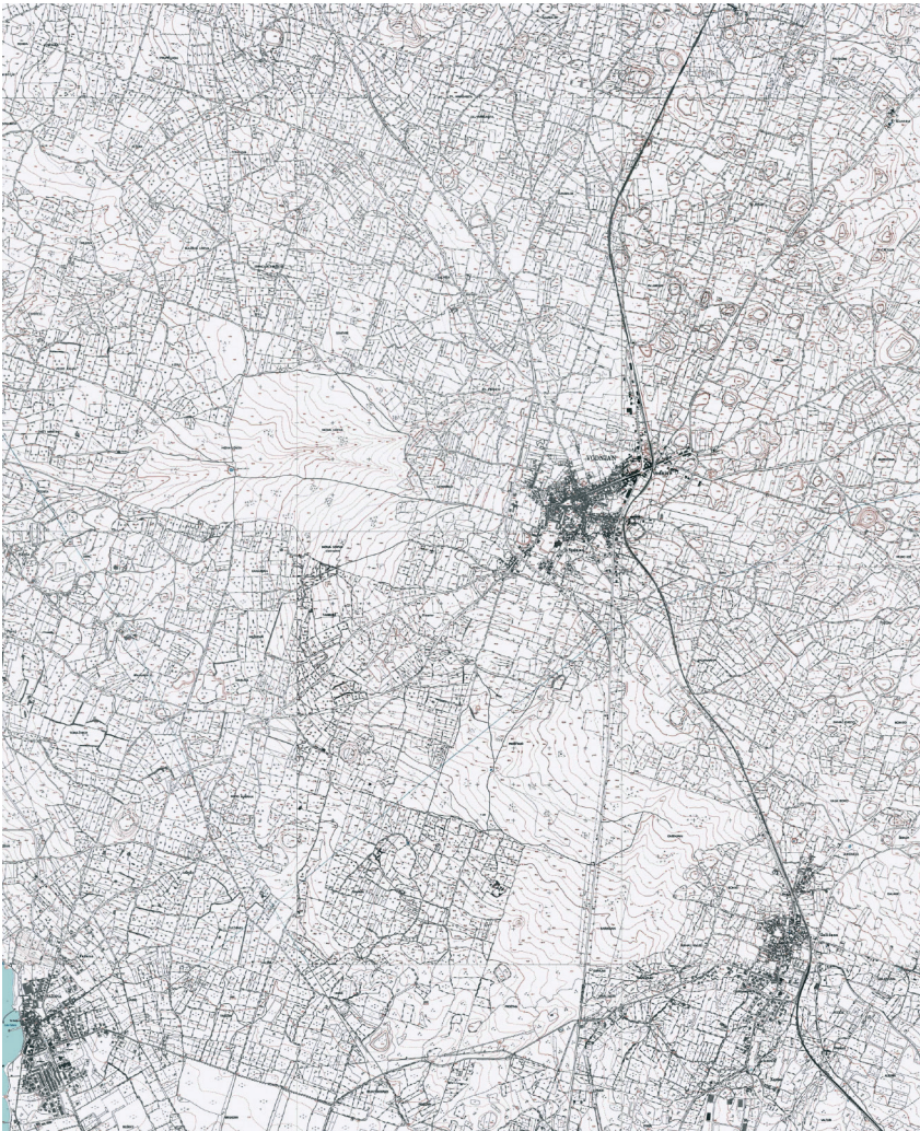
Slika 2. Ucrtani tragovi centurijacije na Hrvatskoj osnovnoj karti Državne geodetske uprave RH, južni dio pulskog agera.

jugera. Ortogonalna mreža rimske centurijacije danas prepoznatljiva u ostacima fosiliziranoga krajolika najbolje je sačuvana na jugozapadnom dijelu poluotoka, u široj okolici Vodnjana (sl. 2) 8 .