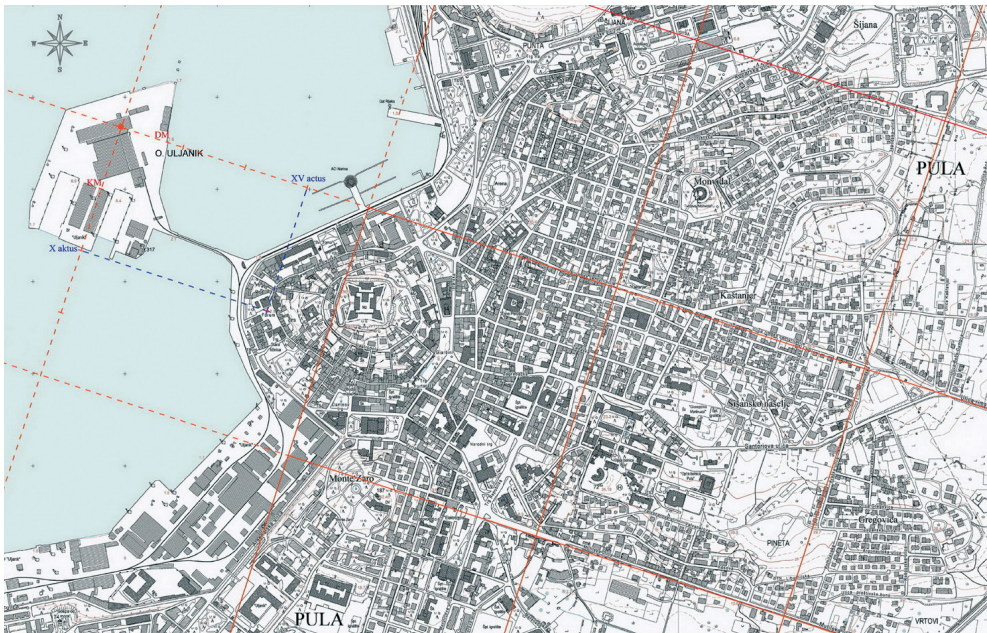
Slika 6. Rekonstrukcija centurijacije u okolici Pole na Hrvatskoj osnovnoj karti Državne geodetske uprave RH (izradio D. Bulić).

Poznato je da su rimska sklonost praktičnim rješenjima i različiti čimbenici, koji su se razlikovali u svakom konkretnom slučaju, često uvjetovali organizaciju gradskoga i izvangradskoga prostora u određenom neskladu s etruščanskim učenjem. Međutim, nebo i zemlja nastojali su se, koliko je to bilo moguće, organizirati prema jedinstvenom sustavu u kojem je orijentacija i podjela prostora imala istaknuti značaj, čemu u prilog idu i pisana svjedočanstva (Hygin. Grom. Const. lim. 131, 8-12; Iul. Front. De limit. 10, 20-21; 11, 9-10; Var. L. Lat. 5, 143). Smještajem umbilika na otok Uljanik u pulskoj luci ostvaruju se uvjeti prema kojima urbs Polae zauzima povoljan smještaj u projekciji nebeskoga svoda na zemlju, istočno, odnosno jugoistočno od nebeskoga kardina. U skladu s tim, vrlo mi se vjerojatno čini mišljenje da se umbilicus pulskoga agera nalazio na otoku Uljanik u pulskoj luci. Planimetrija Pole u donjem dijelu grada ( pars inferior urbis Pole ), između podnožja gradskoga brežuljka i morske obale, sasvim je sigurno oblikovana nakon limi-