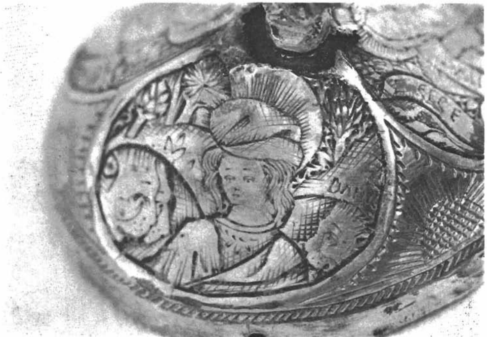
Sl. 3. Danijel ugraviran u moćnik. Dominikanska crkva u Trogiru