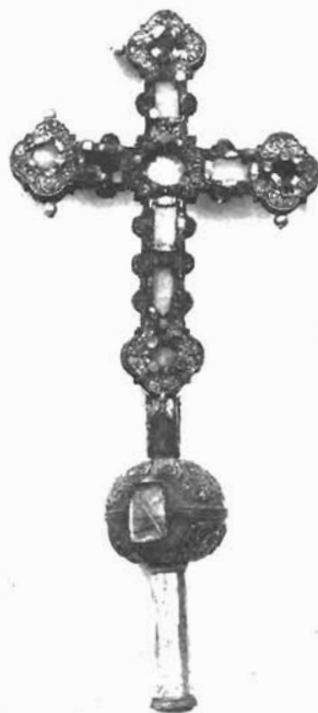
Sl. 7. Križ-moćnik. Dominikanska crkva u Trogiru