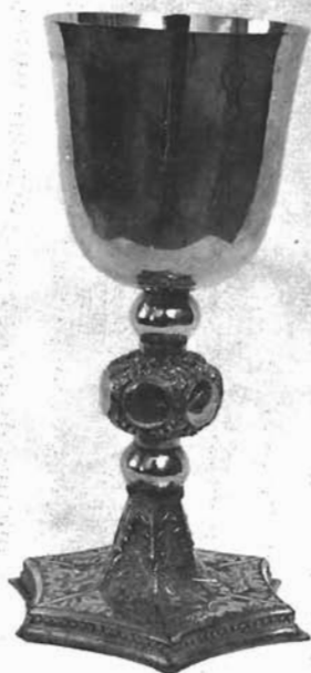
Sl. 10. Kalež. Dominikanska crkva u Trogiru

C. Fisković, Trogirski zlatari od 13. do 17. stoljeća