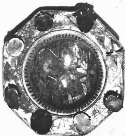
Sl. 11. Kopča plašta. Dominikanska crkva u Trogiru