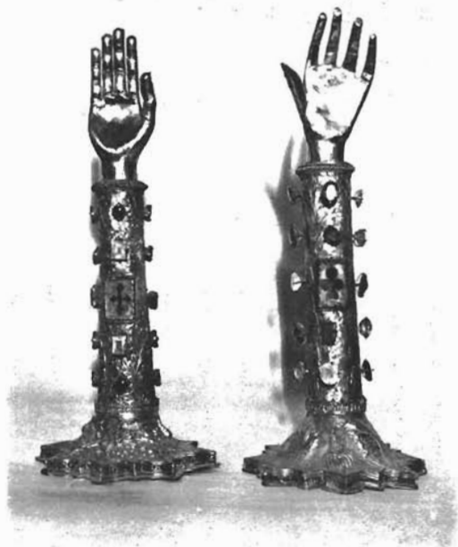
Sl. 9. Ruke-moćnici. Dominikanska crkva u Trogiru