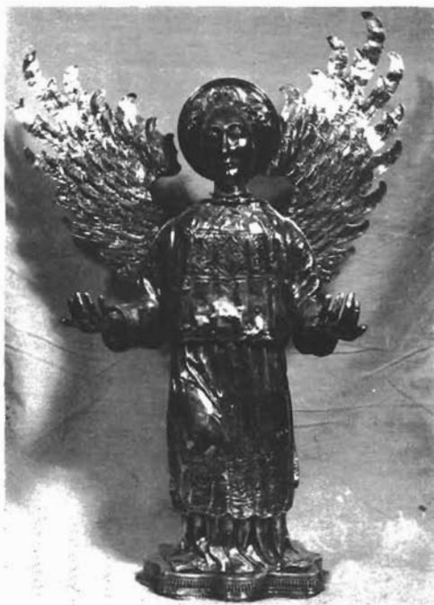
Sl. 15. Lik sv. Lovre preoblikovan u anđela. Stolna crkva u Trogiru