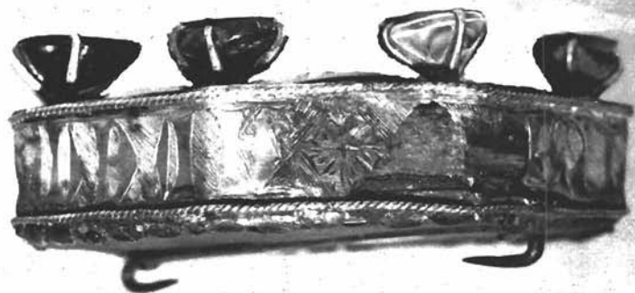
Sl. 12. Kopča plašta. Dominikanska crkva u Trogiru