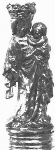
Sl. 5. Gospa sa sinom, vrh moćnika. Dominikanska crkva u Trogiru