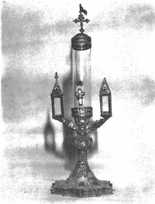
Sl. 2. Moćnik. Dominikanska crkva u Trogiru