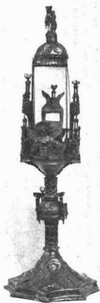
Sl. 4. Moćnik, Dominikanska crkva u Trogiru