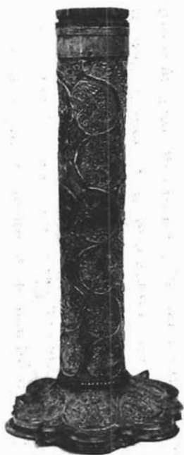
Sl. 8. Ruka-moćnik. Dominikanska crkva u Trogiru