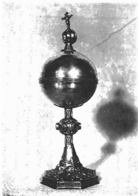
Sl. 14. Piksida (čestitčnjak). Stolna crkva u Trogiru