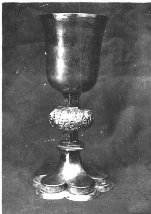
Sl. 13. Kalež. Stolna crkva u Trogiru