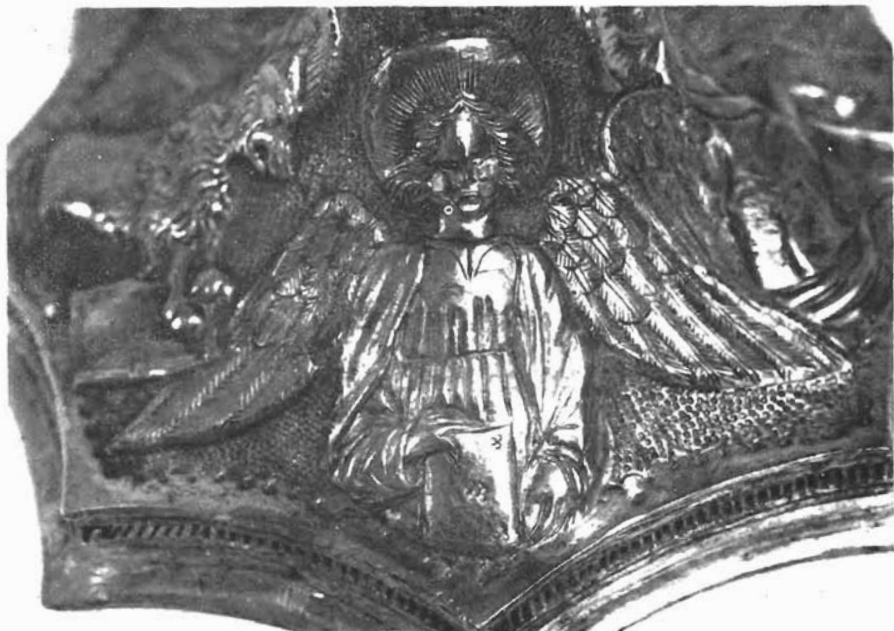
Sl. 6. Znamenje evanđelista na postolju moćnika. Dominikanska crkva u Trogiru