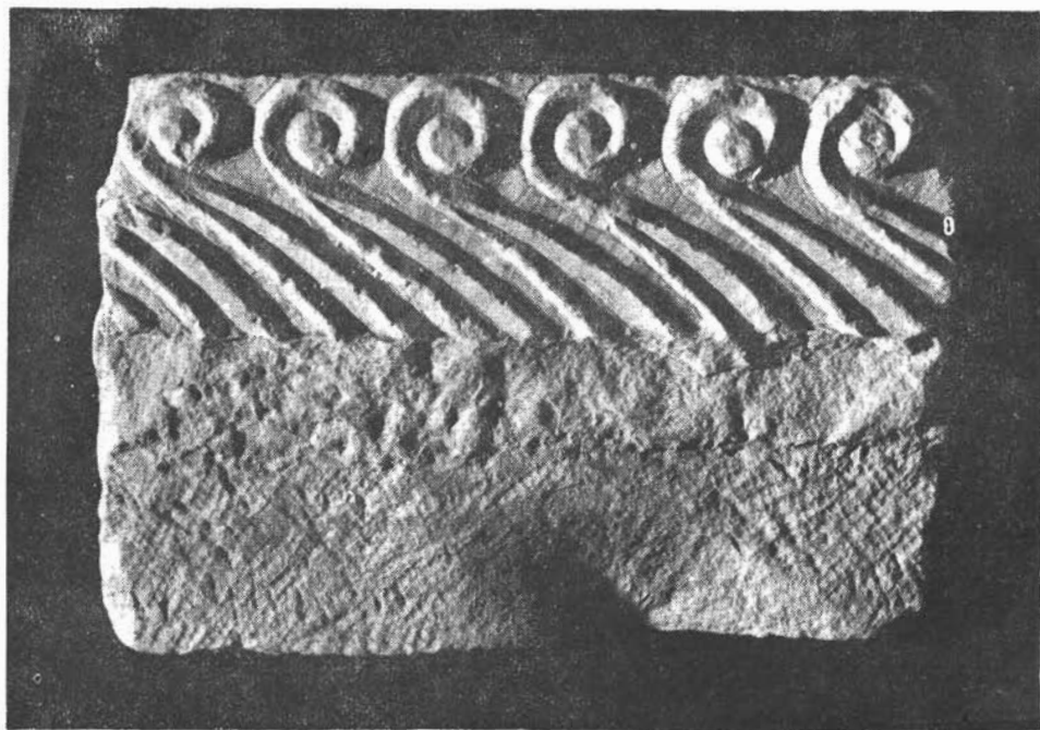
Sl. 5. Biskupija kod Knina, ulomak grede crkvene pregrade slučajno pronađen kod izvora Bukorovac