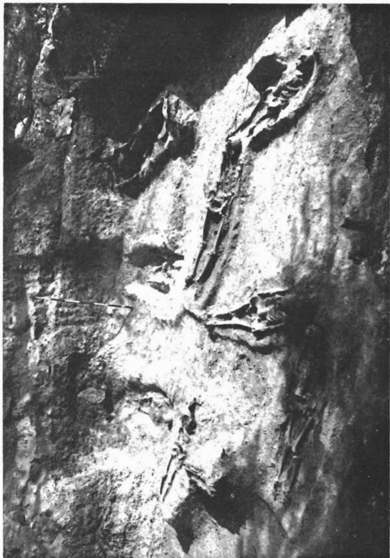
Sl. 2. Ostrovica, otkriveni grobovi na sektoru A nekropole Greblje