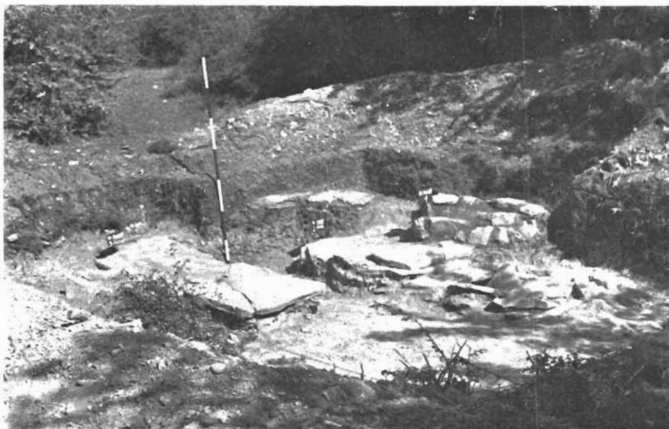
Sl. 4. Otres, otkriveni grobovi u sondi sjeverno od crkve