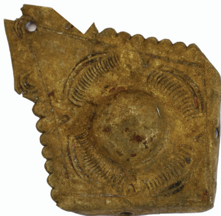
Slika 7.2. Benediktinska opatija sv. Mihočila na Rudini . Okov ugla korica knjige ukrašen cvjetnim motivom. Gradski muzej Požega, inv. broj 12.028.

Za ovu prigodu izdvajamo kao analogiju nalazu okova ugla knjige iz sv. Lovre primjerak pronađen u depou Gradskog muzeja u Požegi koji potječe s položaja Rudina (sl. 7. 1), 4 koji je identičan onom ranije objavljenom iz refektorija benediktinske opatije (Tomičić, 2009., str. 771, sl. 10. 2) 5 . Radi usporedbe, donosimo ga i ovom prigodom ilustriranog (sl. 7. 2). Riječ je u oba slučaja o okovima ukrašenim motivom četverolatičnog cvijeta u sredini kojega je umbilik, tj. kružno izbočenje. Uokolo cvjetnog motiva nalazi se trapezoidni obrub koji na duljim stranama omeđuju nizovi polukružnih izbočenja. Na kraćim bočnim stranicama obruba