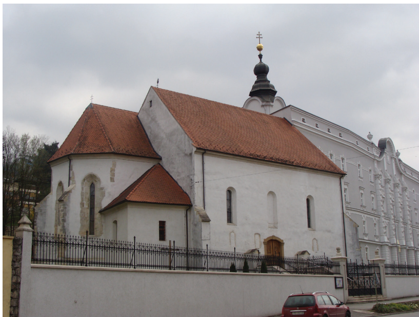
Slika 1. Požege, pogled na crkvu sv. Lovre.

U ovom kratkom prinosu obilježavanju 800. obljetnice Požeško-slavonske županije svu smo svoju pozornost usmjerili na nekolicinu zanimljivih primjeraka vrlo rijetkih pokretnih nalaza koji bacaju snažnu zraku svjetlosti na duhovnu sastavnicu kasnoga srednjovjekovlja u promatranom dijelu Slavonije. Riječ je o sitnim kovinskim nalazima, točnije o ukrašenim okovima uglova korica knjiga koji su otkriveni prigodom sustavnih arheološko-konzervatorskih istraživanja, kako u duhovnom središtu grada Požege, unutar crkve sv. Lovre (sl. 1), tako i u njegovoj široj okolici, za sada, još na samo jednom položaju podno južnih padina Psunja – na Rudini zapadno od Požege (sl. 2).