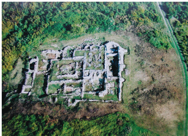
Slika 2. Pogled iz zraka na spomenički kompleks benediktinske opatije sv. Mihovila Arkandela na položaju Rudina .

U unutrašnjosti crkve sv. Lovre u središtu Požege, podno njezina Staroga grada , tijekom opsežnih i dugotrajnih arheološko-konzervatorskih istraživanja otkrivena je 1988. godine, unutar zidane grobnice, skupina zanimljivih pokretnih nalaza (sl. 3)