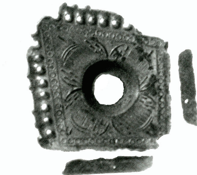
Slika 4. Požega, sv. Lovro. Oštećeni brončani okov ugla korica knjige. Snimio B. Kladarin – povećanje Katarina Botić.

(Srša, Šaban, Kučinac, 1992., sl. 76). Pokraj ulomaka pećnjaka, kovinskog dvostrukog križića ( crux gemina ), željeznih čavala i dijelova upletenog lančića, ostataka tekstila i četiriju kalupa za lijevanje određenih predmeta, u toj se skupini prepoznaje izuzetno rijedak, ponešto oštećen primjerak, vjerojatno brončanog, okova ugla korica neke kasnosrednjovjekovne knjige (sl. 4). 1