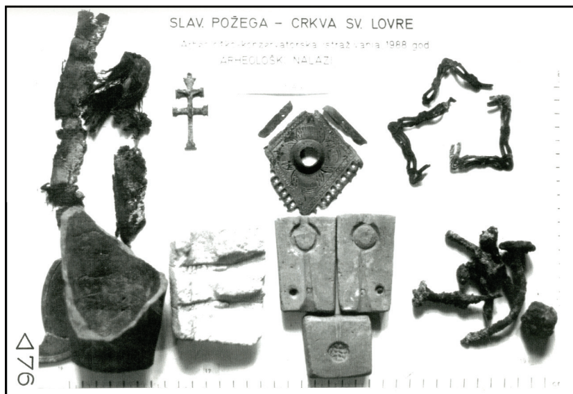
Slika 3. Požega, sv. Lovro. Skupina pokretnih nalaza iz zidane grobnice u crkvi.

U unutrašnjosti crkve sv. Lovre u središtu Požege, podno njezina Staroga grada , tijekom opsežnih i dugotrajnih arheološko-konzervatorskih istraživanja otkrivena je 1988. godine, unutar zidane grobnice, skupina zanimljivih pokretnih nalaza (sl. 3)