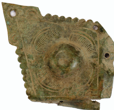
Slika 7.1. Benediktinska opatija sv. Mihočila na Rudini . Okov ugla korica knjige ukrašen cvjetnim motivom. Gradski muzej Požega; inv. broj 14.319.

okova vidljive su rupe za čavlice kojima se kovinski ugao knjige pričvršćivao za drvenu plohu naslovnice. Konačno, iz oba rudinska primjerka okova strše neukrašeni trokutasti završetci koji su se učvršćivali čavlicima za plohu naslovnice knjige. Primjerci okova s cvjetnim ukrasima pokazuju identičnost koja nas uvjerava kako je riječ o njihovom korištenju za ukrašavanje iste knjige koja je bila u uporabi u rudinskoj opatiji sv. Mihočila. Cvjetni motiv na okovu pronađenom u sv. Lovri u Požegi svojim dodatnim perforiranim ukrasima na duljim bočnim stranicama dokazuje ipak višu umjetničko-obrtnu razinu u odnosu na rudinske primjerke.