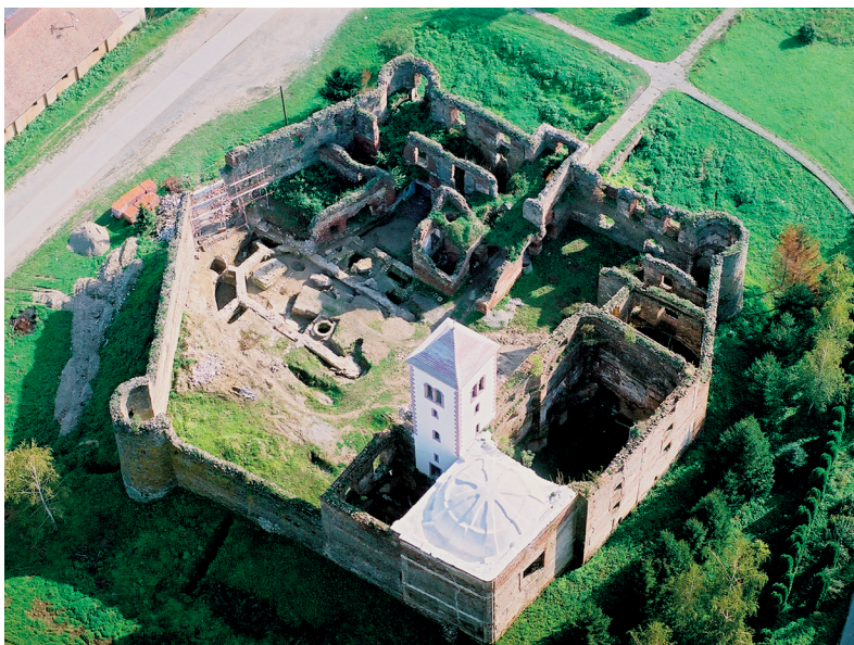
Slika 2. Kaptol sv. Petra u Kaptolu

Srednjovjekovna keramika i tragovi arhitekture iz kasnijih razdoblja pronalaze se na nizu lokaliteta, što svjedoči o gustom naseljenosti Požeške kotline u spomenutom razdoblju. Jedan od rijetkih sustavno istraživanih lokaliteta i svakako najvažniji poznati srednjovjekovni lokalitet na navedenom prostoru jest Rudina, koja se u pisanim izvorima spominje još od početka 13. stoljeća, iako vjerojatno ima i antičke korijene. Na tom lokalitetu goleme važnosti, o čemu će nešto više riječi biti kasnije, nalaze se ostaci benediktinske opatije i crkve sv. Mihovila gdje su, između ostalog, pronađeni izuzetni primjerci romaničke figuralne kamene plastike (Sokač-Štimac, 1997.).