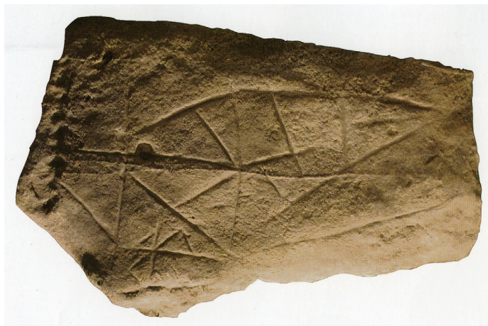
Slika 1. Prikaz ribe na pokrovnoj ploči groba – Rudina

Jedini relativno siguran trag ranog kršćanstva na prostoru Požeške kotline jest kamena ploča s urezanim ribom (sl. 1) iz groba muškarca pronađenog u sklopu romaničke crkve sv. Mihovila na Rudini (Migotti, 2009., 134), koji se datira na početak 4. stoljeća. Prikaz ribe bio je s donje strane ploče koja je stajala iznad glave pokojnika. Postojanje mnoštva kasnoantičkih i srednjovjekovnih lokaliteta na ovom prostoru navodi na zaključak da je pronalazak novih ranokršćanskih nalaza samo pitanje vremena.