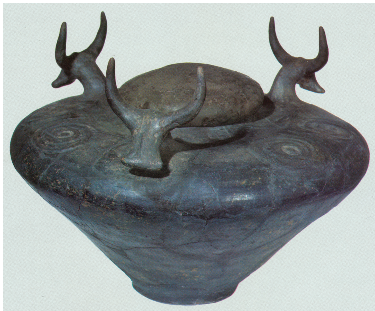
Slika 9. Lonac s bikovskim glavama – tumul 10 – Kaptol-Gradci

Kaptolski kneževi čiji su bogati grobovi pronađeni pod tumulima IV i X (sl. 8) na Čemernici i tumulu 6 na položaju Gradci bili su prije svega ratnici. Njihova moć i bogatstvo odražavalo se i na njihovu oružju. Puna oprema ratnika sastoji se od 2 – 3 željezna koplja, bojnih sjekira, noža i konjske opreme, ali najvažniji su nalazi primjerci obrambenog naoružanja. Osim zaštitne prsne ploče koja vjerojatno dolazi iz srednje Italije, svi ostali primjerci grčkog su porijekla: grčko-ilirska kaciga, korint-ska kaciga i par knemida. Važnost i bogatstvo središta u Kaptolu i njegovu iznimnu vrijednost u europskim okvirima najbolje ilustrira činjenica da je riječ o daleko naj-sjevernijim primjercima spomenutih tipova u Europi. U opremi muškarca možemo također zapaziti igle, pojase i brusove, dok opremi ženskoga groba pripadaju fibule, saltaleoni, pribor za tkanje. Odmah upada u oči da mnogo predmeta upravo u Kap-tolu doseže svoje najdalje točke rasprostiranja u europskim okvirima poput različ- itih tipova fibula ili bojnih sjekira!