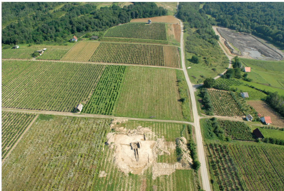
Slika 11. Grobna komora s dromosom – tumul III – Kaptol-Čemernica

prilaznim ritualnim hodnikom (dromosom) dužine oko 8 m (sl. 11). Takve konstrukcije bile su rezervirane samo za najveće uglednike onog vremena, o čemu najbolje svjedoči činjenica da za sada poznajemo manje od deset ovakvih primjera, a ovo je najbolje sačuvani spomenik te vrste do sada otkriven u Europi.