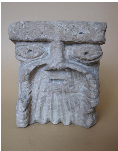
Slika 5. Rudinska glava 1