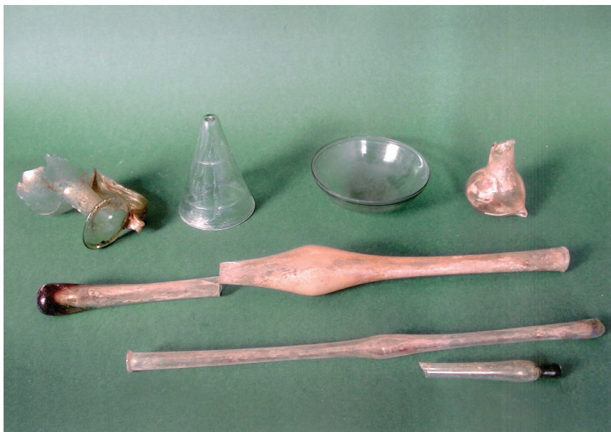
Slika 7. Izbor staklenih nalaza iz nekropole kod Tekića