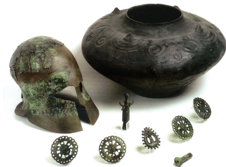
Slika 8. Izbor nalaza iz kneževskoga groba – tumul X – Kaptol-Čemernica

Iznimna ljepota i rijetkost materijala pronađenog u kneževskim grobovima jasno je ukazivala na europsku važnost toga nalazišta u toj mjeri da je Kaptol dao ime čitavoj kulturi starijega željeznog doba koja se rasprostire u Međurječju ali zahvaća i dijelove Štajerske.