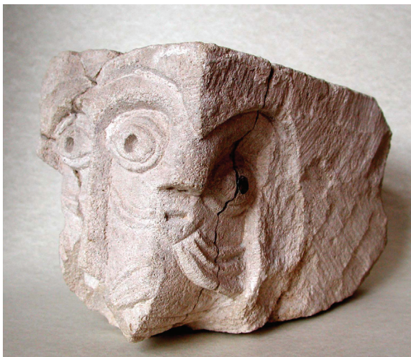
Slika 6. Rudinska glava 2

Romanička plastika u formi svjetski poznatih rudinskih glava (sl. 5 i 6) i fantastične freske kojima je crkva bila oslikana izvrsno ilustriraju generalnu razinu vizualne komunikacije. U vremenu i prostoru kada zanemariv dio pučanstva može komunicirati pismom ovakvi prikazi služili su kao vizualizacija vjerskih i drugih