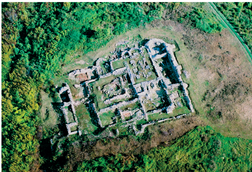
Slika 3. Ostaci crkve i samostanskog kompleksa – Rudina

stojanje neke antičke arhitekture na mjestu ili u blizini rudinskog samostana, možemo li pretpostaviti da je na tome mjestu još u antičko vrijeme stajala neka sakralna građevina? Stanje istraživanja, nažalost, ne omogućuje nikakav konkretan temelj za takvu pretpostavku, međutim pronalazak već spomenute grobne ploče s motivom ribe svakako upućuje na to da bi vrijedilo razraditi i provjeriti takvu hipotezu.