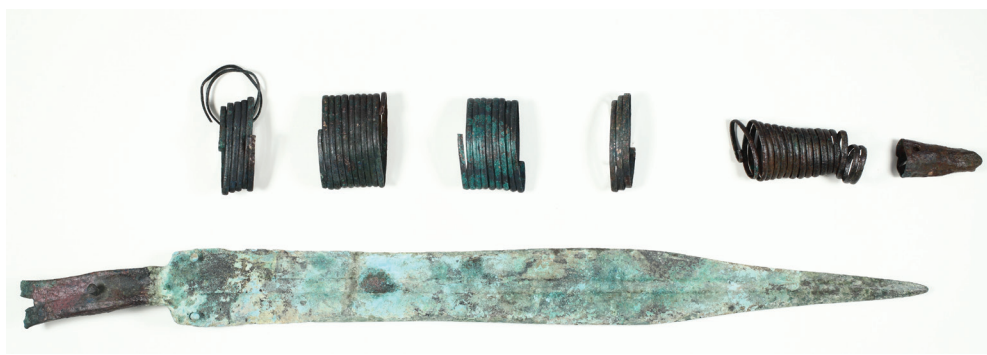
Slika 10. Brončani mač iz dvojnoga kneževskog groba – tumul 6 – Kaptol-Gradci

čini izuzetnim umjetničkim ostvarenjem. Pseudokernos je kulturna posuda s više manjih posuda na tijelu jedne veće. U Kaptolu je pronađen jedan od petnaestak do sada poznatih primjeraka tog tipa posuda na tlu Europe, ali isto tako ima jedinstven oblik i način ukrašavanja. Tronošci imaju mnoštvo referenci u svijetu grčke i etruščanske religije, ali su ovdje prihvaćeni i transformirani u keramičku formu koja odražava autohtono kulturno ozračje. Svakako najpoznatija i daleko najljepša forma koju nalazimo u Kaptolu jesu lonci ukrašeni bikovskim glavama (sl. 9). Takve posude nalazimo na tek nekoliko mjesta u središnjoj Europi, ali su u Kaptolu postigle svoju najljepšu i najrazvijeniju formu. Većina finih posuda prevučena je sjajnim slojem grafita, što im daje poseban metalni sjaj. Vjerojatno je upravo rudnik grafita koji se iskorištavao još do sredine 20. stoljeća predstavljao jedan od važnih temelja bogatstva i moći kaptolskih kneževa.