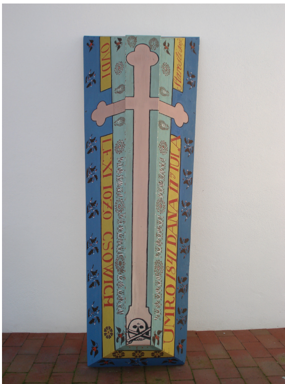
Prilog 5. Restaurirani poklopac bogato dekoriranog lijesa pokojnog Joze Čovića († 1841.)

ili više njih, uz izuzetak nekoliko lijesova tamnijeg kolorita. Boje osim dekorativne svrhe imaju i simboličko značenje (bijela – nevinost; plava – mir, tuga; žuta – Egipćani su je rabili prilikom žalovanja, u srednjem vijeku ona je simbol smrti itd.). Svaki je lijes imao naslikan križ na gornjoj stranici poklopca, pri čemu su se lijevi i desni krak križa nastavljali na bočne stranice poklopca. Križ je u pravilu bio trolistan (rijetko latinski) pružajući se u većini slučajeva cijelom dužinom gornje stranice, a na dnu je obično imao bazu. Neki su lijesovi iz ove skupine na uglovima bili profilirani ili su imali nožice, ponegdje s kožnim remenima u donjem dijelu sanduka, a služili su za nošenje lijesa. Vrlo su zanimljivi primjeri lijesova koji su u križištu naslikanog križa umjesto uobičajenog monograma I H S imali