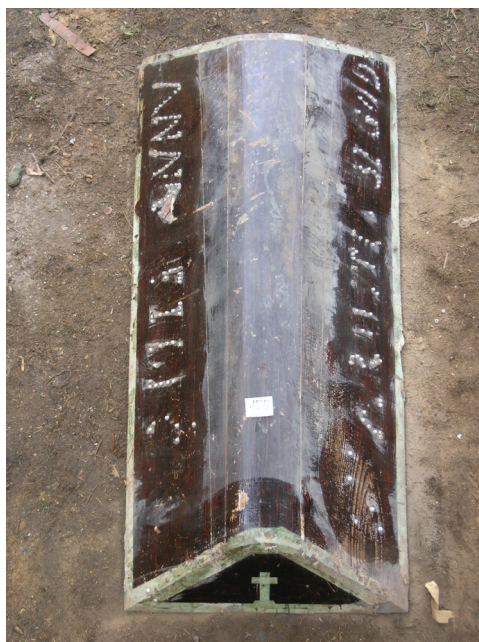
Prilog 7. Primjer lijesa izrađenog od hrastovog drveta, „sedlaste“ forme s natpisom od dekorativnih čavlića