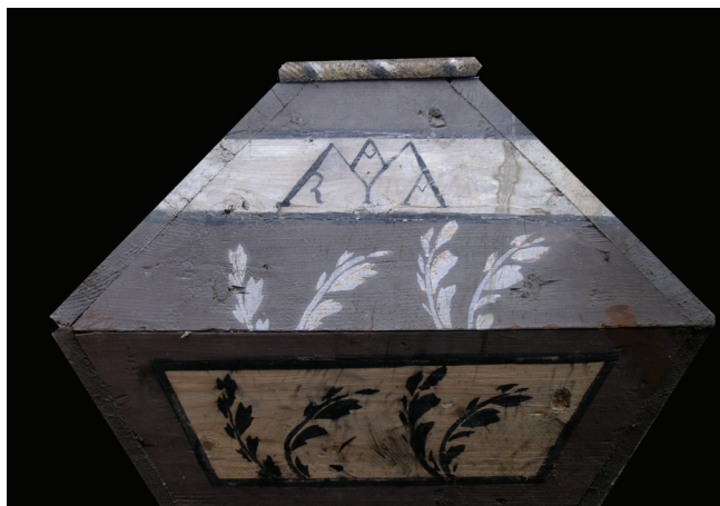
Prilog 9. Primjer vegetabilne dekoracije i Marijinog monograma

Jedan od najzanimljivijih motiva, a u kojemu se najdublje ocrtava kolektivno poimanje smrti jest motiv lubanje . On se javlja gotovo na svakom lijesu, u dnu križa, na bočnim stranicama lijesa ili na podnožnoj stranici, kao samostalna figura ili u kombinaciji s prekriženim kostima. Lubanja je simbol prolaznosti zemaljskog