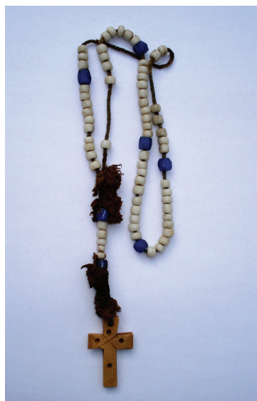
Prilog 11. Krunica

Raznovrsnost, raznolikost motiva i način obrade predmeta ukazuju na to da je riječ o masovnoj proizvodnji koja se odvijala u različitim europskim manufakturama. Jednostavniji i manji križevi možda su nastali u domaćim radionicama, no o tome za sada nemamo podataka. Na reversu i aversu medaljica prikazani su, osim grafičkih simbola poput križa, pokaznice s Kristovim monogramom, likovi svetaca te prizori iz njihova života. Na jednoj je medaljici primjerice prikazan sv. Franjo Ksaverski kao isusovac misionar s križem u ruci u borbi protiv zmaja, odnosno kako sam umire u nekoj kolibici na pustom otoku. Osim što je zaštitnik misija, misionara i brodara, sv. Franju Ksaverskog zaziva se i protiv kužnih bolesti (Ivančević, 1990.). Zanimljiv nalaz, pronađen na podu neposredno uz probijeni ulaz, bio je krizmarij – posuda u kojoj se čuvalo ulje (lat. Chrismarium ili chrisatorium , prema grč. khrisma , (po)mazanje). Obično se sastoji od tri cilindrične posude