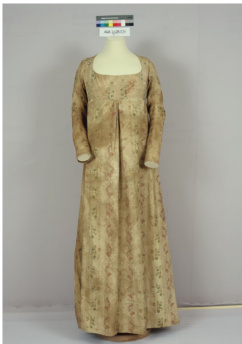
Prilog 13. Restaurirana haljina pokojne Ane Ljubić († 1809.)