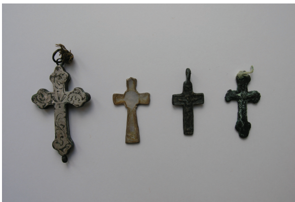
Prilog 12. Križići s raspadnutih krunica

s poklopcem i ugraviranim slovom koje označava sadržaj ulja (O, I i C). Pronađeni krizmarij iz kripte datira iz 1717. godine, a sastoji se od plitice na kojoj su dvije cilindrične posudice s poklopcem (jedna šira i jedna uža). Obje posudice nalaze se na malim „postoljima“, na jednom je ugraviran plosnat križ s Kristovim monogramom, a na drugom je također plosnat križ ispod kojeg su slova O i I. Slovo