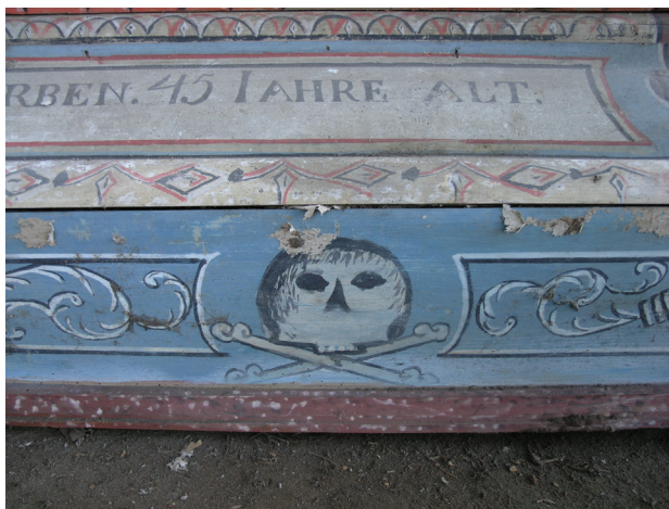
Prilog 10. Motiv lubanje s prekrizanim kostima na bočnoj stranici lijesa

života i podsjetnik ispraznosti zemaljskih stvari. Kada se nađu na jednome mjestu lubanja i raspelo, znak je to razmišljanja o vječnom životu nakon smrti. Lubanja s prekrizanim kostima u samom podnožju križa označava smisao imena „Golgota“, što znači „lubanja“, prema legendi koja govori o tome da je Kristov križ bio podignut na mjestu Adamova groba (Ivančević, 1990., str. 385). Od 16. st. jezovite predstave gube svoj dramatičan naboj i postaju banalne. Prikaz leša zamijenjen je kosturom koji se dijeli na veći broj manjih elemenata – lubanju, kosti. U 17. i 18. st. javlja se osjećaj ništavila, daleko od bolne žalosti za životom (Aries, 1989., str. 120).