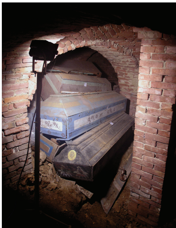
Prilog 4. Pogled na lijesove prilikom prvog ulaska u kripta

pokojnika. Takav oblik lijesa koji podsjeća na „kuću“ predstavlja postupan prelazak iz „uređenog svijeta“ – kuće u „neuređeni, nepoznati svijet“ – smrt. Veći dio lijesova zatečen je u izrazito derutnom stanju, najčešće raspadnutog donjeg dijela s potpuno ili djelomično sačuvanim poklopcem. Manji je broj lijesova s unutarnje strane ruba podnožne stranice imao čavlicima pričvršćenu tanku koprenu, til, kojom se prekrivao pokojnik. Svi lijesovi bili su ispunjeni hoblovinom na koju se stavljalo tijelo pokojnika. U predjelu glave hoblovine je bilo više, jer se njome formiralo uzglavlje, a u nekim slučajevima bilo je prekriveno i grubljom tkaninom. Uz hoblovinu, u nekim lijesovima, najviše svećeničkim, pronađene su i ljuske oraha i lješnjaka te koštice kao simboli nade u vječni život. Prema vrsti, osliku i obradi materijala, lijesove smo podijelili u tri osnovne grupe: obojeni (oslikani) lijesovi, lijesovi s natpisom od dekorativnih čavlića i lijesovi od hrastova drva.