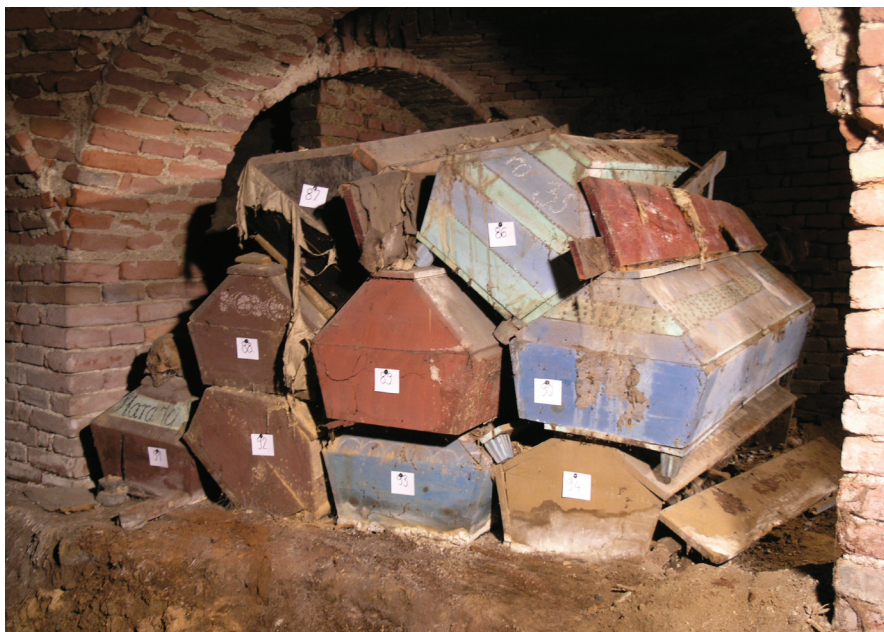
Prilog 3. Pogled na numerirane, poslagane lijesove in situ

se napravilo mjesta za ukop novih. Tome u prilog govori činjenica da su se tijekom reguliranja nivoa kripte pronašle tri ukopne „jame“, ostijariji, u koje su se odlagale kosti pokojnika umrlih tijekom 18. stoljeća.