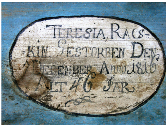
Prilog 6. Natpis u kartuši na bočnoj strani poklopca lijesa

Ovoj grupi pripada svega nekoliko lijesova, a karakterizira ih masivnost, velike dimenzije i jednostavnost, te se po svom obliku razlikuju od ostalih. Gornja je stranica tih lijesova zaobljenija, njeni se rubovi spajaju s bočnim, ukošenim stranicama te svojom formom imitiraju krov kuće. Obično su bili lakirani, s natpisom od čavlića na bočnim stranicama, kao što je bio slučaj s drugom grupom spomenu-