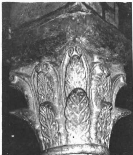
Sl. 7. Katedrala u Rabu, kapitel