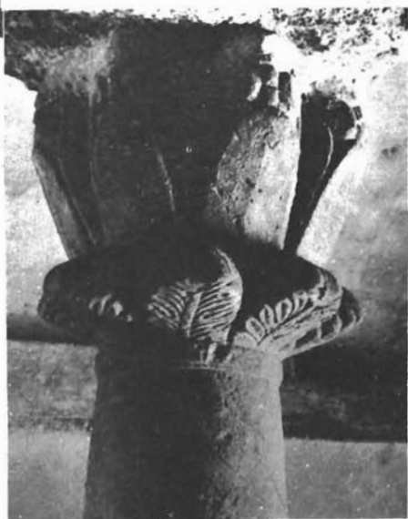
Sl. 23. Sv. Nikola u Splitu, kapitel