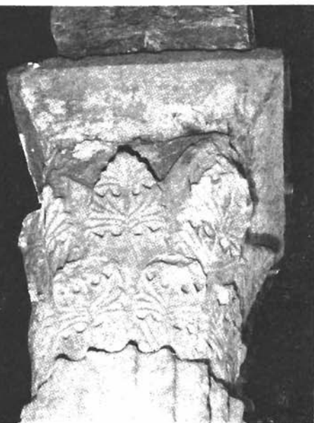
Sl. 6. Sv. Mihovil na Krku, kapitel