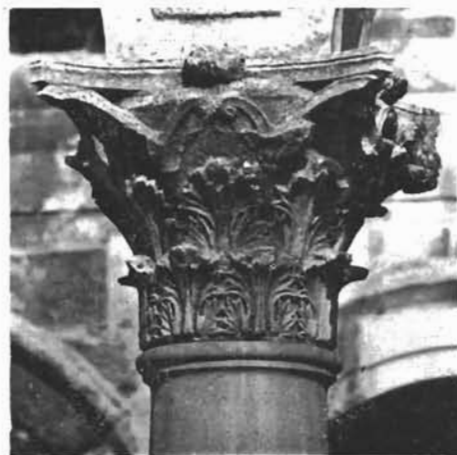
Sl. 1. Kapitel s Peristila u Splitu