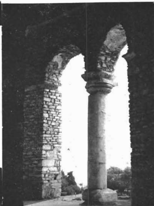
Sl. 3. Sv. Petar u Drazi. Primjer prvog para kapitela u crkvi