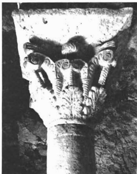
Sl. 20. Sv. Lovro u Zadru, kapitel