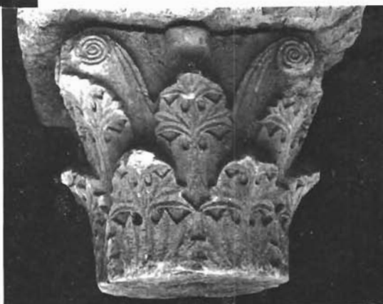
Sl. 8. Sv. Ivan u Rabu, kapitel