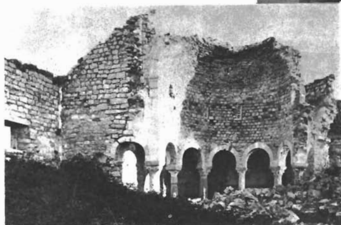
Sl. 24. Deambulatorij Sv. Ivana u Rabu