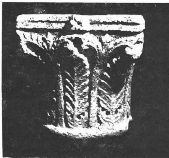
Sl. 15. Sv. Marija u Ninu, ka- pitol (Arheološka zbirka)