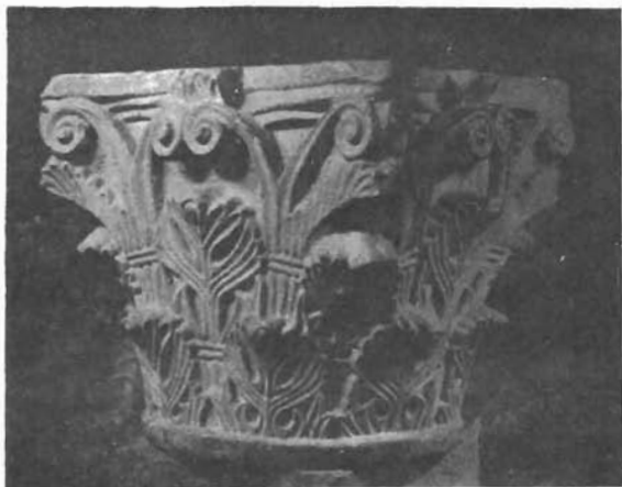
Sl. 10. Aquileia, kapitel Po- poneove bazilike