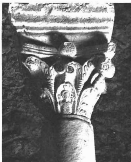
Sl. 18. Sv. Barbara u Privlaci, kapi- tel (Arheološki muzej Zadar)