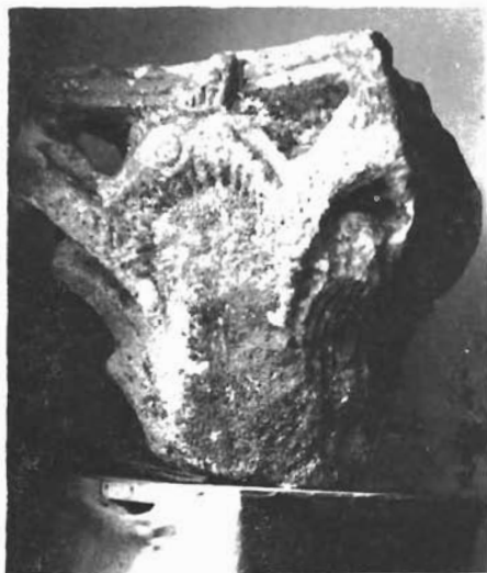
Sl. 19. Kapitel izvađen iz mora (Arheološka zbirka u Ninu)