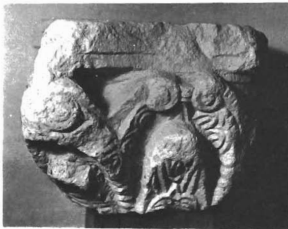
Sl. 21. Kapitel preklesan u škropionicu, Arheološka zbirka u Ninu