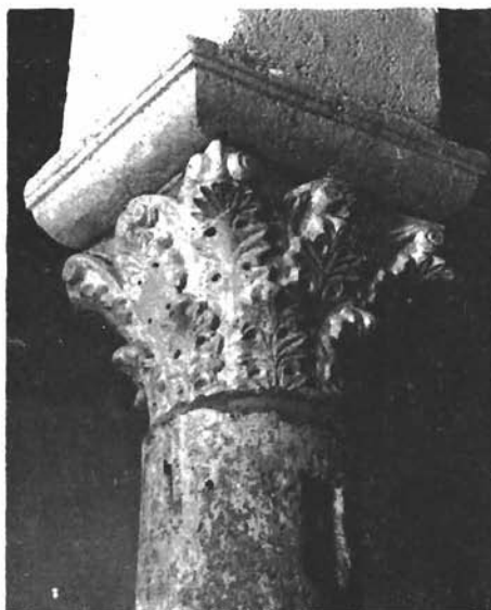
Sl. 4. Sv. Petar u Drazi. Primjer trećeg para kapitela u crkvi