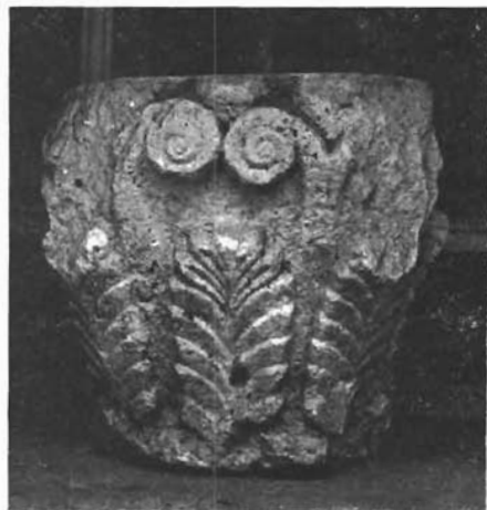
Sl. 14. Općinska zbirka u Rabu, kapitel