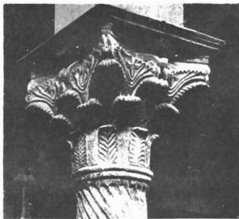
Sl. 22. Sv. Stošija u Zadru, kapitel