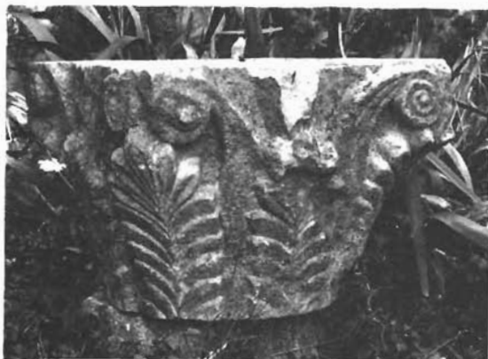
Sl. 13. Sv. Ivan u Rabu, kapitel