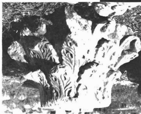
Sl. 9. Sv. Marija Velika u Zadru, kapitel