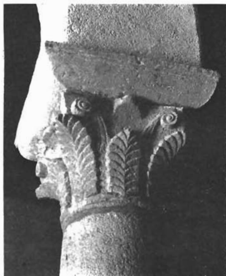
Sl. 12. Sv. Justina u Rabu, kapitel