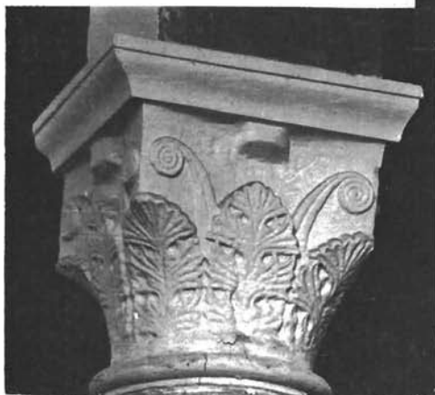
Sl. 5. Sv. Marija u Zadru, kapitel