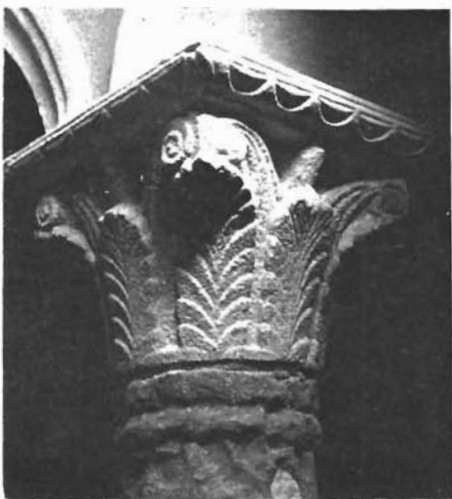
Sl. 11. Sv. Petar u Drazi, kapitel