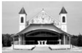
Zavjetna kapela u Ludbregu

Hrvatski je sabor 1996. godine izgradio Zavjetnu kapelu u čast štovanja Predragocjene Krvi Kristove. Svake godine, prve nedjelje u mjesecu rujnu (Sveta Nedjelja), dolaze hodočasnici iz cijeloga svijeta.