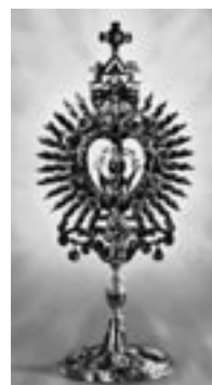
Relikvija Presvete Krvi Kristove

U dvorskoj kapelici sv. Križa dvorca Batthyany (čitamo: Baćani ) 1411. godine svećenik je, služeći svetu Misu, posumnjao u mogućnost pretvorbe vina u Kristovu krv. Krv se pojavila u kaležu, a uplašeni svećenik sakrio ju je ispod oltara. Majstor i svećenik zazidali su relikviju u zid iza velikog oltara i obvezali se na vječnu šutnju o tom događaju. Na smrtnoj postelji svećenik je odao tajnu. Papa Leon X. izdaje bulu 14. travnja 1513. godine kojom dopušta štovanje svete relikvije na temelju izjava svjedoka o čudesnim ozdravljenjima. Relikvija se čuva u baroknoj zlatnoj pokaznici.