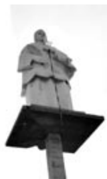
Kip svetog Vinka