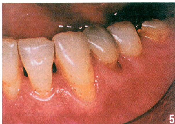
Slika 4. Izolirana abfrakcijska lezija klinastog oblika Figure 4. Single tooth abfraction wedge shaped lesion.