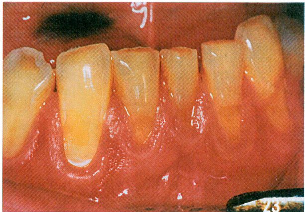
Slika 3. Abrazija zubnoga vrata

Cervikalne lezije, za koje se drži da su nastale zbog abrazije, imaju oštre rubove i tvrdu glatku površinu na kojoj se opažaju ogrebotine, za razliku od erozija koje su plitke i nemaju oštre rubove. Oblik abrazivnih lezija može biti različit, od jednostavnih žljebova glatkoga dna, defekata C-oblika sa zaobljenim stijenkama, podminirane lezije s ravnom cervikalnom stijenkom i polukružnim okluzalnom stijenkom te tipični žlijeb V-oblika s aksijalno zaobljenim stijenkama. Abrazivne lezije su bez naslaga plaka i boja im je nepromijenjena (28,29) (Slika 3).