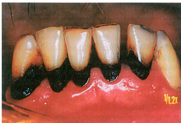
Slika 1a. Cirkularni karijes zubnoga vrata u pacijenta nar-komana