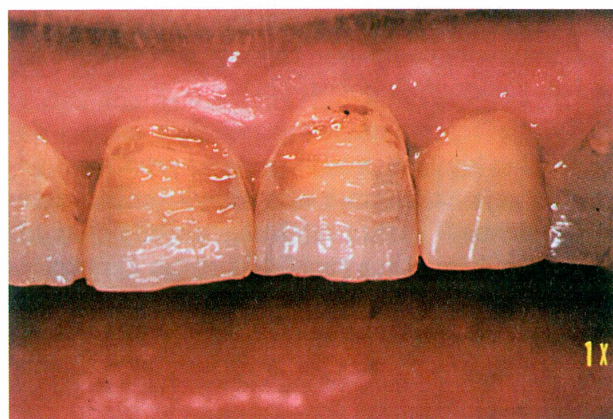
Slika 2. Erozije labijalnih ploha uzrokovane sirovim voćem (limunom)

Vrsta hrane i način na koji se ona uzima utječe na oblik i smještaj erozija. Kiselost hrane nije jedini čimbenik nastajanja i napredovanja erozije. Na