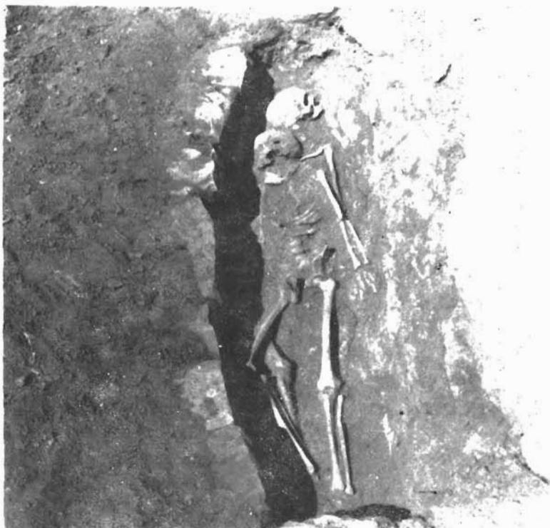
Sl. 3. i 4. Kašić, Mastirine. Grobovi načinjeni od nepravilnog kamena zidanog usuho