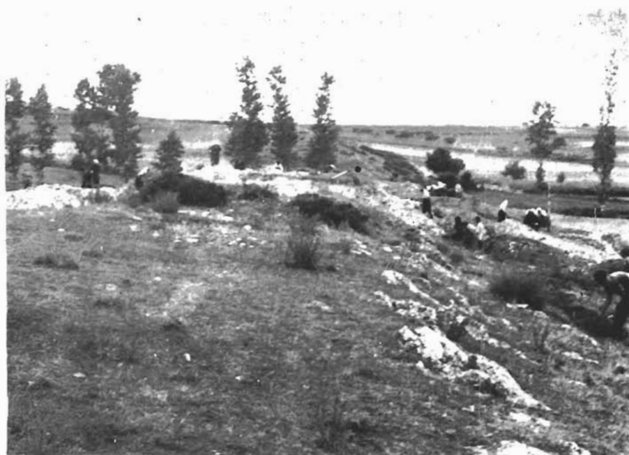
Sl. 1. Kašić, Mastirine. Lokalitet Mastirine prije iskopavanja. Pogled s istoka