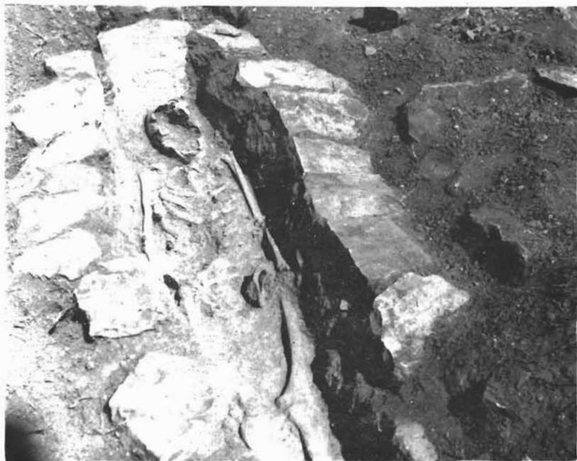
Sl. 7. Kašić, Mastirine. Otkopani grob na živoj stijeni, djelomično načinjen nepravilnim kamenim pločama