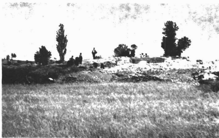
Sl. 2. Kašić, Mastirine. Početak iskopavanja na lokalitetu Mastirine. Pogled sa sjevera