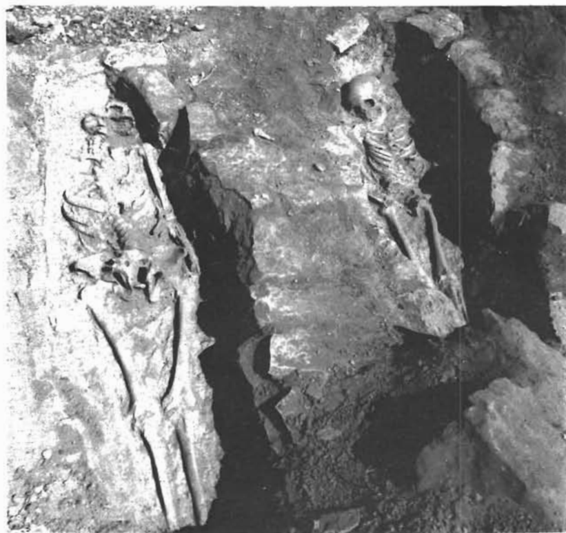
Sl. 9. i 10. Kašić, Mastirine. Otkopani grobovi prije i nakon istraživanja