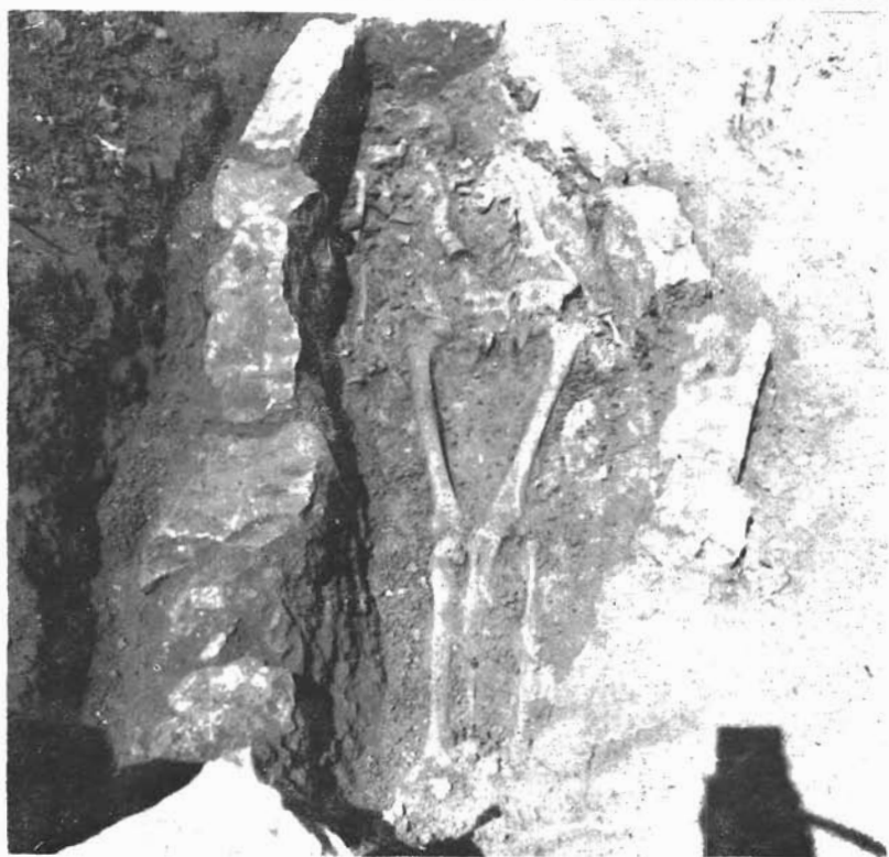
Sl. 5. i 6. Kašić, Mastirine. Grobovi načinjeni od kamenih ploča i neobrađena kamena