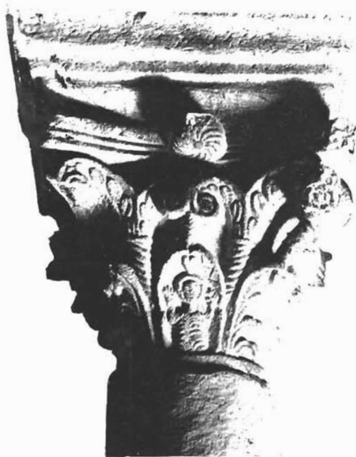
Sl. 2. Kapitel iz sv. Lovre u Zadru