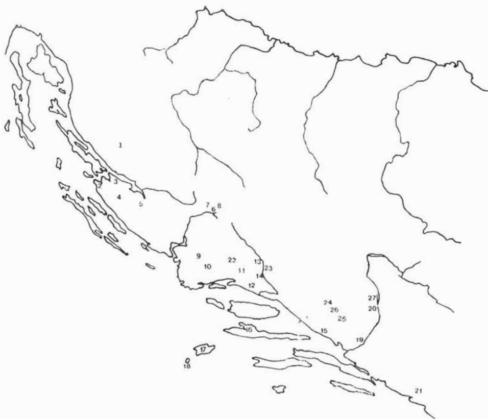
Karta nalazišta zlatnika Romana III na istočnom Jadranu: 1. Lički Osik, 2. Nin, 3. Matak, 4. Nadin, 5. Brgud, 6. Knin-Spas, 7. Orlić, 8. Vrpolje, 9. Danilo, 10. Divojevići, 11. Dugopolje, 12. Poljica, 13. Delongina glavica, 14. Čaporice, 15. Zagvozd, 16. Stari Grad, 17. Vis, 18. Biševo, 19. okolica Narone, 20. Mostar, 21. južna Dalmacija. Ostave: 22. Ogorje, 23. Jabuka, 24. Klobuk, 25. Vitina, 26. Imotski, 27. Drežnica