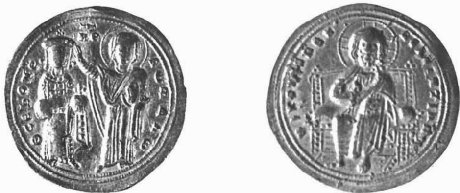
Sl. 1. Zlatnik Romana III Argira, MHAS Split