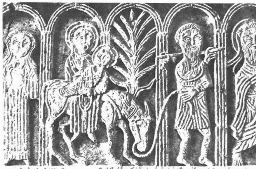
Sl. 1. Detalj s pluteja iz sv. Nediljice u Zadru, Arheološki muzej, Zadar