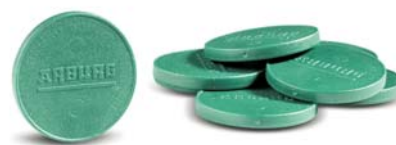
SLIKA 2 – Čipovi