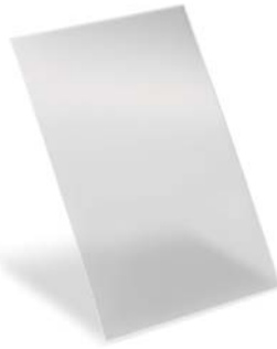
SLIKA 4 – Panel proizveden na ubrizgavalici Allrounder 630 S

Omjer puta tečenja prema debljini stijenke je 350 : 1, vrijeme ciklusa je približno 15 s, jer postupak izravnog prešanja teče usporedno s injekcijskim prešanjem. Otpresak se transportira horizontalnim robotskim sustavom Multilift H , koji je integriran u Selogica kontrolni sustav.