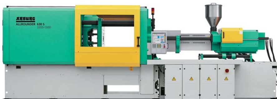
SLIKA 3 – Ubrizgavalica Allrounder 630 S

Tvrtka Arburg na ubrizgavalici Allrounder 630 S (slika 3) sile zatvaranja 2 500 kN proizvela je lagane vodičke panele za TFT ekrane koji štede energiju LED pozadinskim obasjavanjem (slika 4). S obzirom na potrebnu odgovarajuću optičku prozirnost i debljinu panela (0,5 mm), postupak injekcijskog prešanja kombiniran je s postupkom izravnog prešanja.