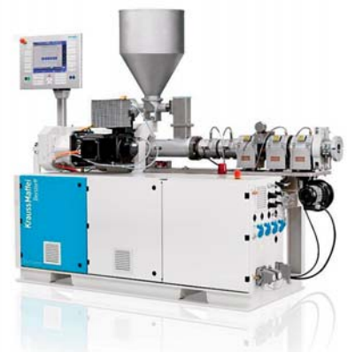
SLIKA 6 – Dvopužni ekstruder tvrtke KraussMaffei Berstorff

Tvrtka KraussMaffei Berstorff predstavila je KMD 35-26/L , najmanji paralelni inverzan dvopužni laboratorijski ekstruder (slika 6), koji je namijenjen razvoju novih materijala. Zahvaljujući paralelnom 26 L/D procesoru, dvopužni ekstruder može simulirati jako malu potrošnju materijala. Materijal se miješa u malim količinama i optimira u naknadnim testnim serijama prije nego što se velike količine materijala upotrijebe u proizvodnim strojevima, i time uvelike pridonosi uštedi. Prikladan je za sve komercijalne krute i savitljive PVC smjese. U ponudi su razne geometrije pužnog vijka za cijevi, profile i ekstrudiranje trakova (folija). Kapacitet ekstrudera za proizvodnju profila je 15 – 40 kg/h, a za cijevi 30 – 70 kg/h. Ekstruder upotrebljava C5 kontrolni sustav.