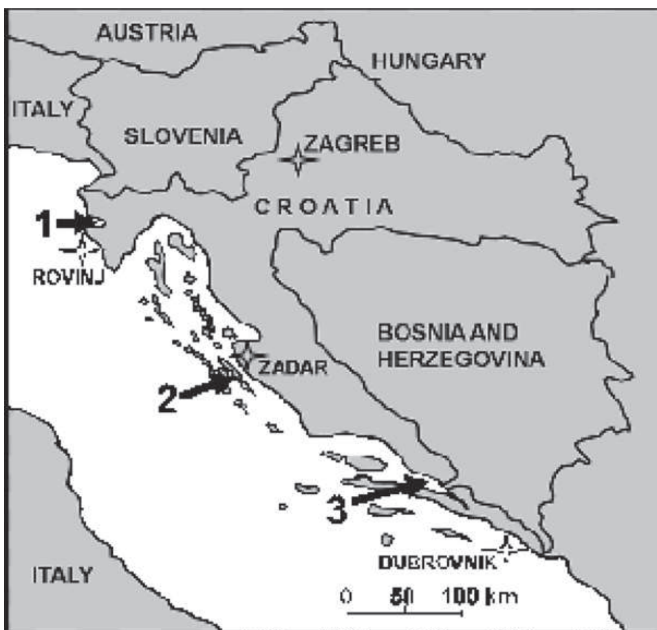
Slika 1. Karta lokaliteta uzorkovanja: 1 - Limski kanal; 2 - Ugljan; 3 - Pelješac Fig. 1. The map of the sampling sites: 1 - Lim channel; 2 - Ugljan; 3 - Pelješac