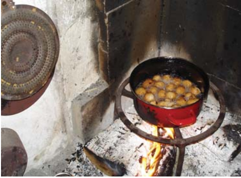
3.09 Frižu se prikle Prikle (a kind of doughnuts) are being fried.