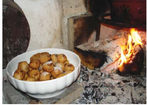
3.10 Prikle su gotove

Prikle boje uskisnu na toplo. Pa prsuru na tri-pije i po komodu. Brže se izidu nego se isfrižu. Ma ne va da je veli oganj, nego pomalo.