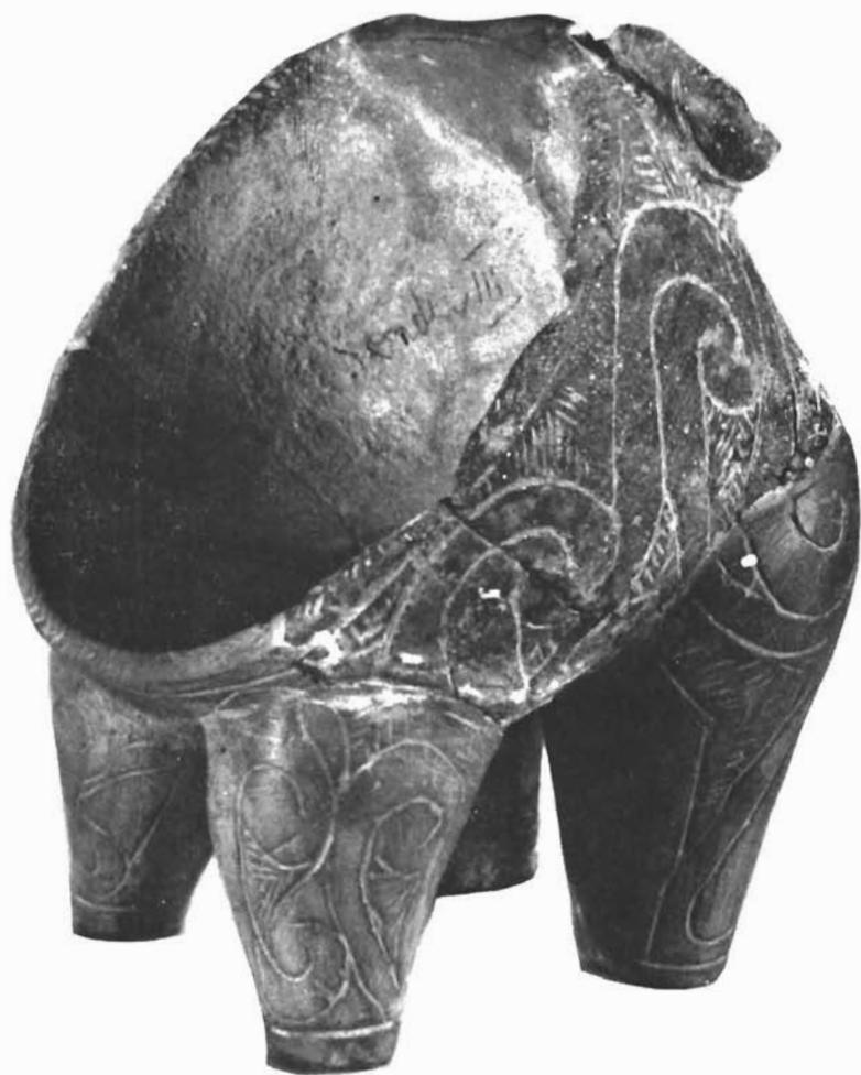
Prehistorijska kulna vaza