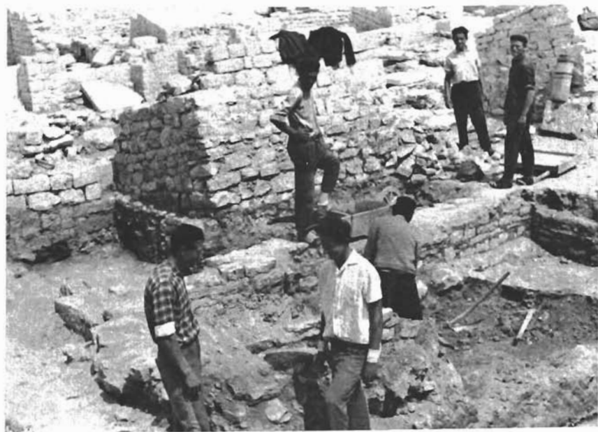
Sl. 1. Pogled na Bribirske Mostine s Glavice