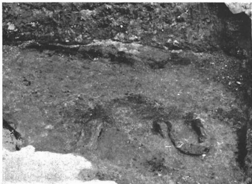
Bribirska Glavica, prehistorijske peći