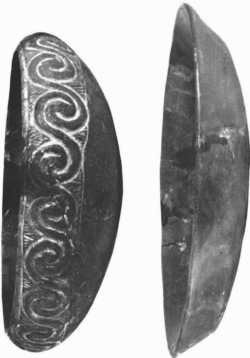
Starija prehistorijska keramika