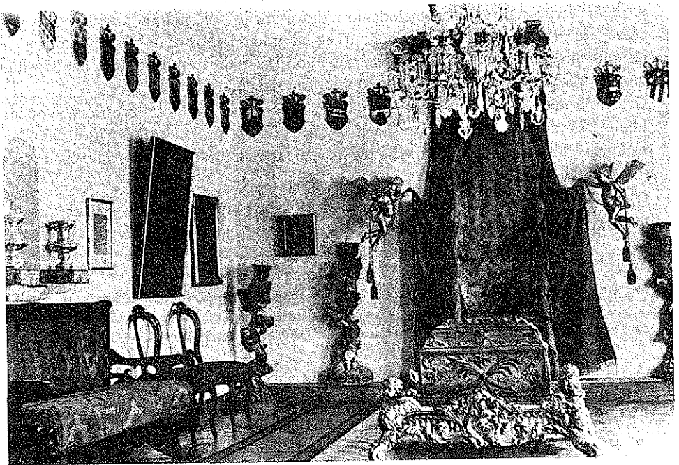
Korčula: Opatska riznica – Barokna dvorana